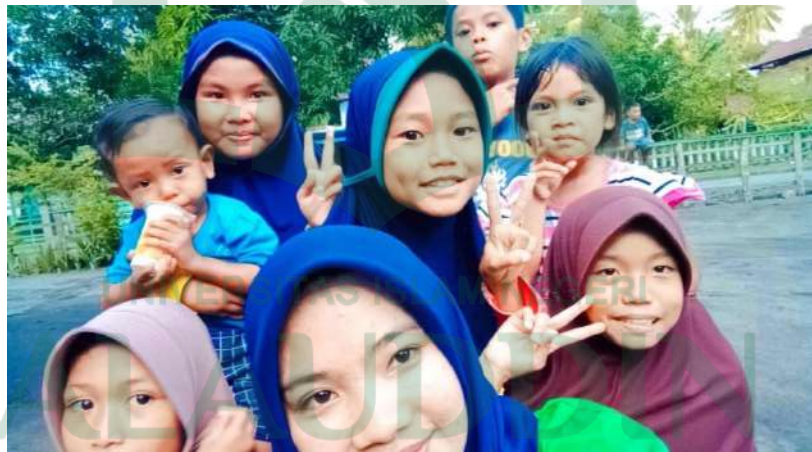
Bersama dengan anak-anak Kecil Desa Palakka Kecamatan Maiwa Kabupaten Enrekang