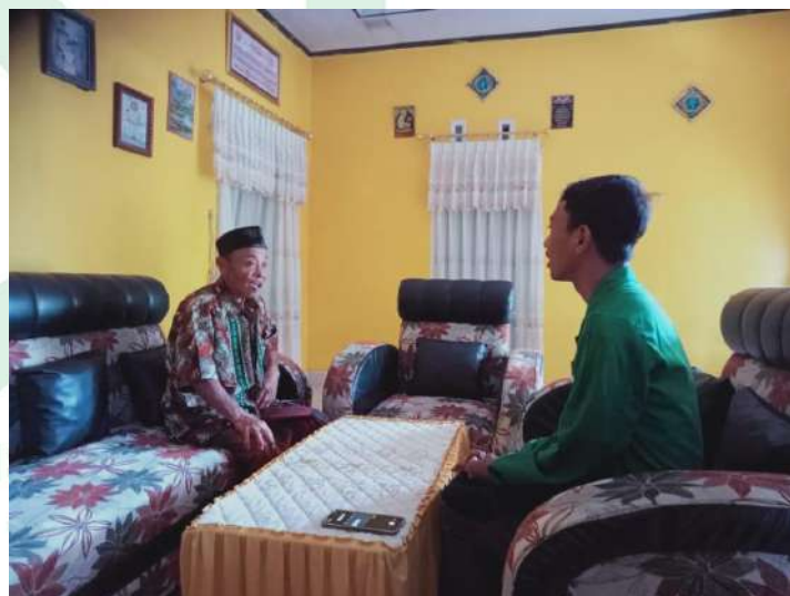
Proses Saat Wawancara