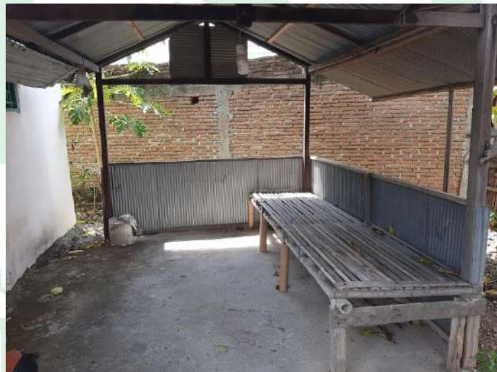
Tempat Istirahat Dewan Adat