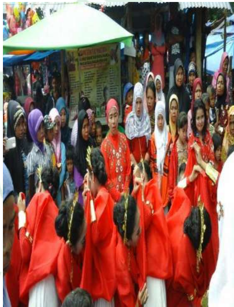
Penampilan Tarian Paolle