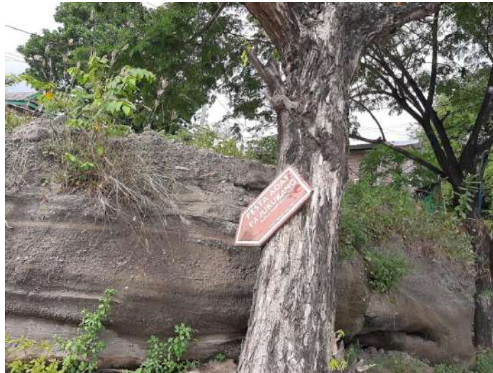
Papan nama tradisi Pa'jujukang