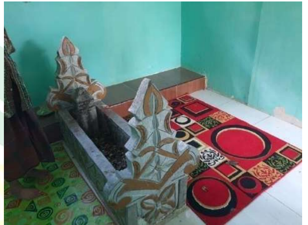
Makam Leluhur Pa'jukukang