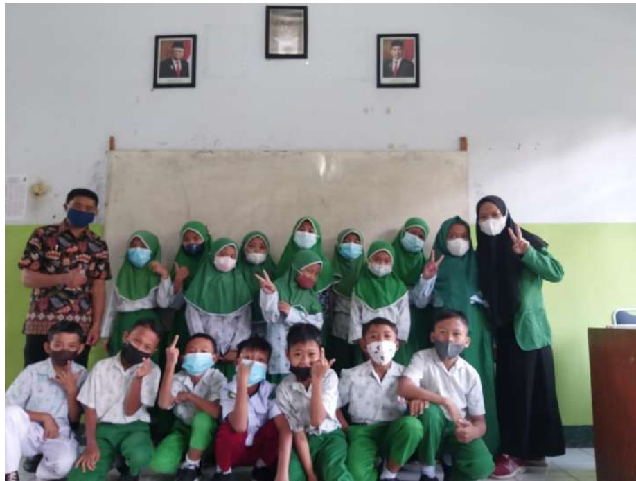
❖ Foto bersama kepala Sekolah dan Para Guru di MIN I Tana Toraja