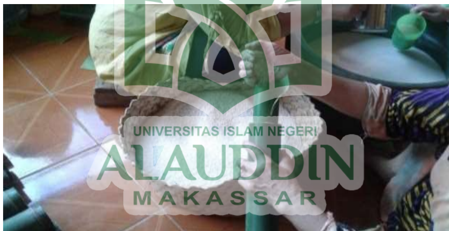
Gambar 6 Proses ammone (mengisi) bambu dengan beras ketan yang tidak dikukus

Lemang yang mula-mula dibuat akan dipisah, karena akan diberikan kepada pinati atau tokoh adat sebagai syarat dari tradisi A'lammang bagi mereka yang mempercayainya. Proses membawa lemang yang mula-mula dibuat kepada pinati dinamakan ngerang bungasa '. Satu kepala keluarga akan membawa 1 lemang ke rumah pinati sebagai syarat dari tradisi ritual A'lammang ini.