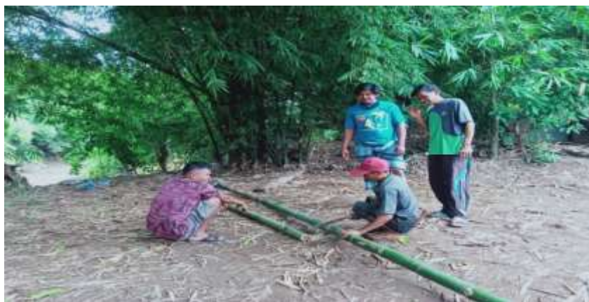
Gambar 3 Proses angngalle bulo (Mengambil bambu)

Angngalle bulo adalah proses pertama, proses angngalle bulo atau mengambil bambu dilaksanakan 2 atau 3 hari menjelang acara A'lammanng . Sambil mencari bambu, masyarakat juga biasanya mencari kayu untuk digunakan nanti ketika membakar lemang.