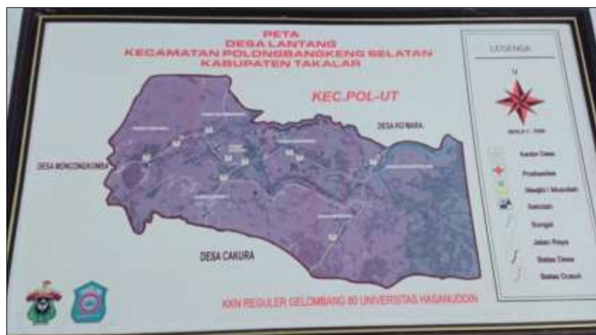
Gambar 1 Peta Desa Lantang

Perjalanan ke tempat penelitian tersebut bisa menggunakan kendaraan seperti motor dan mobil jika dari pusat Kota Takalar. Dari kota Makassar menuju ke Desa Lantang kita akan melewati wilayah Kabupaten Gowa dengan menggunakan jalan poros. Dari perbatasan antara Kabupaten Gowa dan Kabupaten Takalar, kita akan melewati beberapa wilayah yaitu Palleko', Manongkoki, Pa'bentengang, Biringbalang, Maradekaya, dan Moncongkomba.