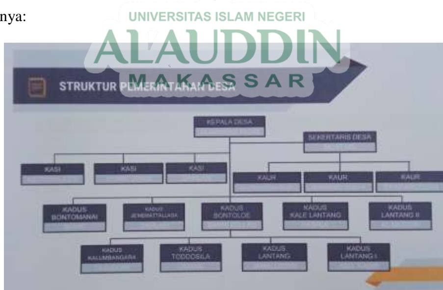
Gambar 2 Struktur Pemerintahan Desa Lantang

Berikut adalah struktur pemerintahan Desa Lantang beserta jajaran-jajarannya: