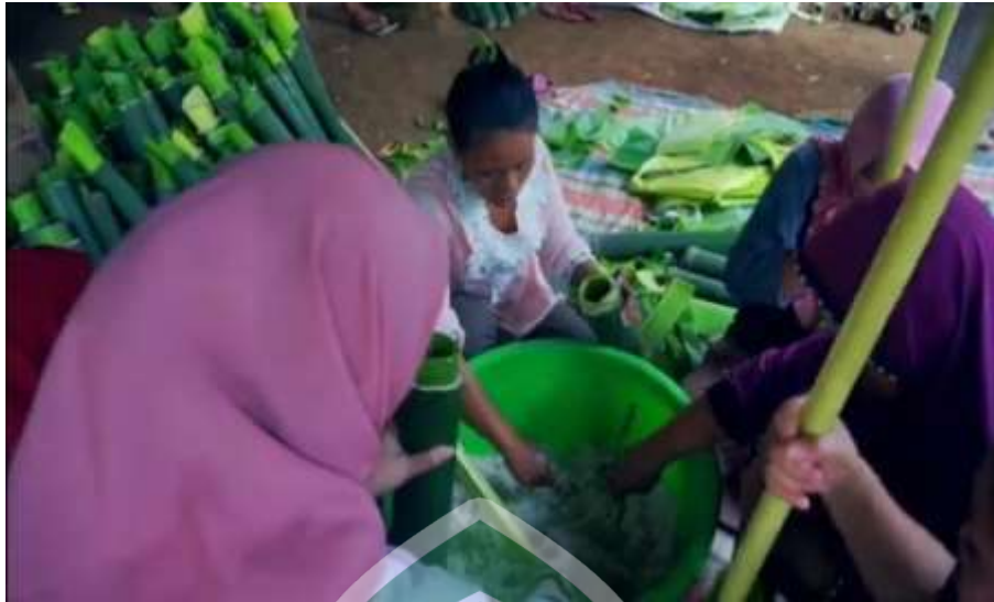
Gambar 5 Proses ammone (mengisi) bambu dengan beras ketan yang dikukus