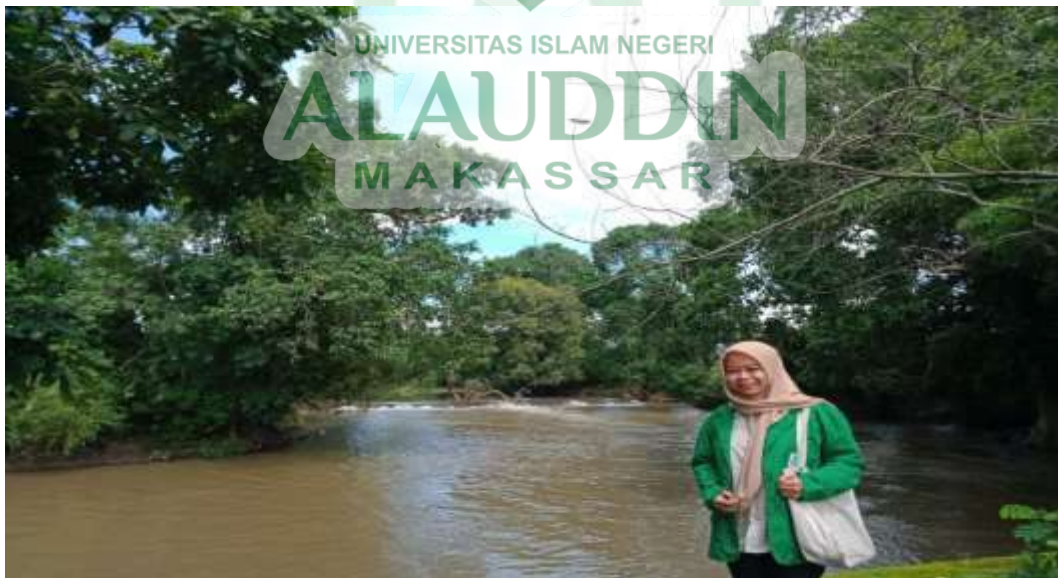
Sungai Lantang (tempat dilaksanakannya Appasorong )