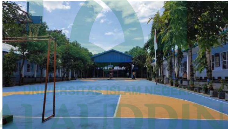
Halaman Sekolah SMA Angkasa Lanud Sultan Hasanuddin Kabupaten Maros