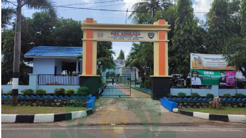
Tampak Depan SMA Angkasa Lanud Sultan Hasanuddin Kabupaten Maros