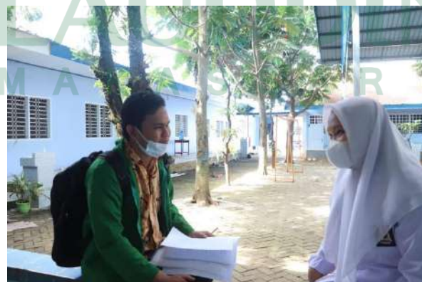
Proses wawancara dengan Peserta Didik di SMA Angkasa Lanud Sultan Hasanuddin Kabupaten Maros.