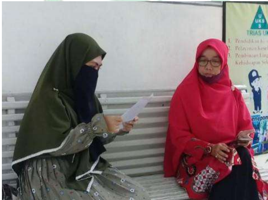
Gambar Wawancara Peneliti dengan Guru Akidah Akhlak Kelas VIII.2