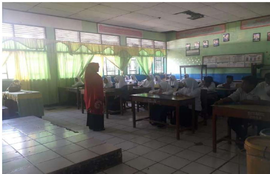
Gambar Penyampaian Metode Kisah Islami Oleh Guru Akidah Akhlak