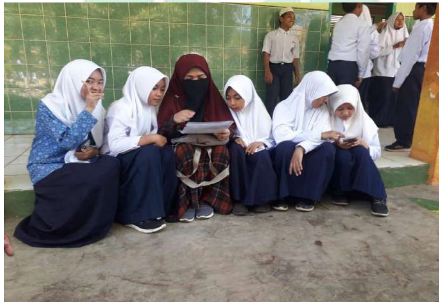
Gambar Wawancara Peneliti dengan Peserta didik