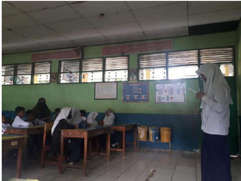
Gambar Salah Satu Peserta Didik yang Mempresentasikan Hasil Diskusinya Terkait Materi Ikhtiar dan Tawakkal