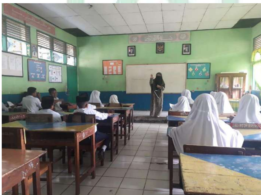
Gambar Penyampaian Metode Kisah Oleh Peneliti