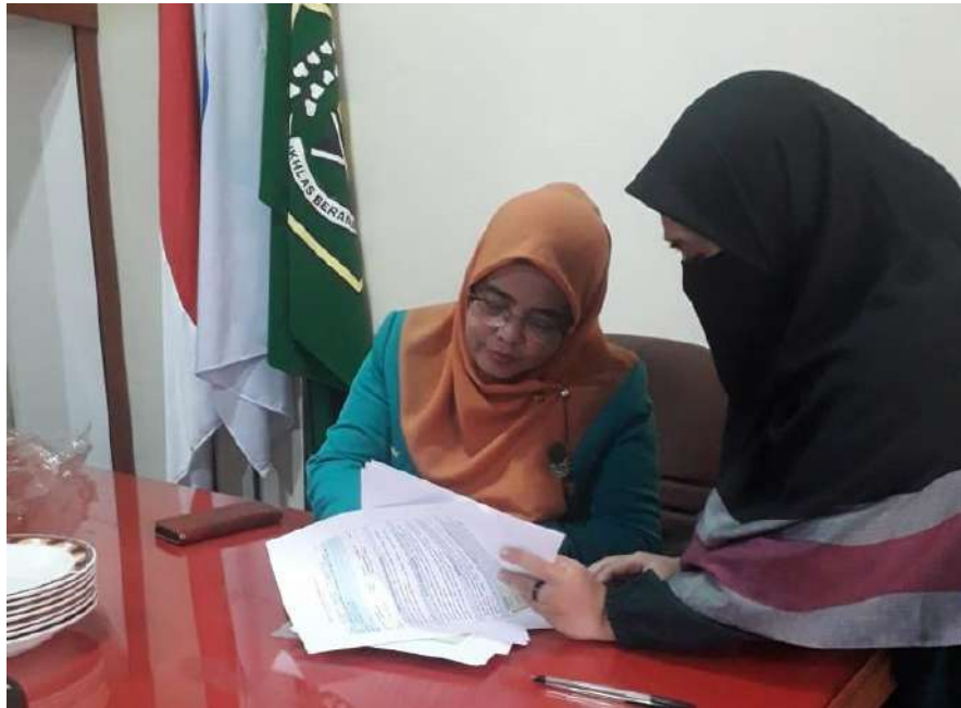
Gambar Wawancara Peneliti dengan Kepala Sekolah MTs Negeri 2 Jeneponto