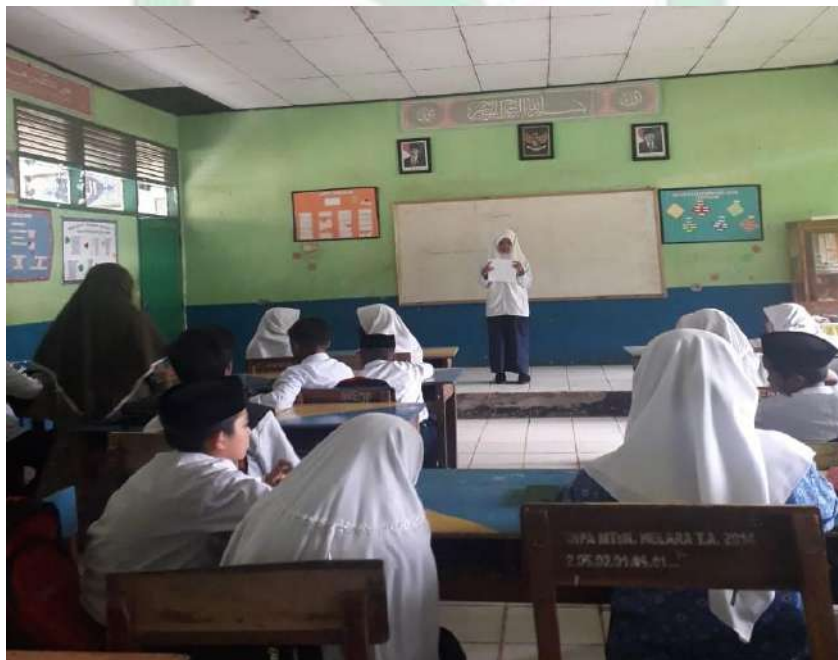
Gambar Salah Satu Peserta Didik yang Mempresentasikan Hasil Diskusinya Terkait Materi Sabar, Syukur dan Qana'ah