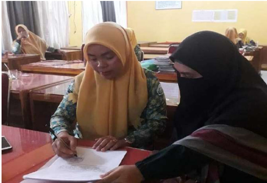
Gambar Wawancara Peneliti dengan Wali Kelas VIII.2