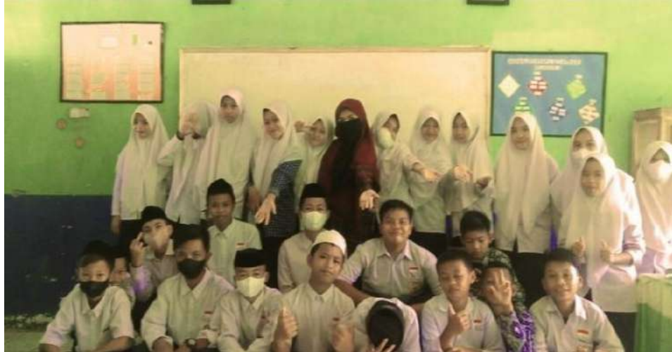
Gambar Antusias Peserta Didik Setelah Menerima Materi Akhlak Terpuji dengan Menggunakan Metode Kisah