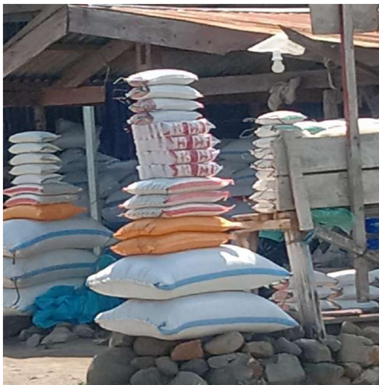
Foto 3. Garam dalam kemasan karung kecil dengan harga 3000/5000