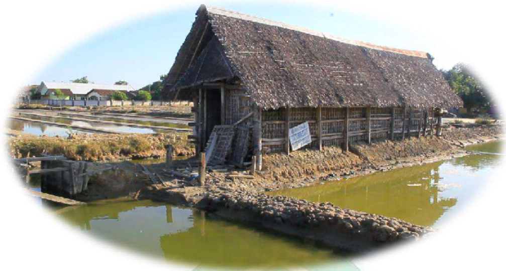
Foto 5. Gubuk penyimpanan hasil produksi garam petani