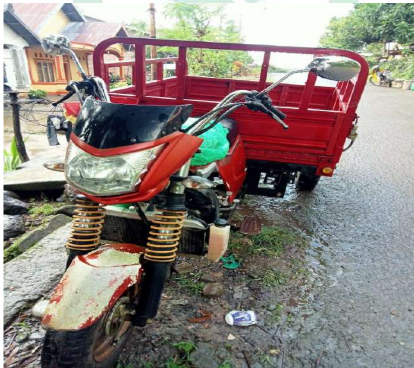
Foto 8. Kendaraan beroda tiga/bentor yang digunakan untuk membawa hasil produksi garam petani