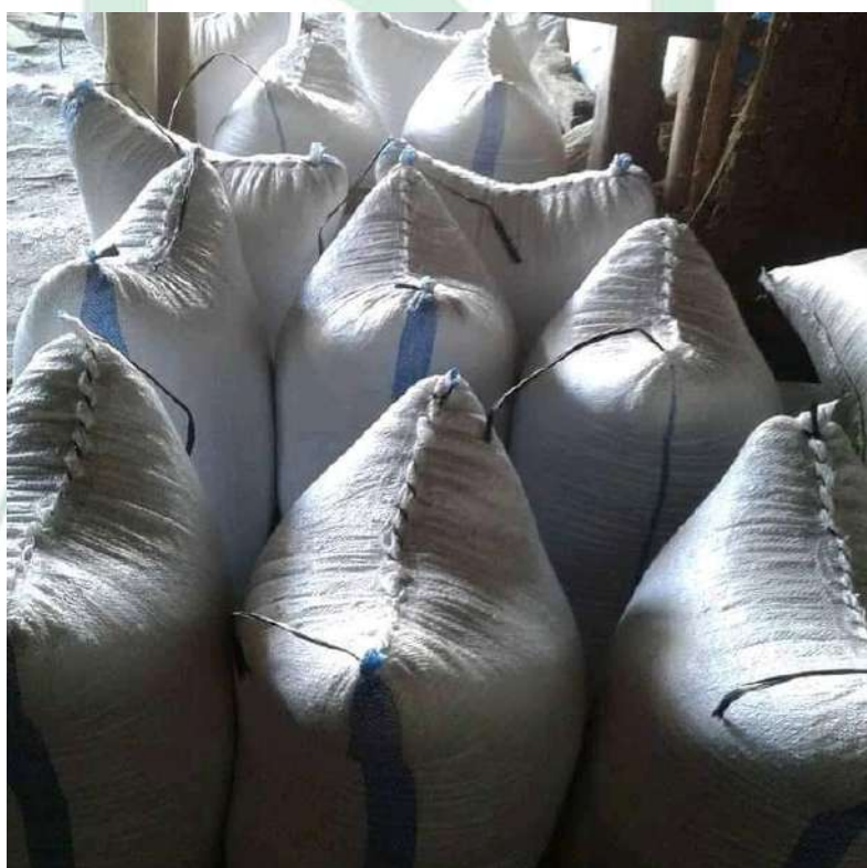
Foto 4. Garam dalam kemasan karung dengan harga 70.000/100.000