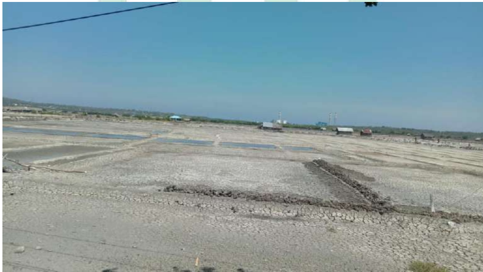
Foto 2. Tambak Garam