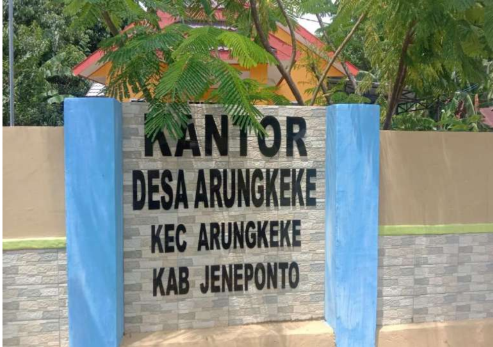
Foto 1. Kantor Desa Atungkeke