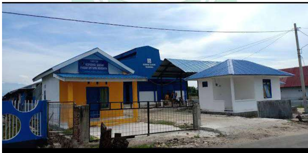
Foto 6. Gudang penyimpanan garam hasil produksi garam petani