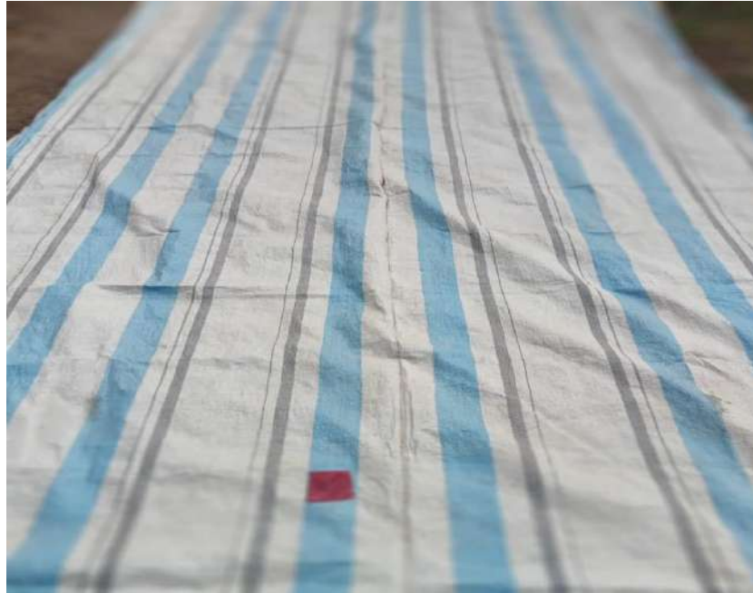
Foto 7. Terpal yang digunakan untuk alas dalam proses produksi garam