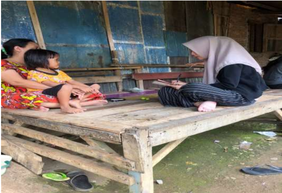
Gambar 17. Wawancara dengan ibu,umur 38 tahun (IRT/masyarakat)