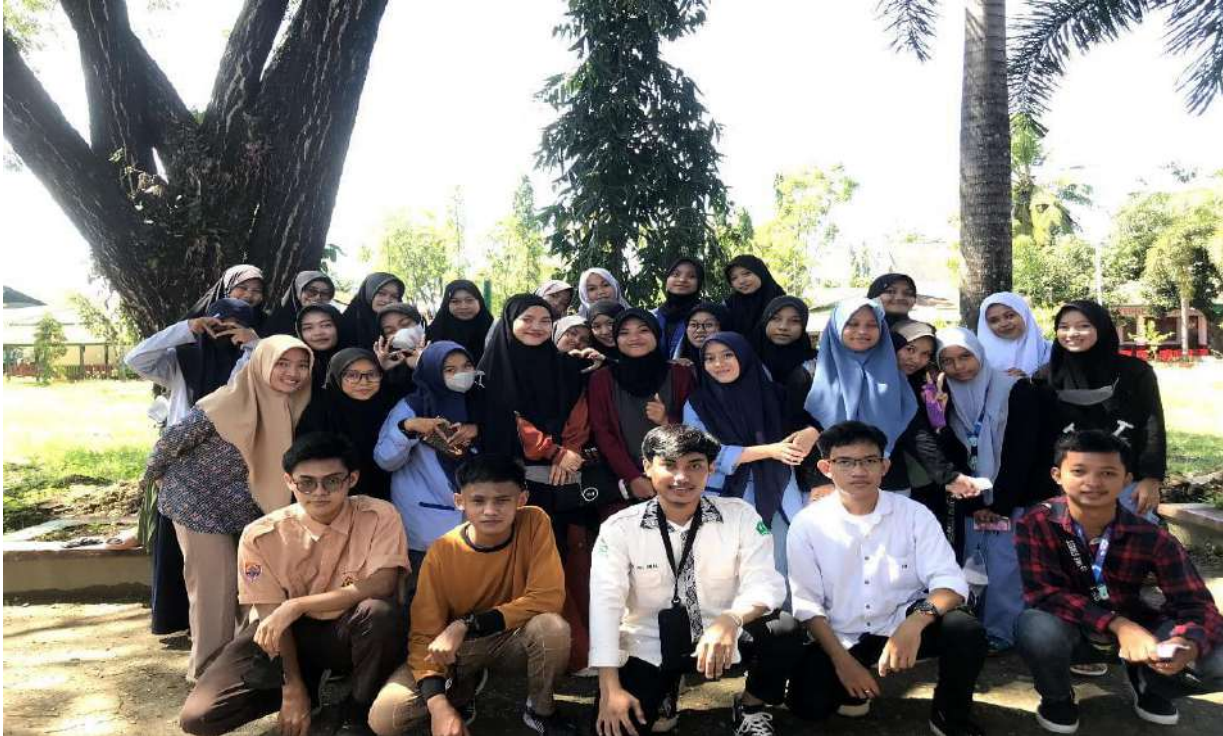
Proses Pembelajaran Peserta didik kelas XI