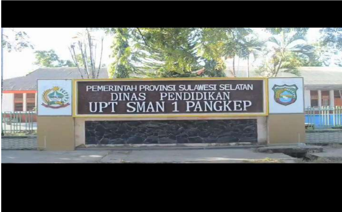
Foto Pengurus Organisasi Siswa Intra Sekolah (OSIS) SMA Negeri 1 Pangkep