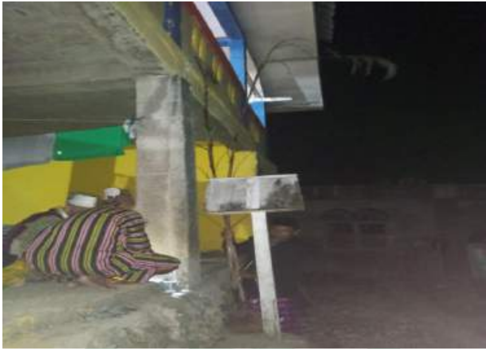
Gambar 16 : Baca doa di rumah-rumah kecil yang berada di bawah bangunan baruga (rumah adat) Desa Laburunci Kecamatan Pasarwajo Kabupaten Buton.