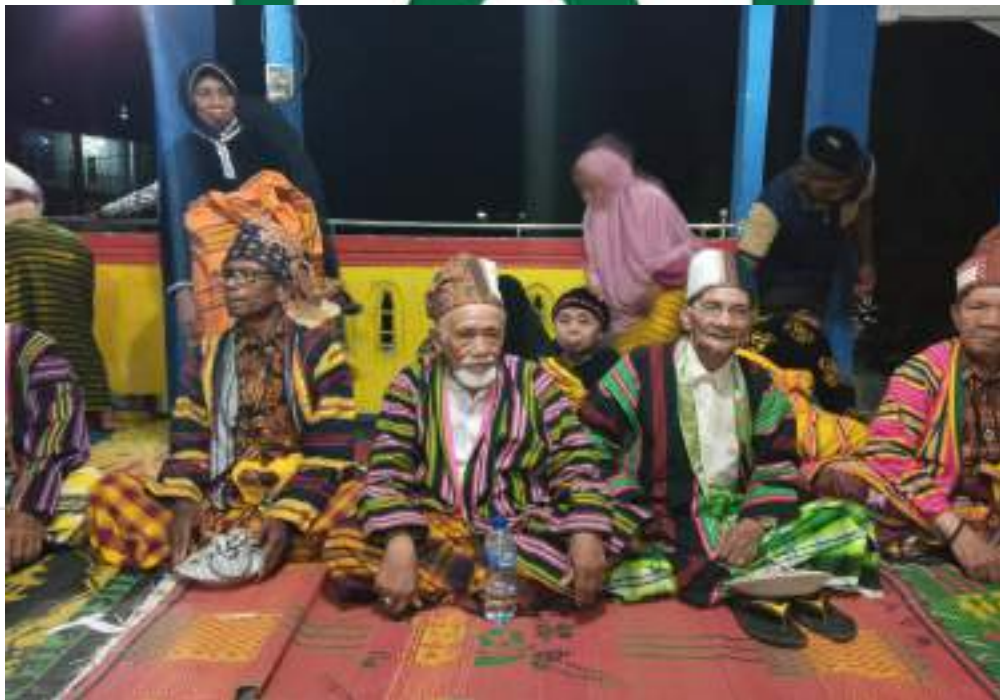
Gambar 23 : Para Tokoh Adat dan Iyaronya Suku Cia-Cia di Desa Laburunci Kecamatan Pasarwajo Kabupaten Buton.