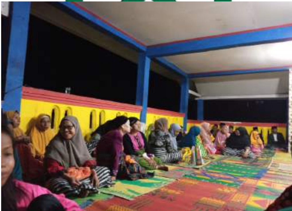
Gambar 8 : Masyarakat yang menghadiri pelaksanaan tradisi kalemba-lemba di dalam baruga (rumah adat).