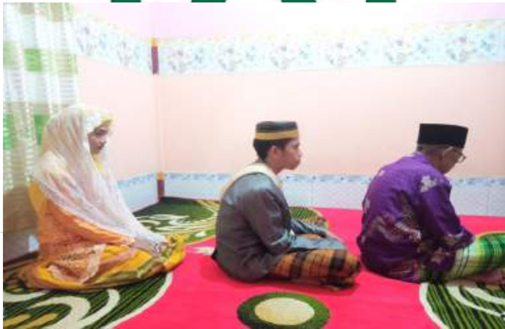
Gambar 5 : Potadea sebelum pergi ke baruga di rumah pelaku tradisi kalemba-lemba perempuan.