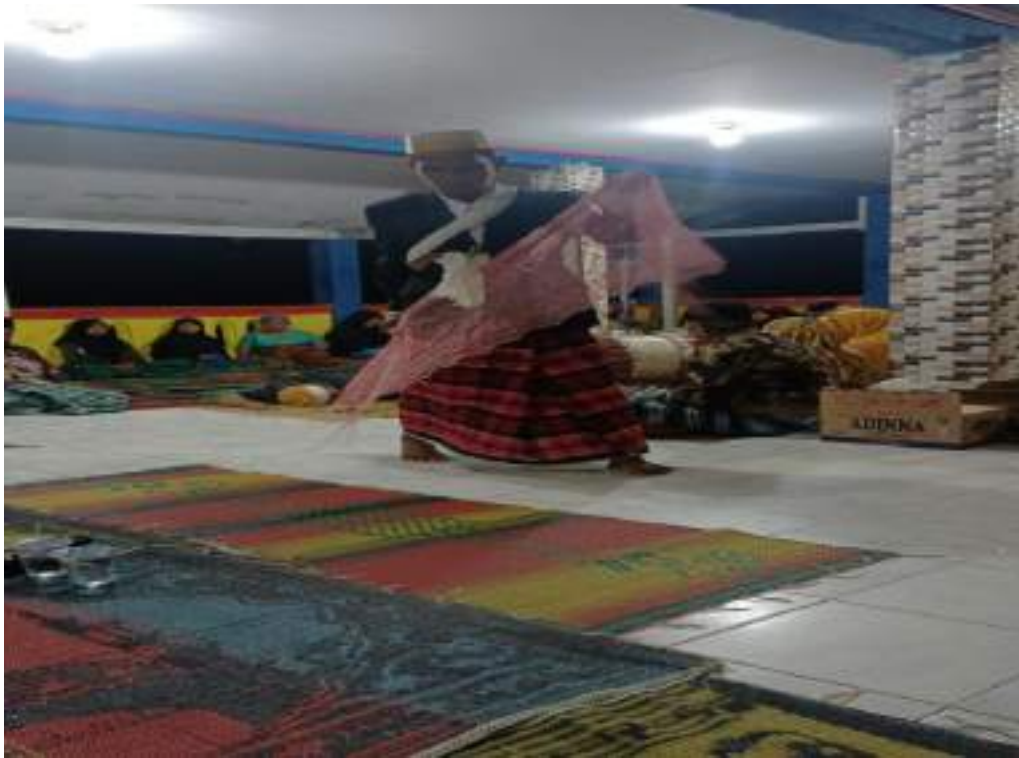
Gambar 6 : Tari Batanda yang dilakukan oleh salah satu pelaku kalemba-lemba laki-laki di dalam baruga (rumah adat).