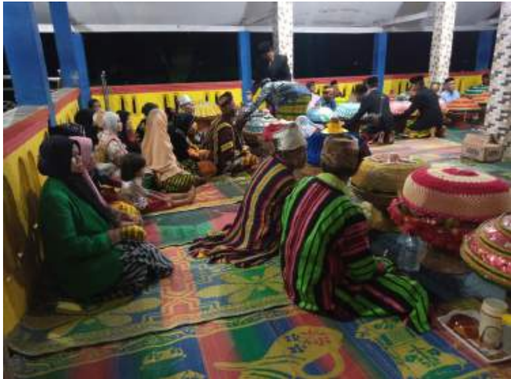
Gambar 20 : Suasana di dalam baruga (rumah adat) pada acara terakhir pelaksanaan tradisi kalembe-lemba .