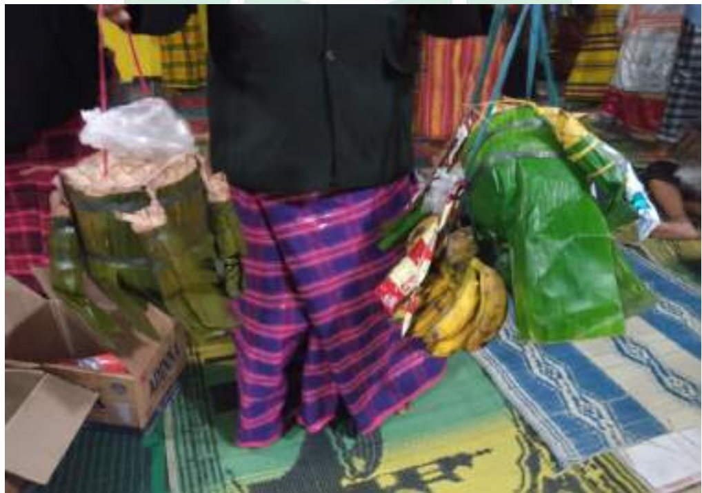
Gambar 21 : Sesaji-sesaji yang digunakan saat ritual Bululie Galampa pada acara terakhir tradisi kalembe-lemba di dalam baruga (rumah adat).