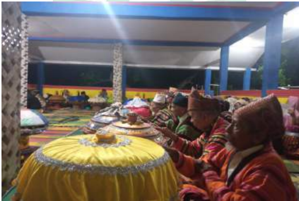
Gambar 9 : Melakukan doa bersama sebelum makan bersama pada acara terakhir pelaksanaan tradisi kalemba-lemba di baruga (rumah adat).