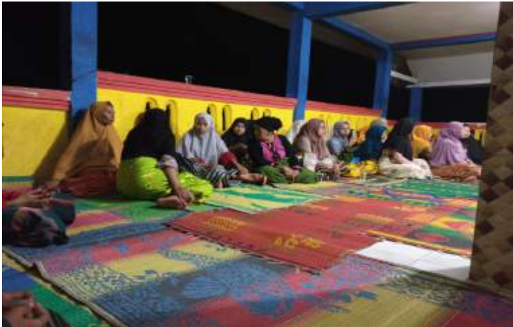
Gambar 7 : Masyarakat yang menghadiri pelaksanaan tradisi kalemba-lemba di dalam baruga (rumah adat)