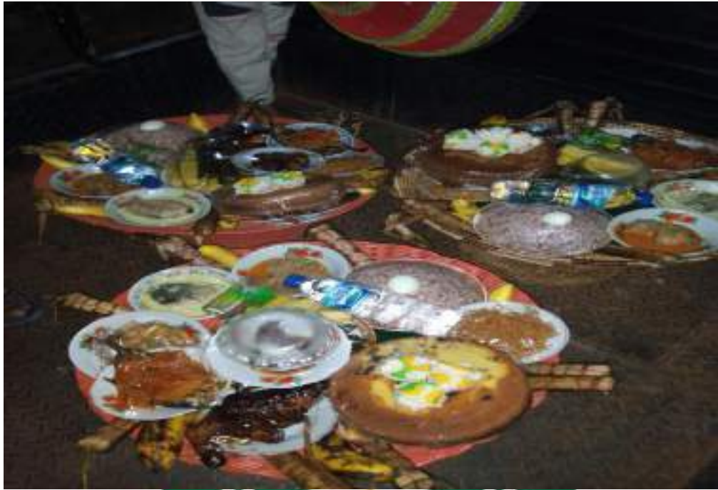
Gambar 14 : salah satu isi makanan dalam talang yang dibawa ke baruga (rumah adat).