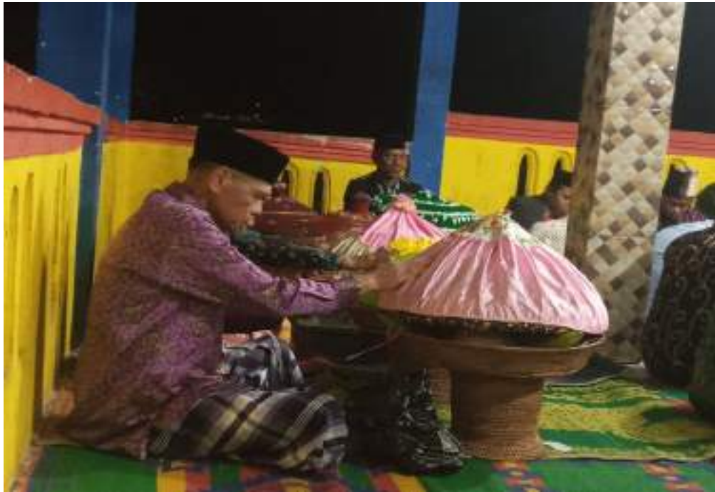
Gambar 10 : Melakukan doa bersama sebelum makan bersama pada acara terakhir pelaksanaan tradisi kalemba-lemba di baruga (rumah adat).