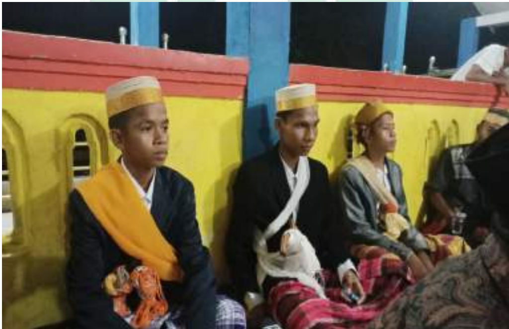
Gambar 4 : Tiga (3) orang kalemba-lemba laki-laki Suku Cia-Cia di Desa Laburunci Kecamatan Pasarwajo Kabupaten Buton.