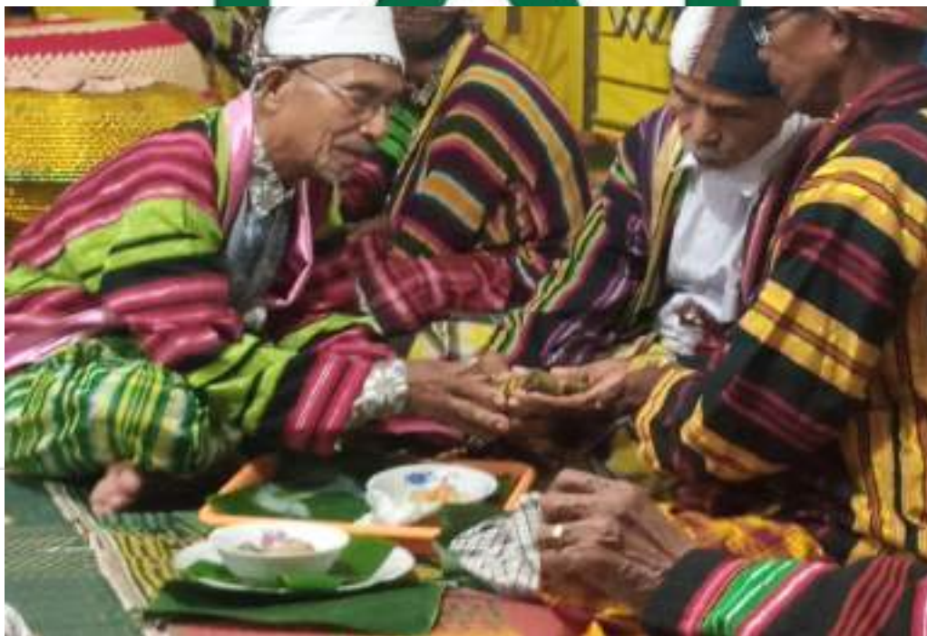
Gambar 19 : Para tokoh adat dan Iyaro tokoh adat melakukan ritual posambua di dalam baruga (rumah adat).