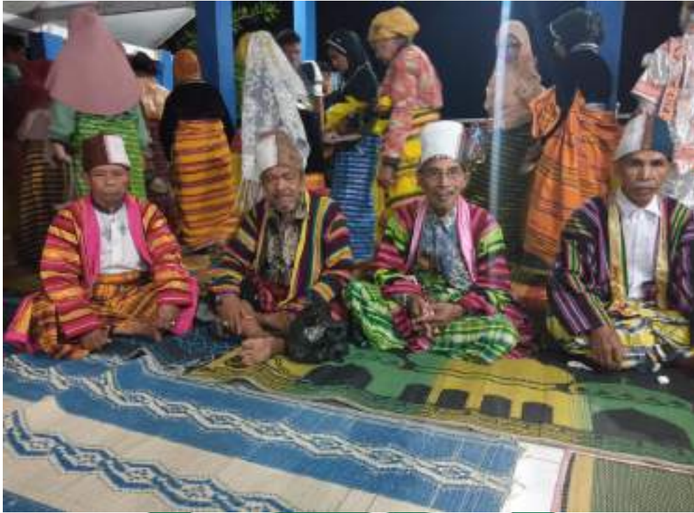
Gambar 22 : Para tokoh adat dan Iyaronya Suku Cia-Cia di Desa Laburunci Kecamatan Pasarwajo Kabupaten Buton.