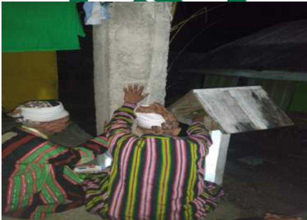
Gambar 15 : Baca doa di rumah-rumah kecil yang berada di bawah bangunan baruga (rumah adat) Desa Laburunci Kecamatan Pasarwajo Kabupaten Buton.