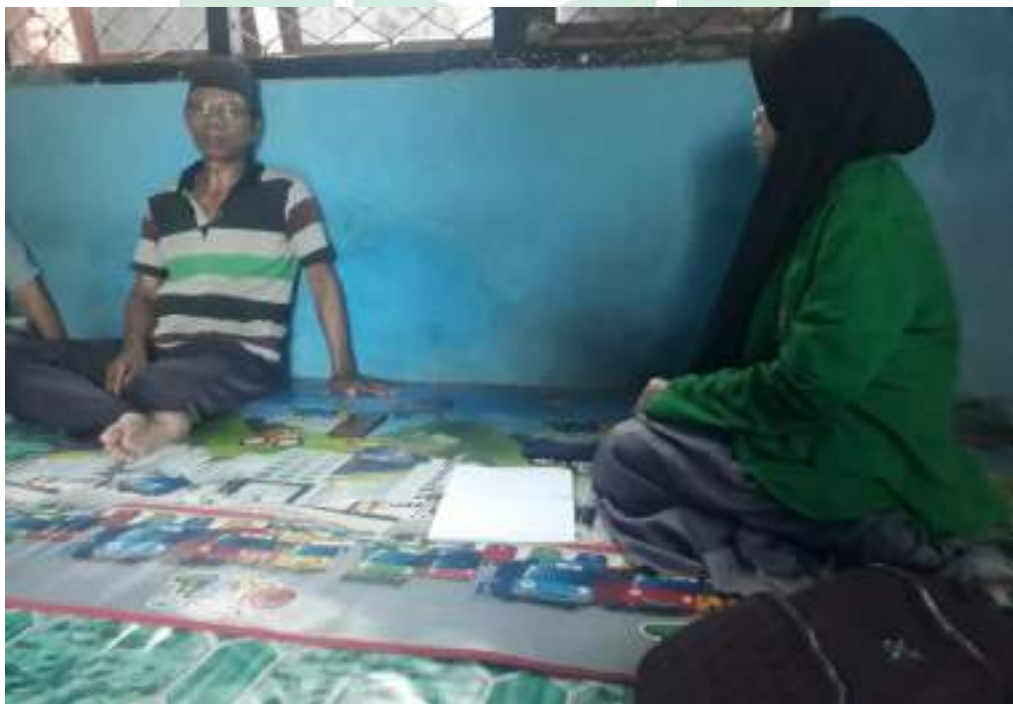
Gambar 25 : Wawancara dengan tokoh adat selaku Moji Desa Laburunci Suku Cia-Cia Laporo di Dusun Ama Andia ( 5 Maret 2022).