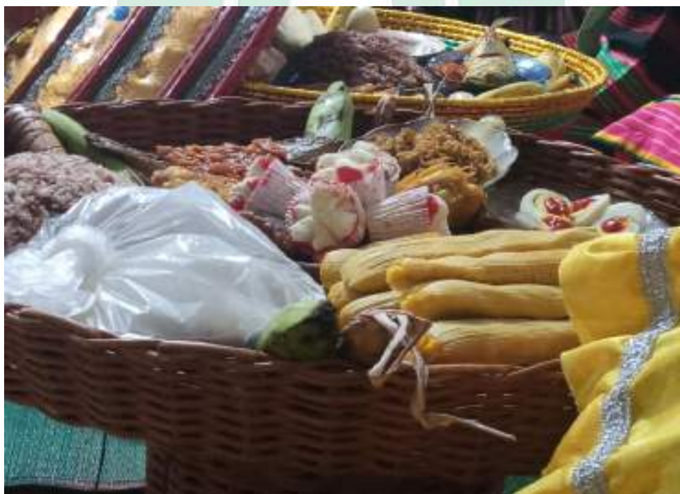
Gambar 13 : Isi makanan dalam talang yang dibawa ke baruga Desa Laburunci Kecamatan Pasarwajo Kabupaten Buton.