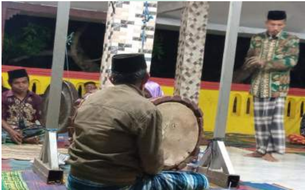
Gambar 7 : Gendang dan gong sebagai alat musik pengiring tari Batanda di dalam baruga (rumah adat).