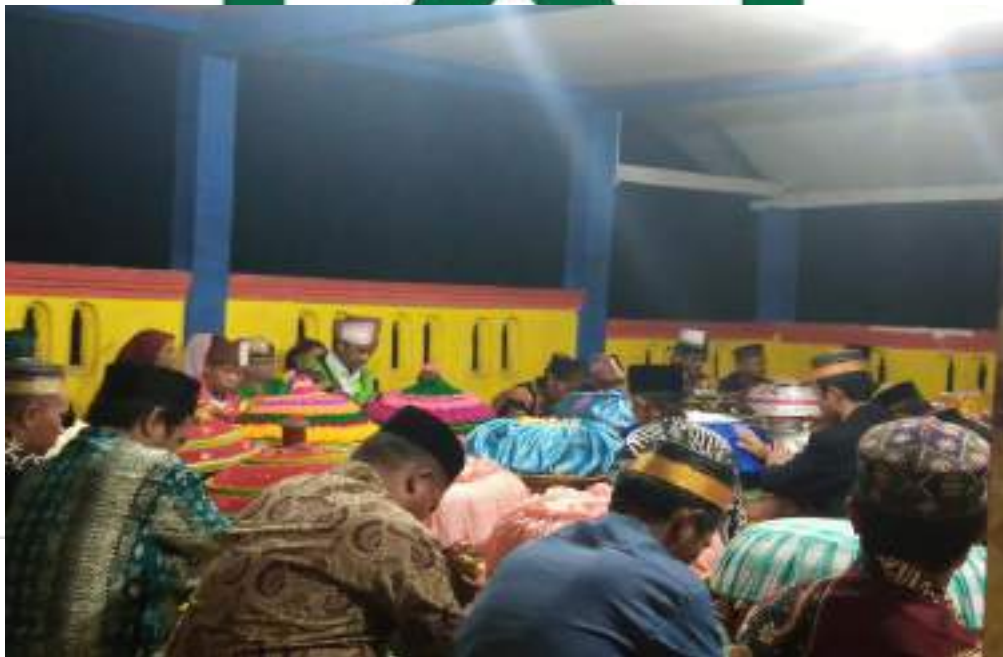
Gambar 11 : Melakukan doa bersama sebelum makan bersama pada acara terakhir pelaksanaan tradisi kalemba-lemba di baruga (rumah adat).