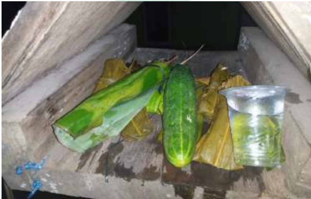
Gambar 17 : Makanan yang di simpan di rumah-rumah kecil yang ada di bawah baruga yang terdiri dari mentimun, lapa-lapa, dan aqua gelas.