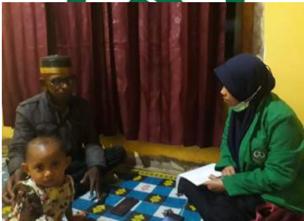
Gambar 27 : Wawancara dengan tokoh adat selaku Waci Desa Laburunci Suku Cia-Cia Laporo Dusun Awaungge ( 8 Maret 2022).