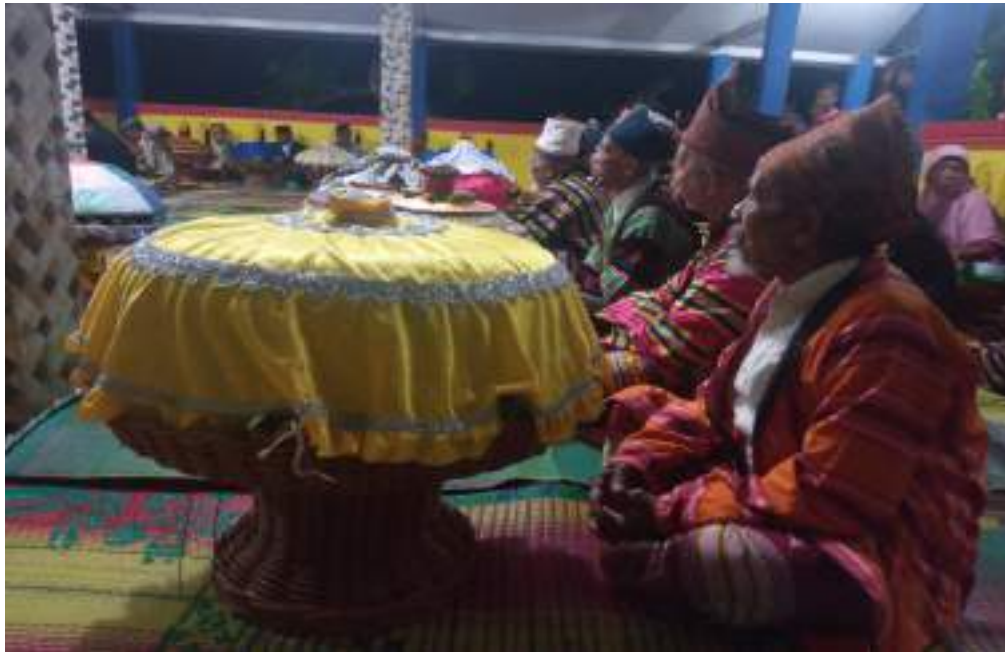
Gambar 8 : Pandesuka (orang pitar) dalam tradisi kalemba-lemba Suku Cia-Cia di Desa Laburunci Kecamatan Pasarwajo Kabupaten Buton.