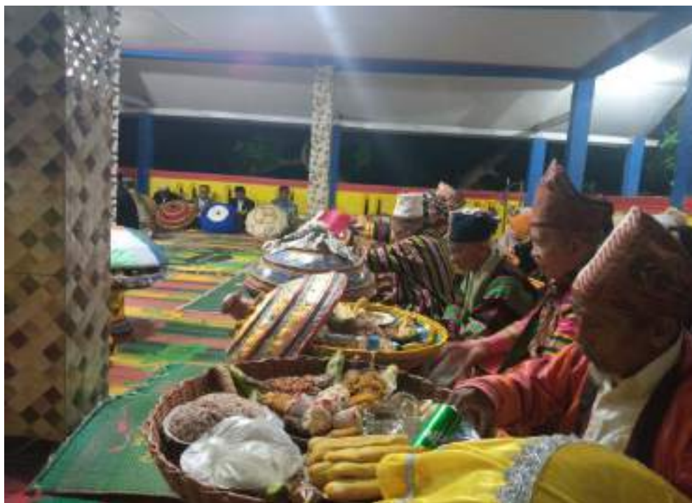
Gambar 12 : Makan bersama di Baruga Desa Laburunci Kecamatan Pasarwajo Kabupaten Buton.