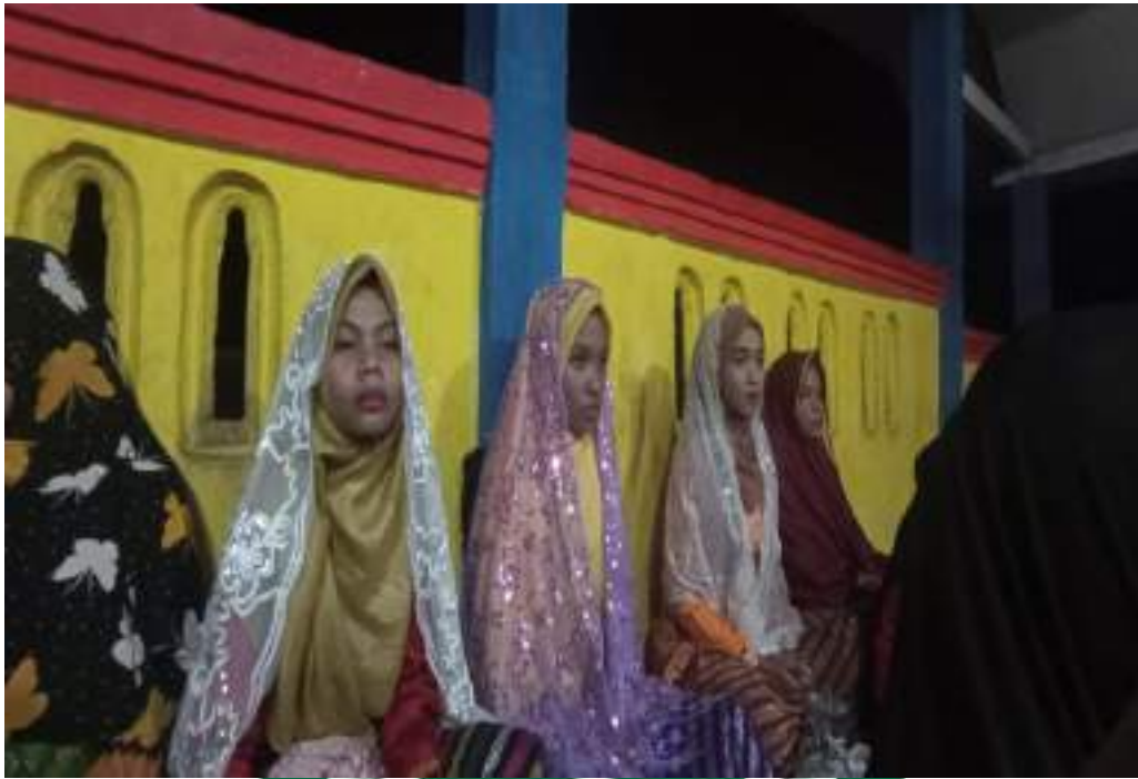
Gambar 4 : Tiga (3) orang kalemba-lemba perempuan Suku Cia-Cia di Desa Laburunci Kecamatan Pasarwajo Kabupaten Buton.