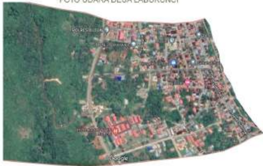
FOTO UDARA DESA LABURUNCI