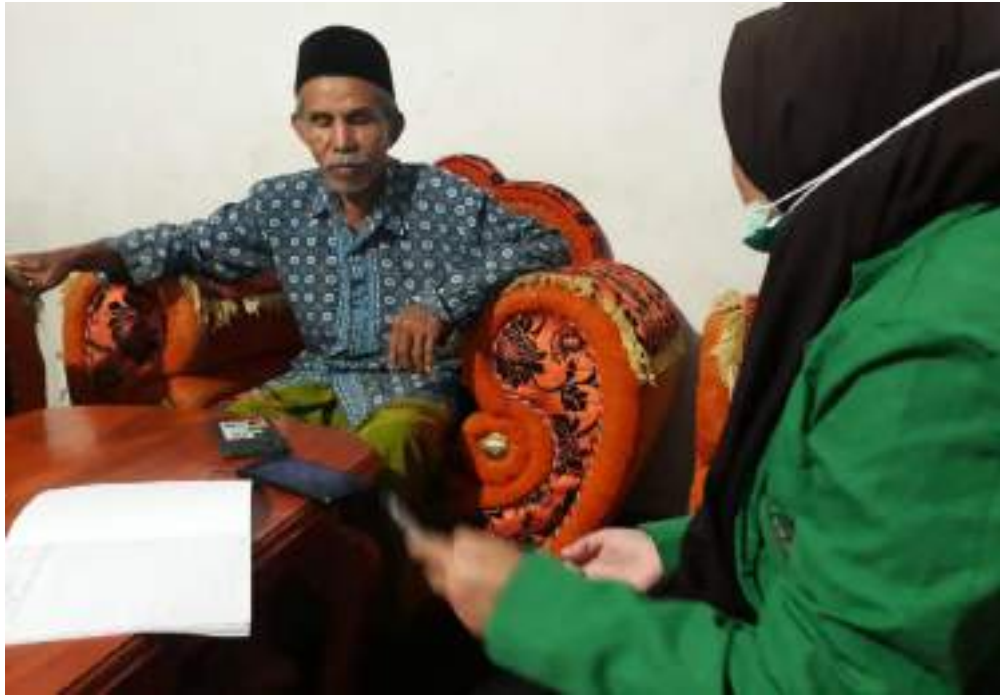
Gambar 24 : Wawancara dengan tokoh adat selaku Parabela Desa Laburunci Suku Cia-Cia Laporo di Dusun Awasurabi ( 2 Maret 2022).