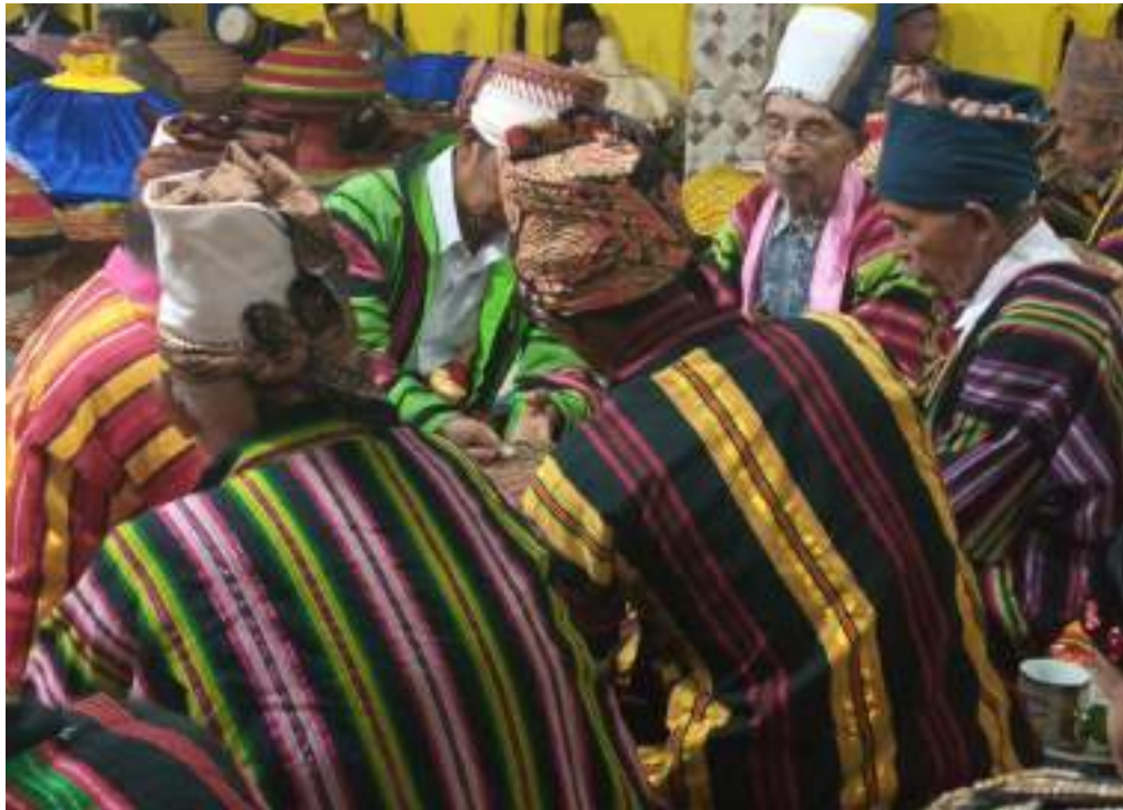
Gambar 18 : Para tokoh adat dan Iyaro tokoh adat melakukan ritual posambua di dalam baruga (rumah adat).