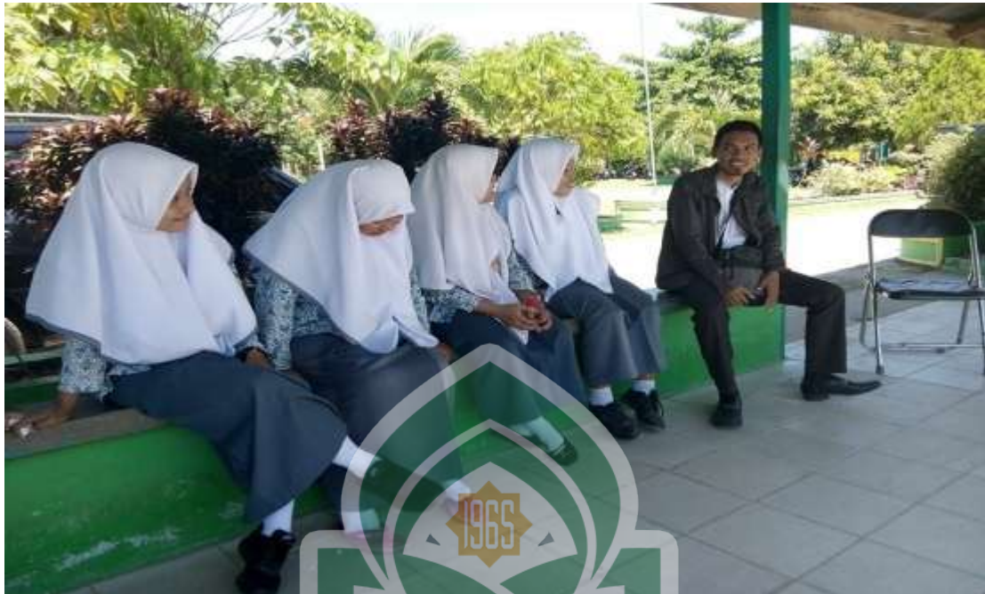
Wawancara dengan peserta didik