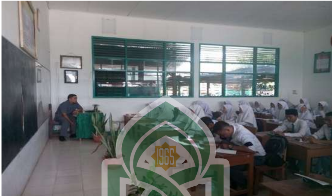
Proses Belajar Mengajar