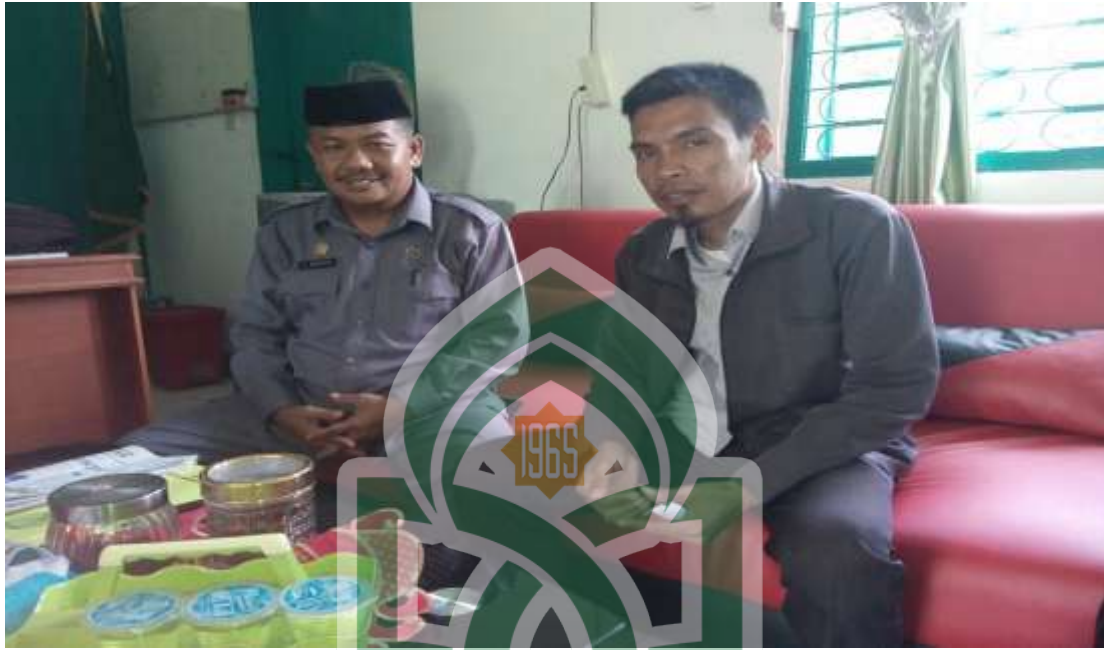
Wawancara dengan Kepala MAN Polewali Mandar