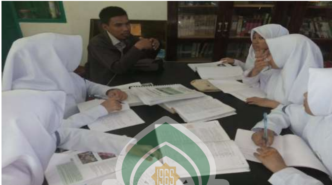
Wawancara dengan peserta didik