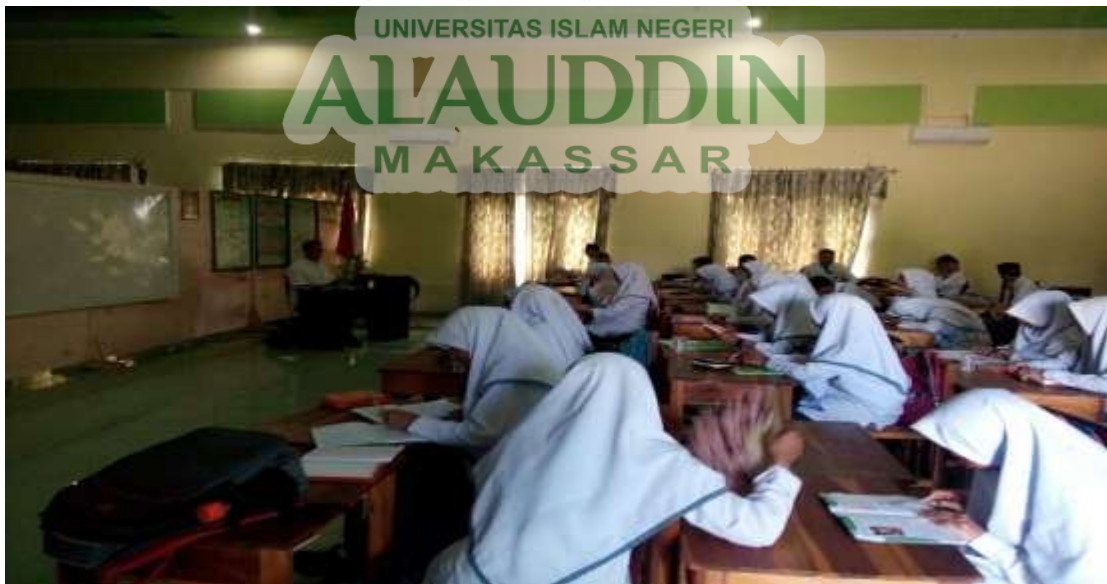
Suasan belajar mengajar