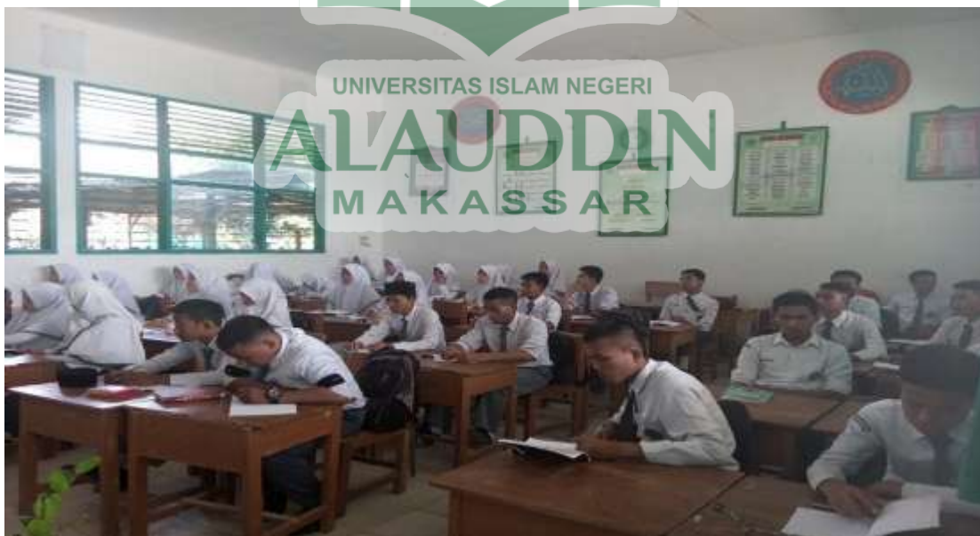
Suasana pengambilan biodata peserta didik