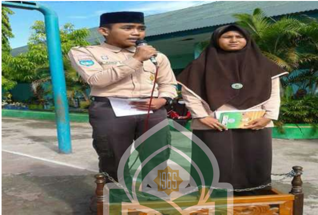
Penyampaian visi misi calon ketua OSIS