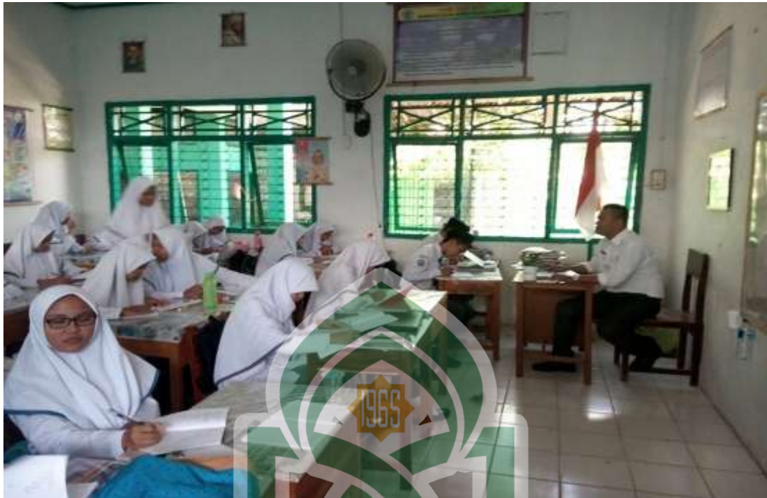
Proses belajar mengajar