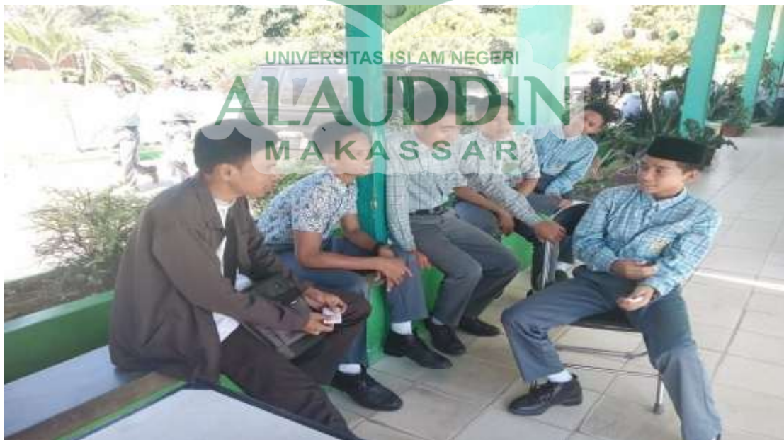
Wawancara dengan peserta didik