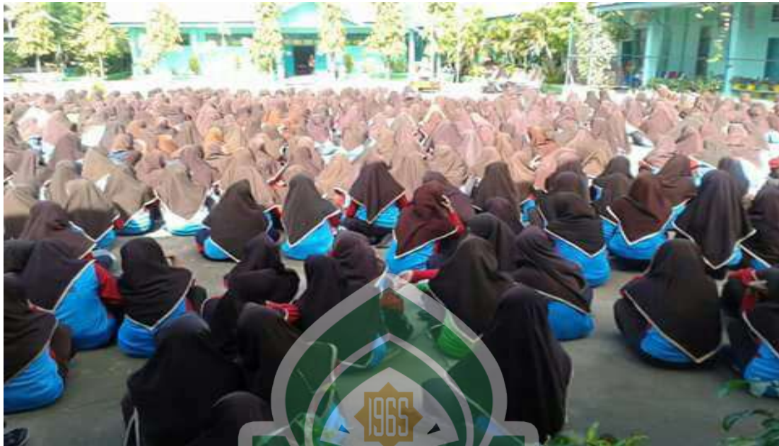
Peserta didik mendengar penyampaian visi misi calon ketua OSIS