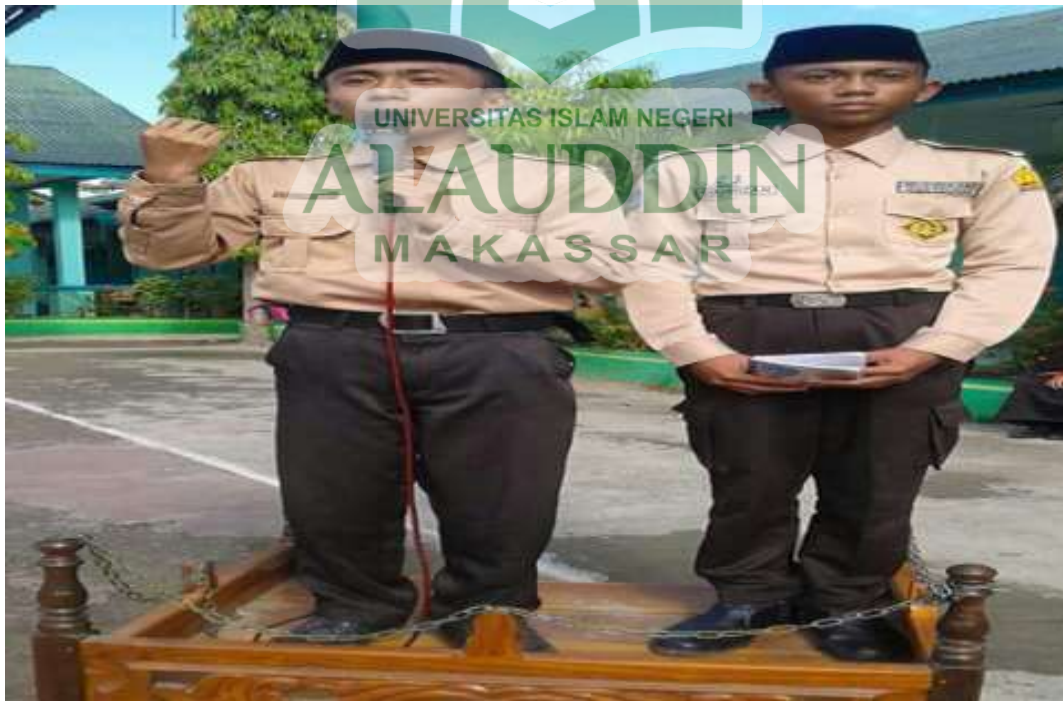
Penyampaian visi misi calon ketua OSIS