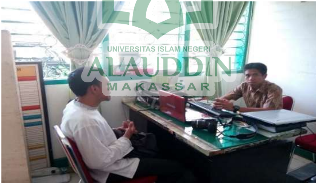
Pengambilan Dokumen MAN Polewali Mandar