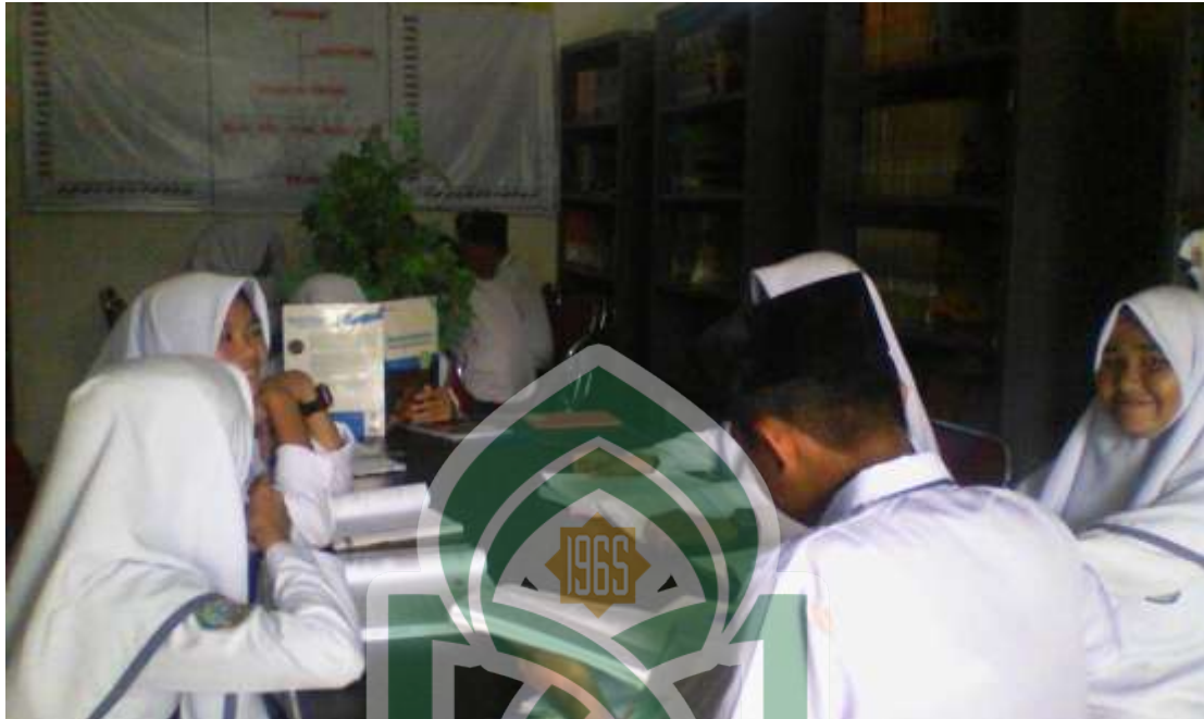
Wawancara dengan peserta didik