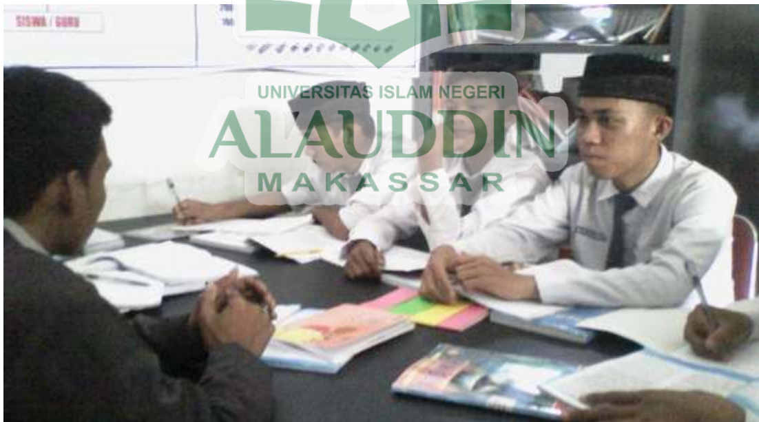
Wawancara dengan peserta didik