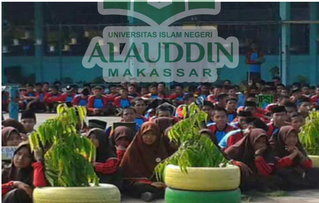
Peserta didik mendengarkan penyampaian visi misi calon ketua OSIS