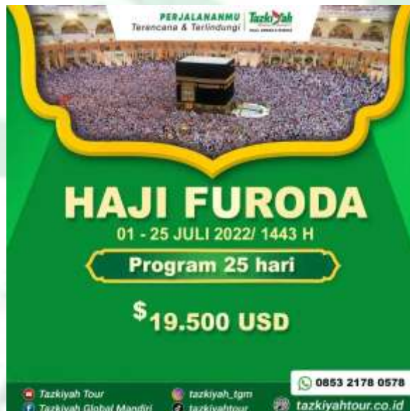
Gambar 3. Brosur Haji Furoda PT. Tazkiyah Makassar

“Bagi calon jamaah haji yang berminat ingin melaksanakan haji furoda dek, mereka harus mempersiapkan biaya yang lebih. Sebab biaya haji furoda lebih tinggi dibanding haji pada umumnya dek”. 11