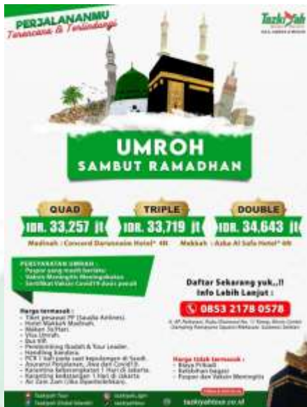
Gambar 4. Brosur Umrah Reguler PT. Tazkiyah Makassar

Berdasarkan hasil wawancara, bahwa umrah Ramadan di PT. Tazkiyah merupakan paket yang banyak diinginkan oleh para calon jamaah, sebab ketika melaksanakan umrah di bulan suci Ramadan memiliki keistimewaan dibandingkan melaksanakan umrah pada bulan-bulan lainnya.