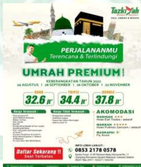
Gambar 5. Brosur Umrah Reguler PT. Tazkiyah Makassar

“Calon jamaah akan menuju Bandara Sultan Hasanuddin menuju Bandara Soekarno Hatta lalu mengunjungi kota Mekkah dan Madinah. Waktu umrah reguler memakan waktu 9-12 hari, tergantung dari agen perjalanan calon jamaah umrah yang dipilih.” 15