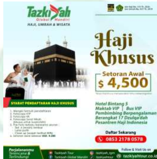
Gambar 2. Brosur Haji Khusus PT. Tazkiyah Makassar

“Di sini dek, calon jamaah akan diberikan edukasi keagamaan, edukasi kesehatan dan edukasi sukses dunia dan akhirat yang dilaksanakan secara online dan offline . Calon jamaah harus melalui beberapa tahapan seperti tahap manasik persiapan menuju tanah suci, tahap di tanah suci menggapai haji yang mabrur dan yang terakhir tahap setelah kepulangan dalam mempertahankan nilai nilai kemabruran haji” 9