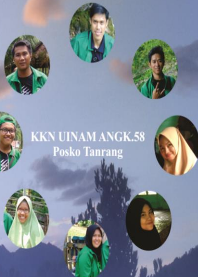
KKN UINAM ANGK.58 Posko Tanrang

Melalui KKN mahasiswa mengenal persoalan masyarakat yang bersifat "cross sectoral" serta belajar memecahkan masalah dengan pendekatan ilmu (interdisipliner). Mahasiswa perlu menelaah dan merumuskan masalah yang dihadapi masyarakat serta memberikan alternatif pemecahannya (penelitian), kemudian membantu memecahkan dan menanggulangi masalah tersebut.