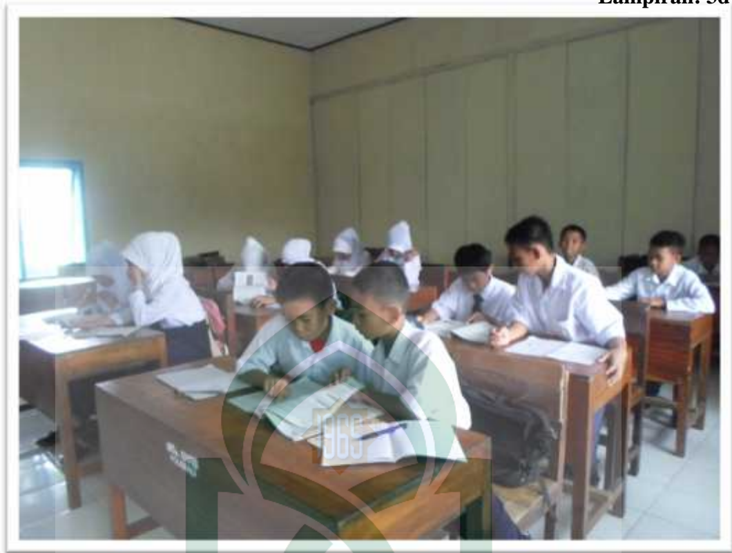
Gambar 7 : Siswa kelas VII MTs Yapis Polewali Kabupaten Polewali Mandar