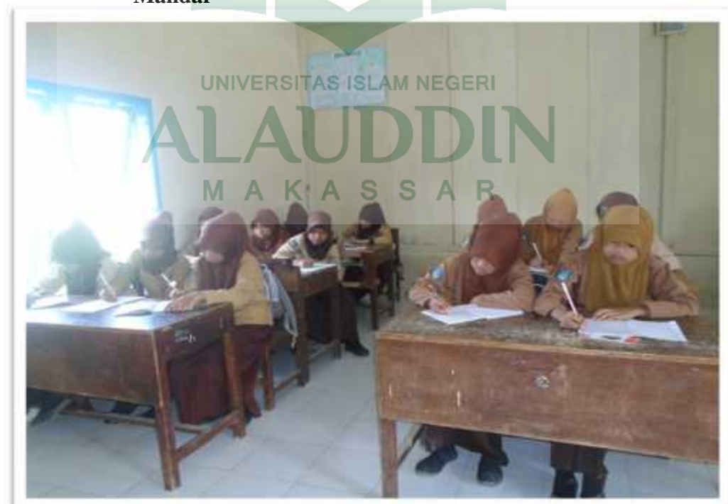
Gambar 8 : Siswa kelas VIII MTs Yapis Polewali Kabupaten Polewali Mandar