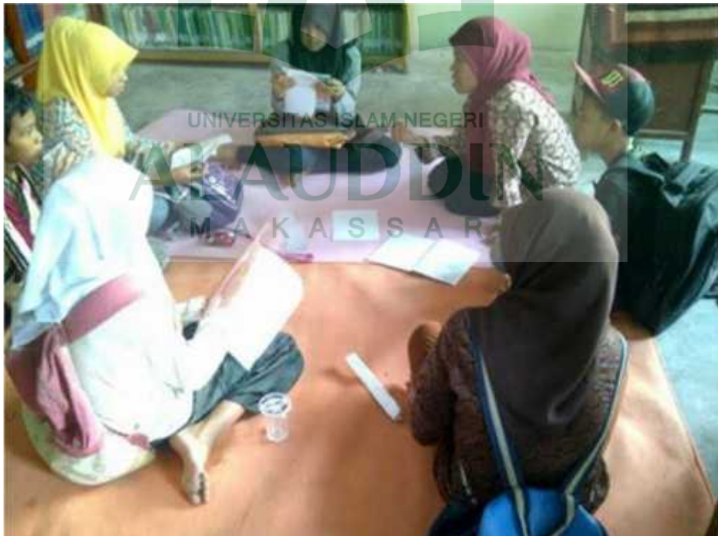
Gambar 10 : Kegiatan siswa membuat Mading Sekolah