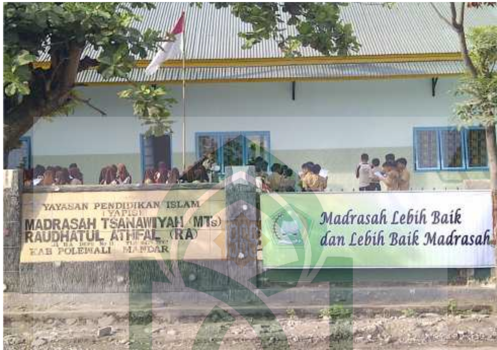
Gambar 1 : Lokasi MTs Yapis Polewali Kabupaten Polewali Mandar