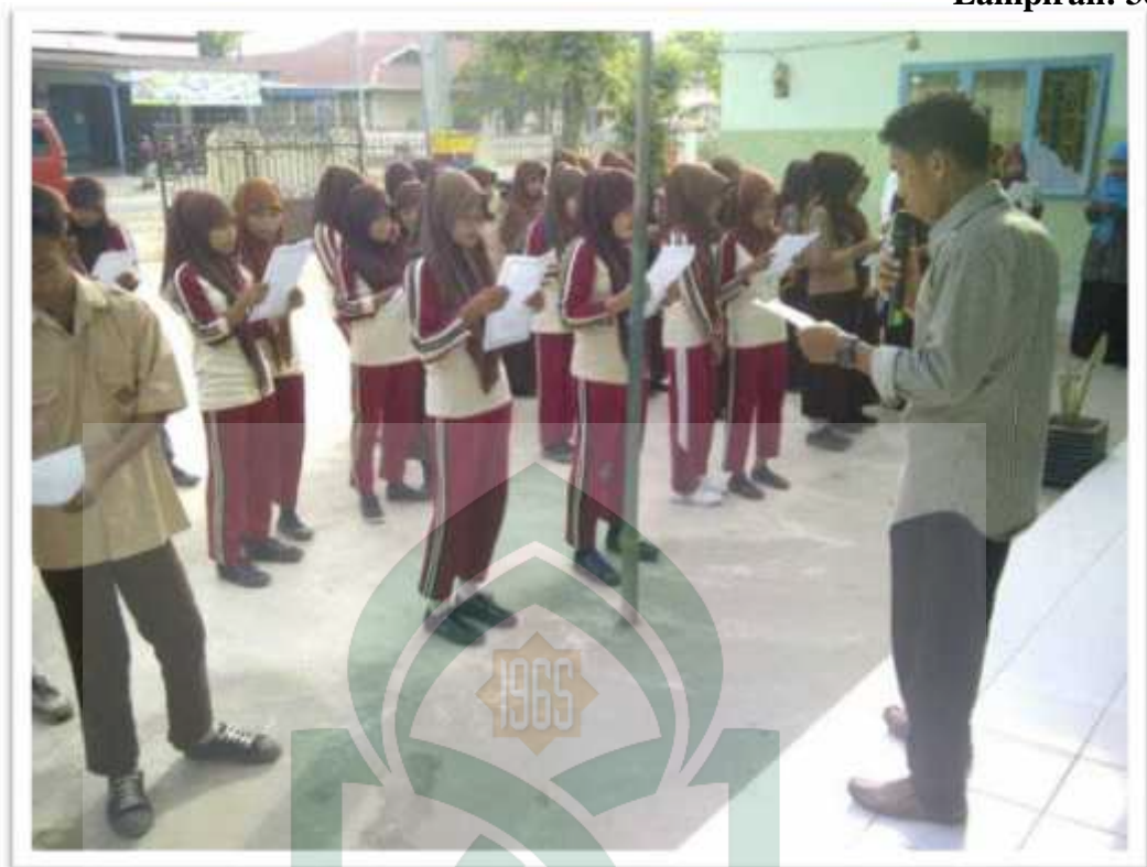
Gambar 9 : Kegiatan siswa di halaman sekolah sebelum pelajaran