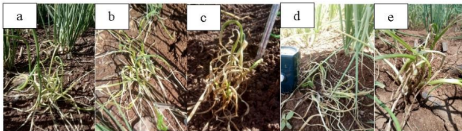
Gambar 1. Gejala sakit pada tanaman bawang merah di Kecamatan Buntu Batu Enrekang. Keterangan: a. Stasiun satu (S1), b. Stasiun dua (S2), c. Stasiun tiga (S3), d. Stasiun empat (S4), dan e. Stasiun lima (S5)

penyakit layu (Moler) dengan perkembangan yang berbeda. Dimana pada stasiun satu (S1) dan stasiun dua (S2) menunjukkan ciri yang sama yaitu tanaman layu, daun meliuk berwarna hijau kekuningan dan mengalami kekeringan yang tampak dari ujung daun, umbi kecil dan akar berwarna kecoklatan. Perbedaannya terletak pada daun, yakni pada stasiun dua (S2) yang mengering lebih sedikit dan kebanyakan daun berwarna hijau kekuningan. Stasiun tiga (S3) tanaman kerdil dan mengalami kelayuan, daun berwarna hijau kekuningan dan kebanyakan daun kering, umbi kecil berwarna putih pucat hingga pada pangkal tampak pembusukan, serta akar yang mulai kecoklatan. Stasiun empat (S4) menunjukkan ciri tanaman layu, daun meliuk kekuningan dan mengering dari ujung daun. Stasiun lima (S5) menunjukkan tanaman kerdil, daun sedikit dan berwarna hijau kekuningan, beberapa daun mengalami kekeringan yang dimulai dari ujung ke pangkal daun. Gejala penyakit pada tanaman bawang merah yang tampak dipengaruhi oleh virulensi cendawan patogen dan faktor lingkungan yang mendukung perkembangan penyakit.