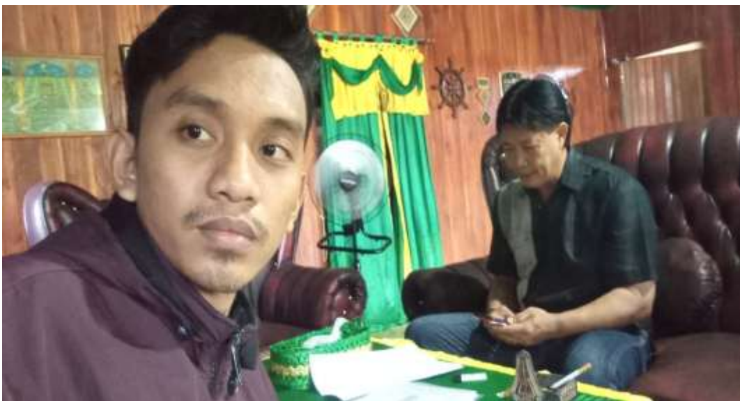
Gambar: Wawancara dengan Ketua LSM Asura