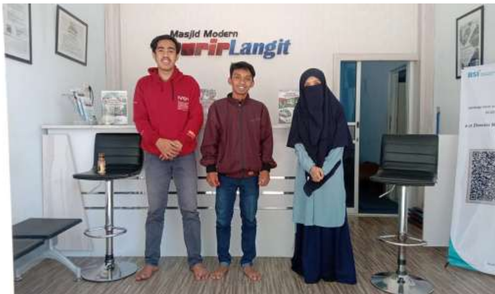
Gambar: Wawancara Dengan Salah Satu Tokoh Perempuan