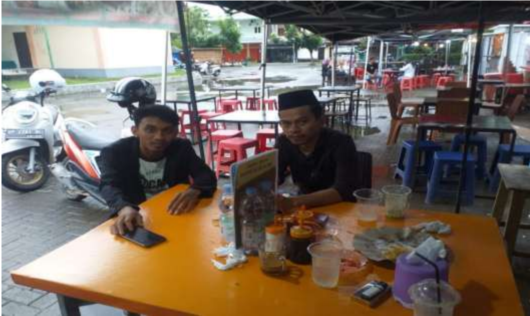
Gambar: Wawancara Dengan Ketua DPP Gappembar Kabupaten Barru