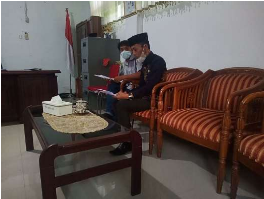
Gambar: Wawancara Dengan Ketua DPRD Kabupaten Barru