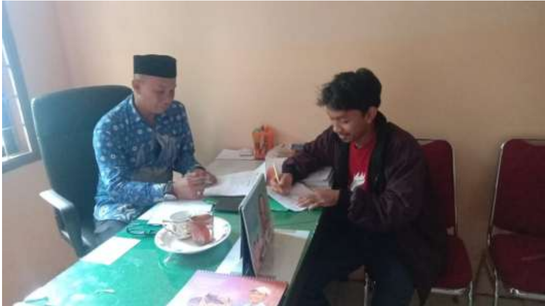
Gambar: Wawancara Dengan Camat Kecamatan Tanete Riaja