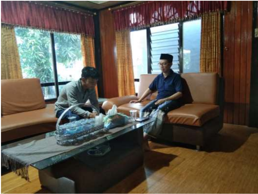
Gambar: Wawancara Dengan Tokoh Agama Sekaligus Ketua STIA Barru