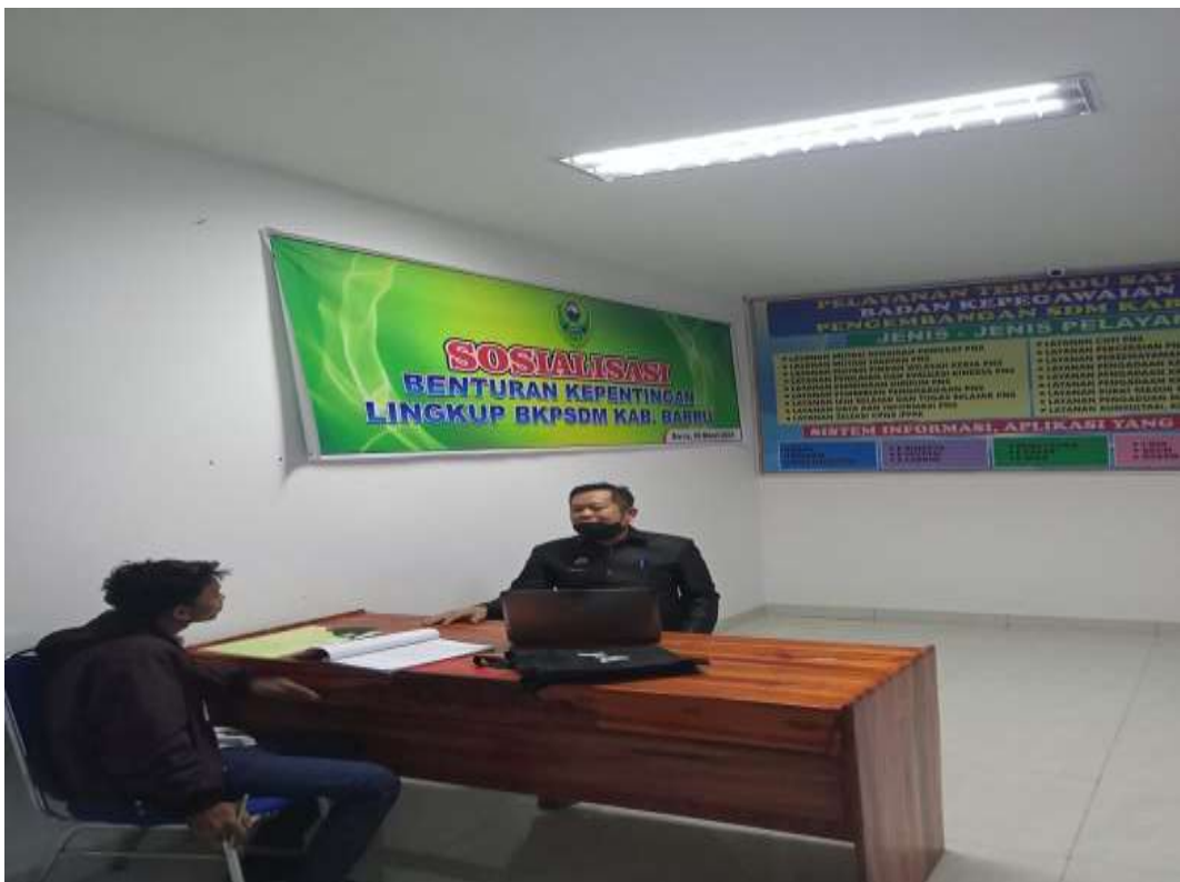
Gambar: Wawancara Dengan BKPSDM