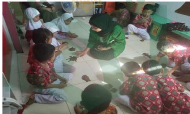
Memonitor karya yang dibuat anak