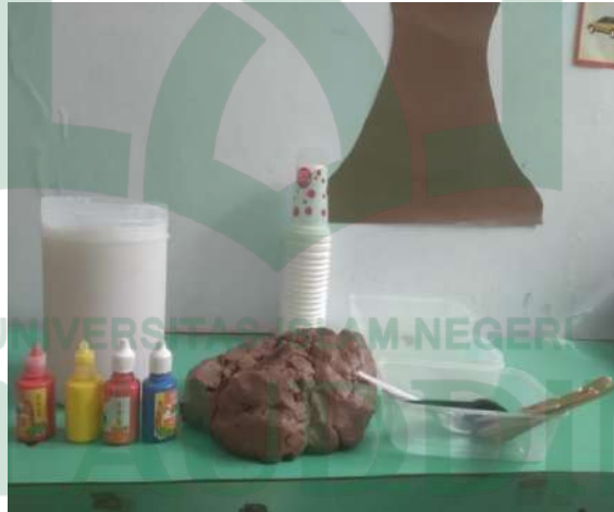
Media dan bahan kegiatan proyek