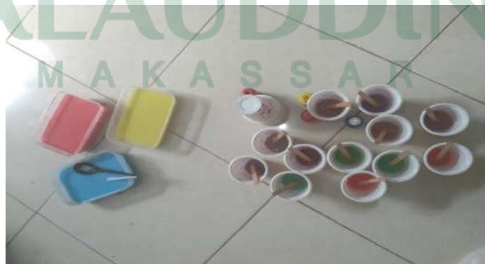
Hasil pencampuran warna