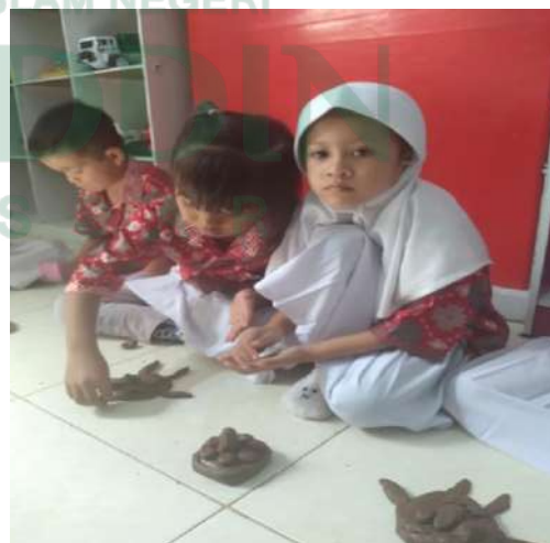
Bentuk kue ulang tahun