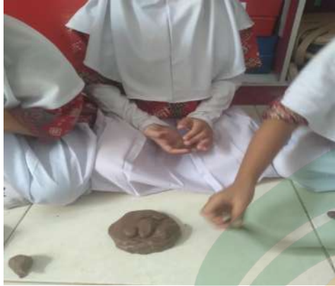
Bentuk kepala manusia