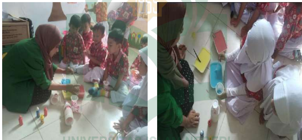
Kegiatan mencampur warna