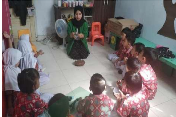
Penjelasan mengenai sifat tanah liat dan cara membuat karya dari tanah liat