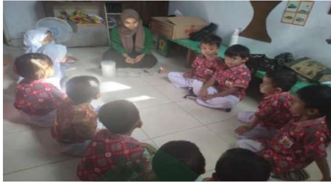
Menjelaskan kepada anak mengenai percobaan sederhana mencampur warna