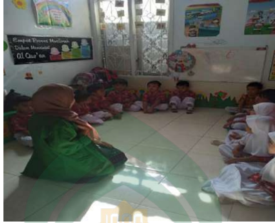
Diskusi bersama anak di dalam kelas