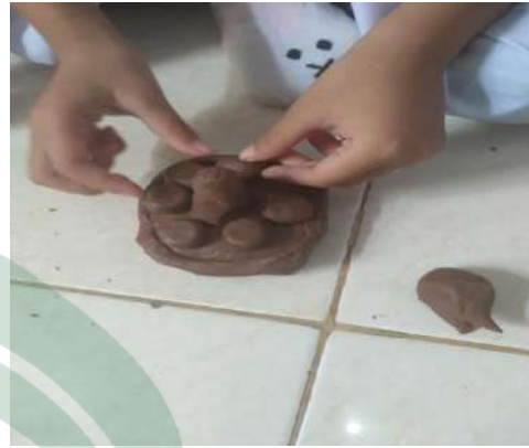
Bentuk kue ulang tahun