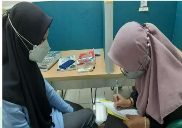
Gambar 1.1. Wawancara dengan pemustaka