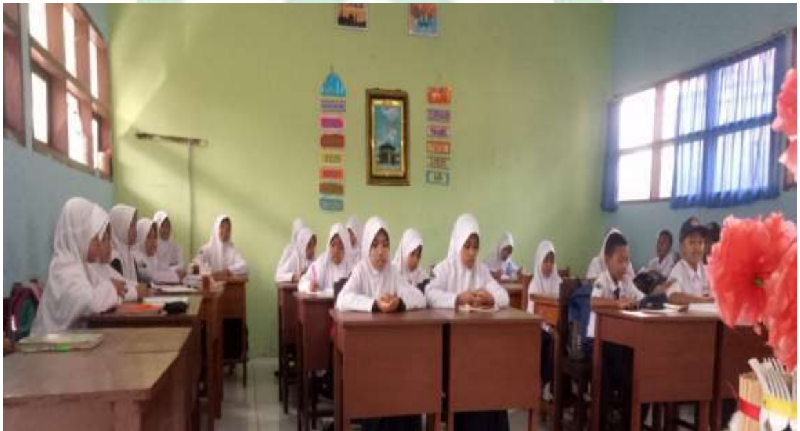
Dokumentasi peserta didik SMP Negeri 1 Bajeng Gowa