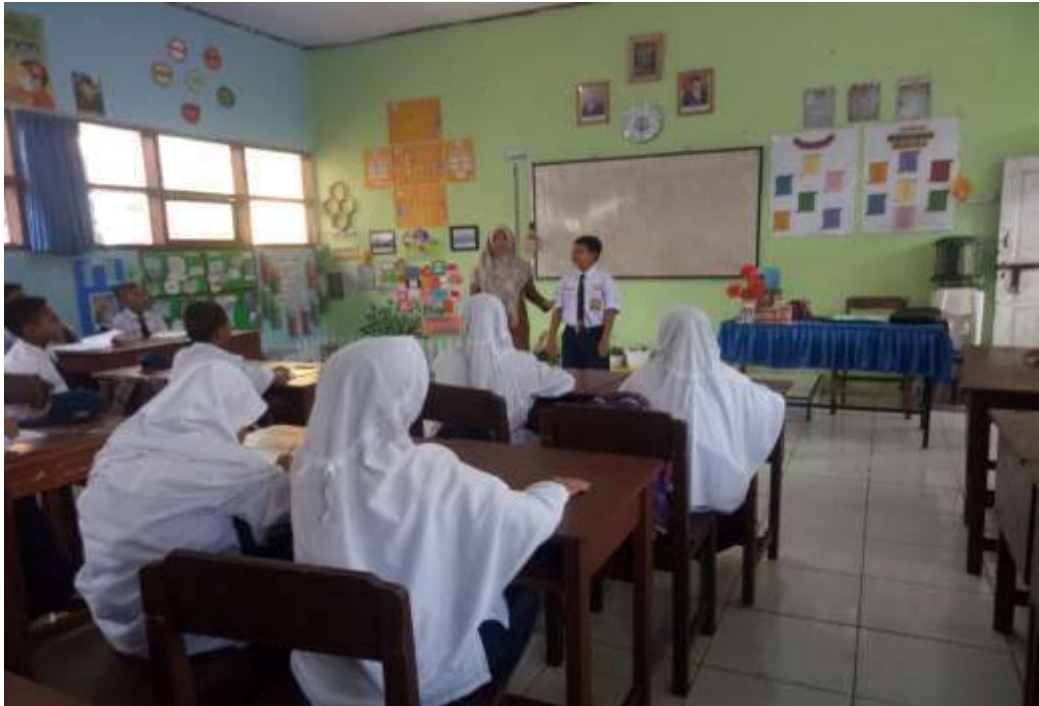
Dokumentasi proses pembelajaran Peserta didik SMP Negeri 1 Bajeng Gowa