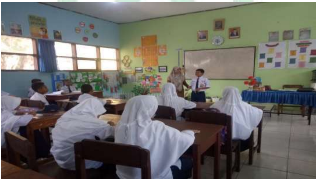
Dokumentasi proses pembelajaran Peserta didik SMP Negeri 1 Bajeng Gowa