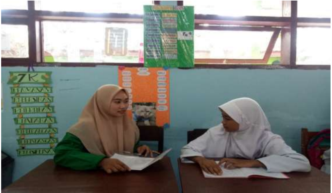
Proses wawancara dengan Peserta didik SMP Negeri 1 Bajeng Gowa