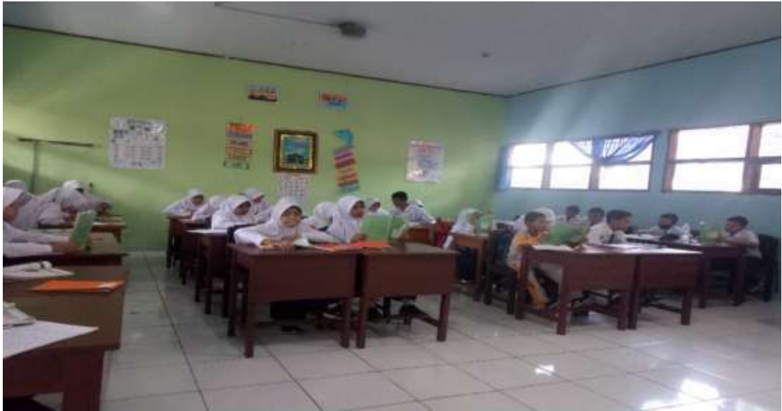
Dokumentasi proses pembelajaran peserta didik SMP Negeri 1 Bajeng Gowa