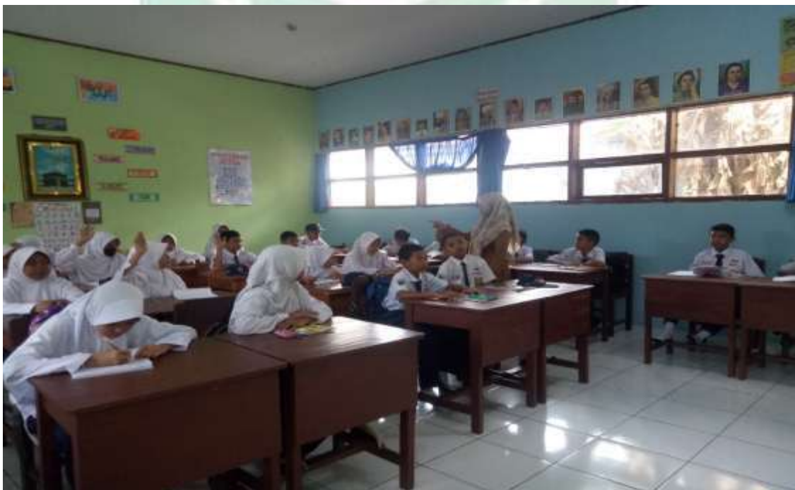
Dokumentasi proses pembelajaran Peserta didik SMP Negeri 1 Bajeng Gowa