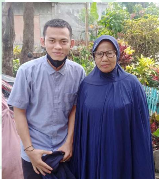
Dokumentasi bersama Caya (Masyarakat Tonrolima)