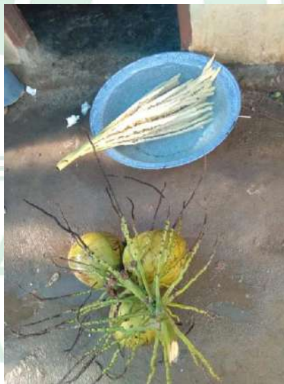
Bahan yang digunakan dalam tradisi Mendrio Poccing (Mandi kembang)