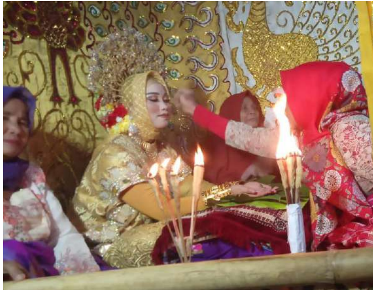
Proses Maccurede (pemberian daun pacar)