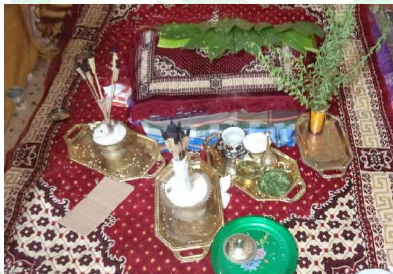
Bahan-bahan yang digunakan dalam proses Maccurede (pemberian daun pacar)