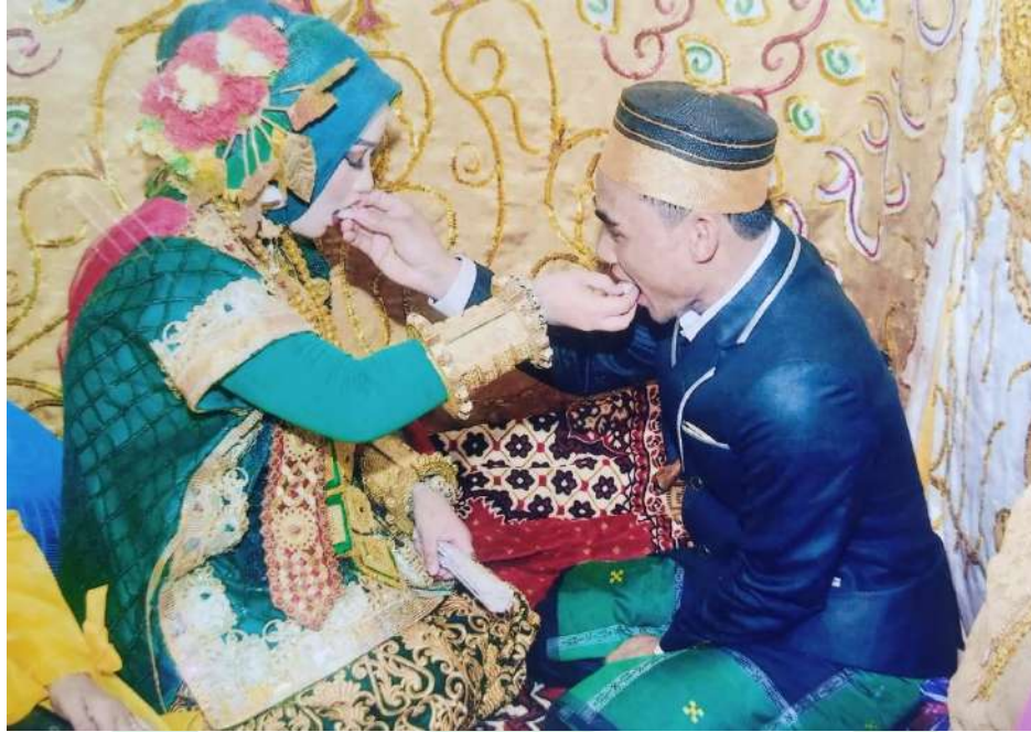
Proses saling suap antara kedua mempelai ( Ande Kaweng )