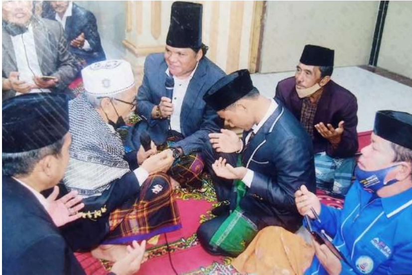
Proses ijab qabul oleh mempelai laki-laki