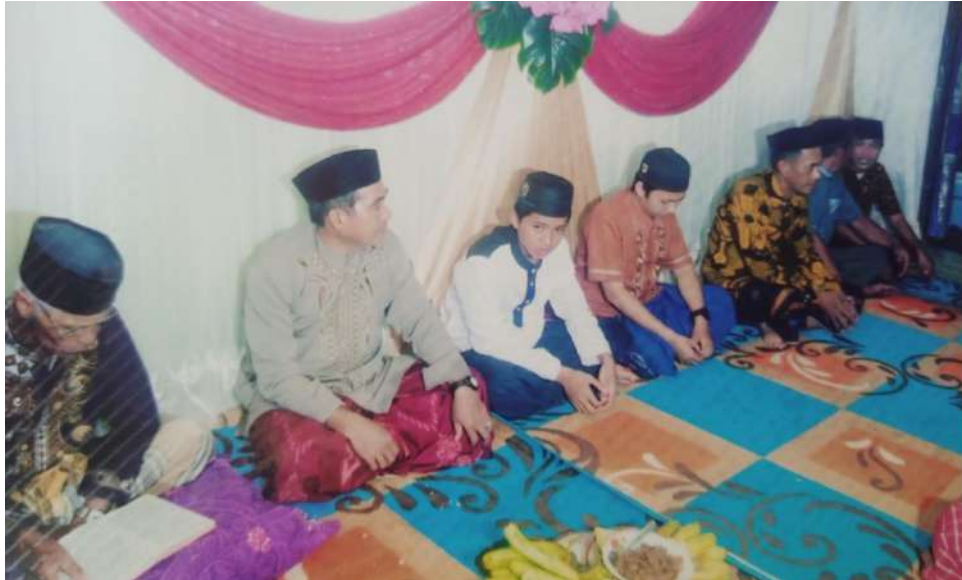
proses Mabaca-baca pada malam Maccurede