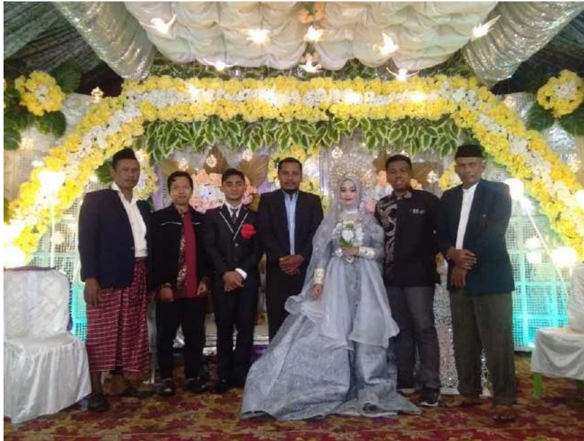
Proses resepsi pernikahan yang dihadiri oleh para tamu