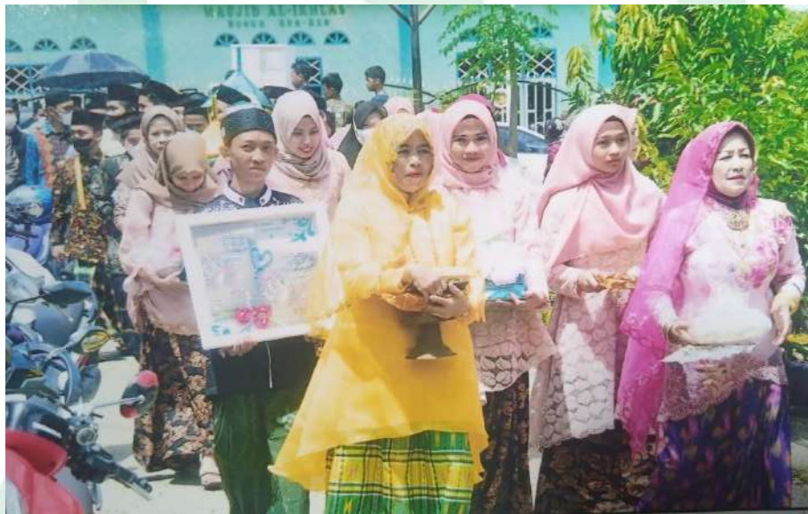
Kedatangan rombongan mmpelai laki-laki dengan membawa berbagai macam seserahan ( Metindoro' )