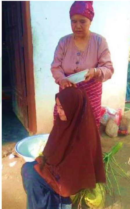
Proses Mendrio Poccing (Mandi kembang)