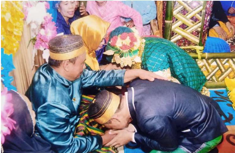
Proses salaman kepada kedua orang tua mempelai