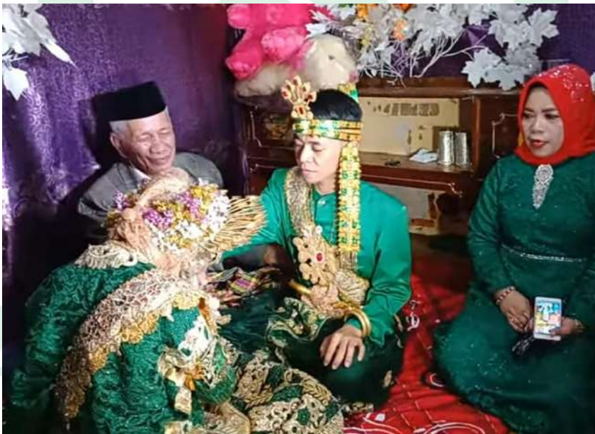
Proses menyentuh pasangan untuk pertama kali ( Sipakarawa )