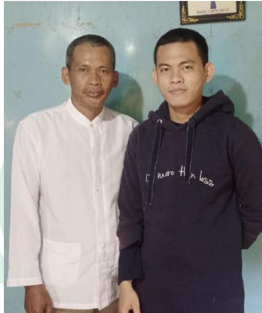
Dokumentasi bersama Basarang (Masyarakat Tonrolima)