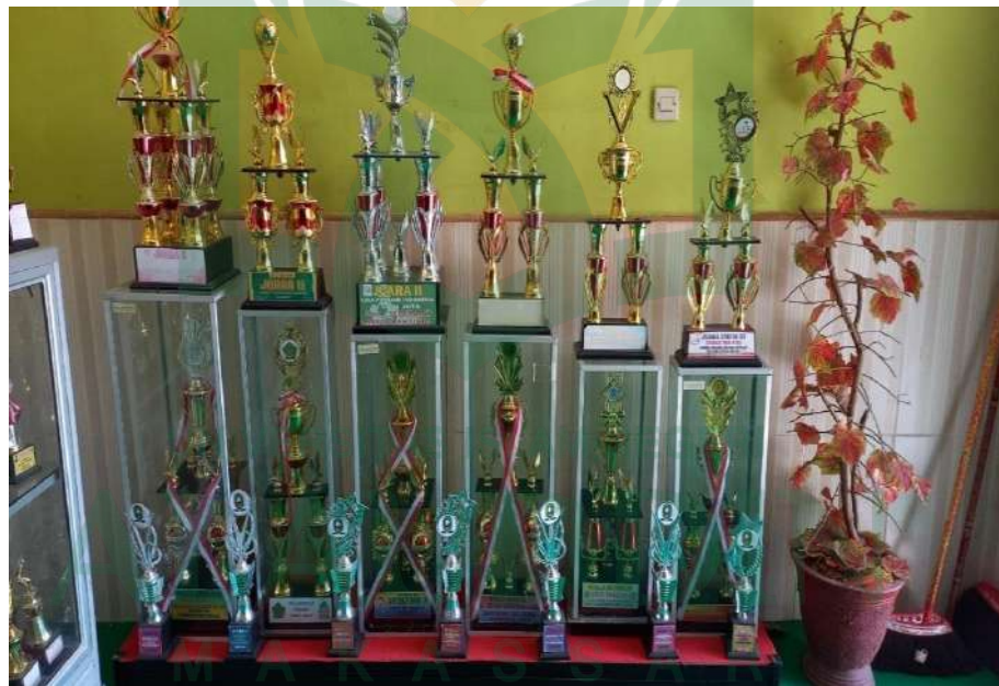
Prestasi yang di Raih oleh Peserta Didik MAN 1 Sinjai