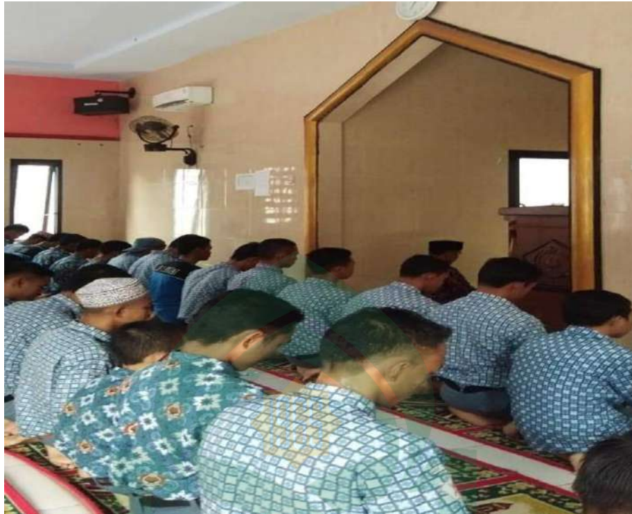
Salat Duha Berjamaah yang Diadakan di Masjid Madrasah