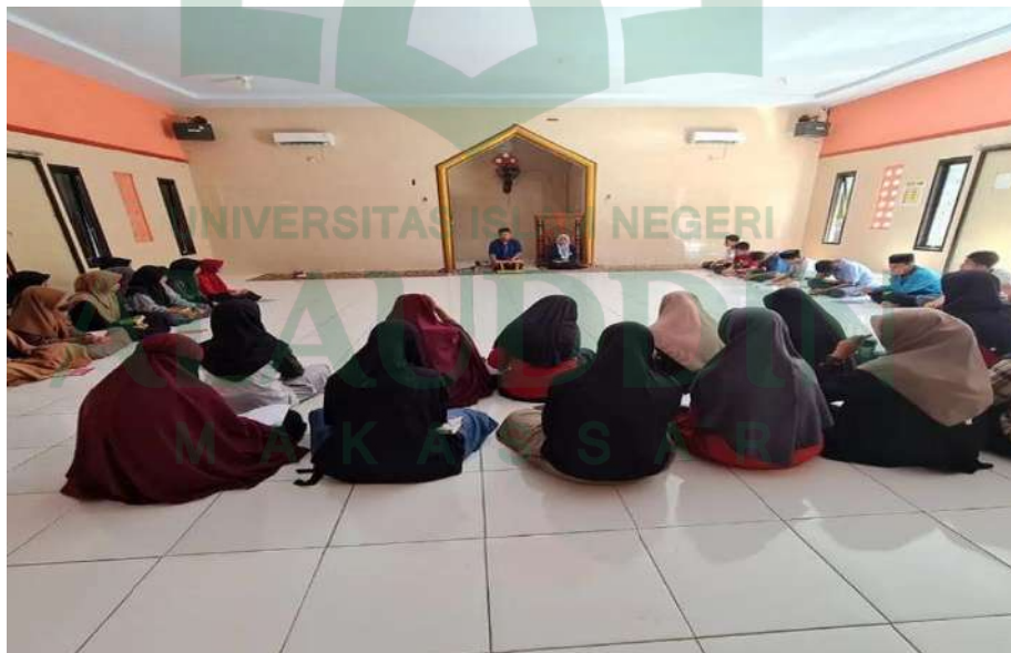
Tudang Sipulung yang Diadakan Ektrakurikuler Tahfidz Al-Qudwah Madani