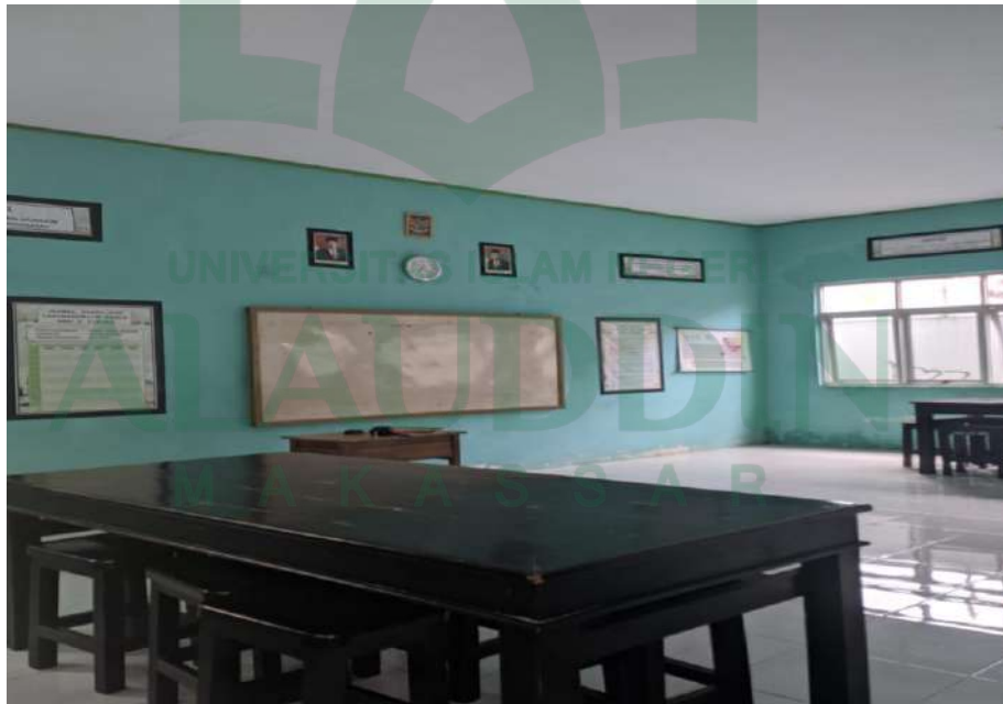
Ruangan Laboratorium Kimia