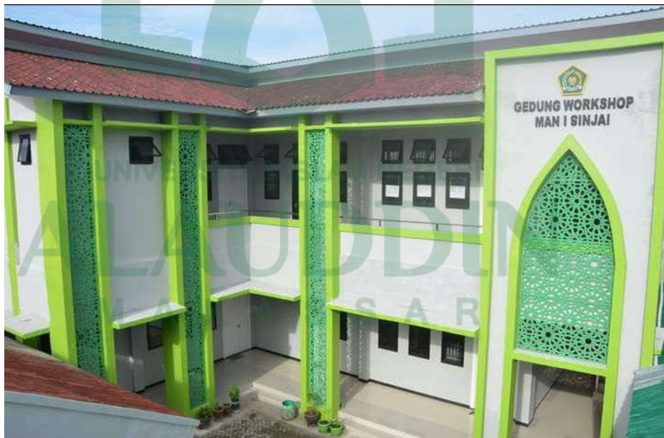
Gedung Workshop MAN 1 Sinjai Tempat Ruangan Laboratorium Komputer, Tata Boga dan Keterampilan Busana