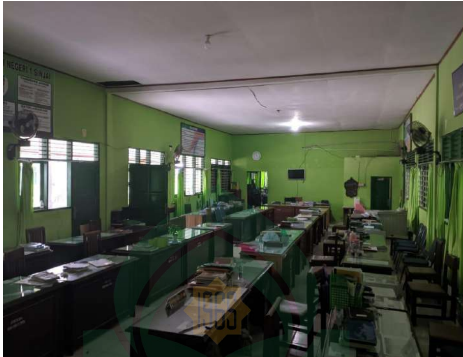
Ruang Guru MAN 1 Sinjai