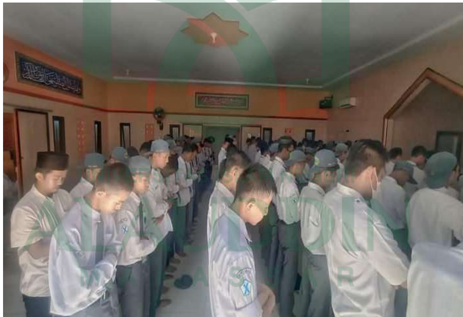
Salat Duhur Berjamaah yang Dilaksanakan di Masjid Madrasah