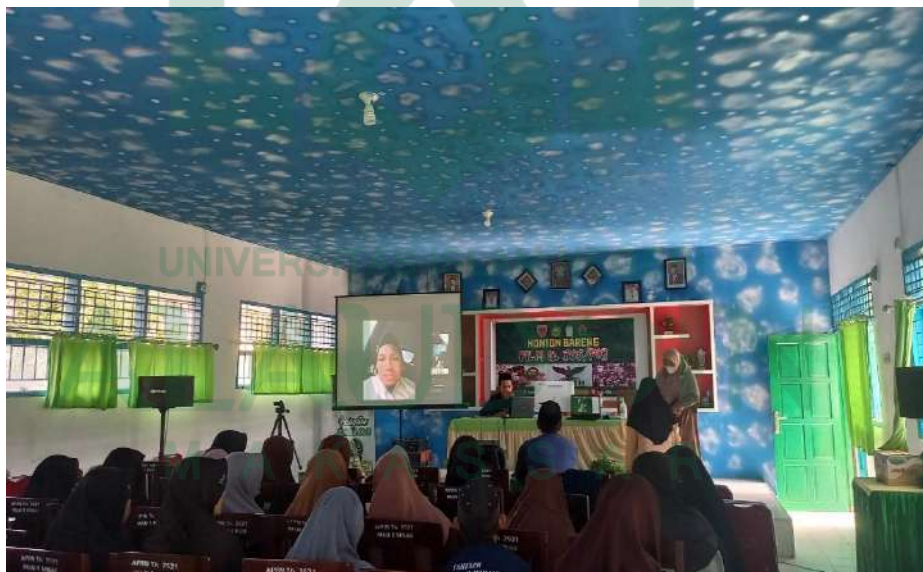
Kajian Keislaman Melalui Via Zoom Berhubung Pemateri Berasal Dari Luar Daerah