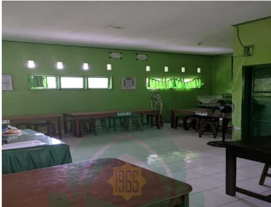
Ruangan Laboratorium Fisika