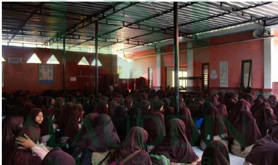
Dzikir dan Do'a Bersama Setiap Sabtu Pagi