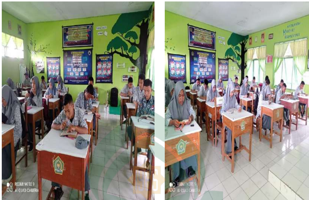
Salah Satu Kegiatan Keagamaan Berupa Membaca Al-Qur'an Sebelum Belajar