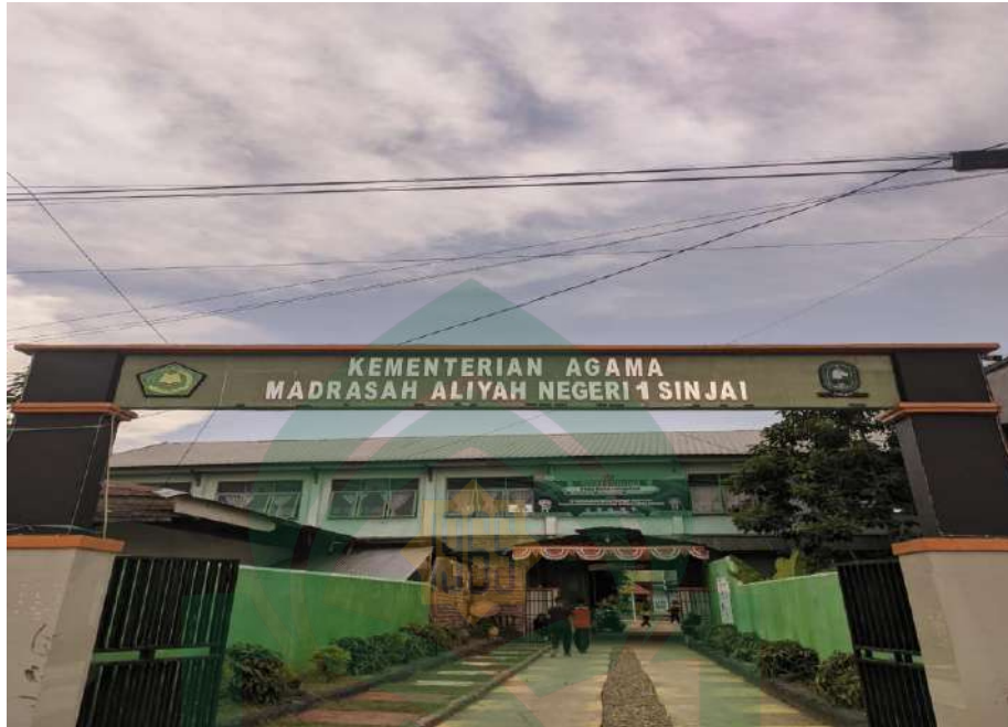
Gerbang MAN 1 Sinjai, dokumentasi pada tanggal 6 Oktober 2022