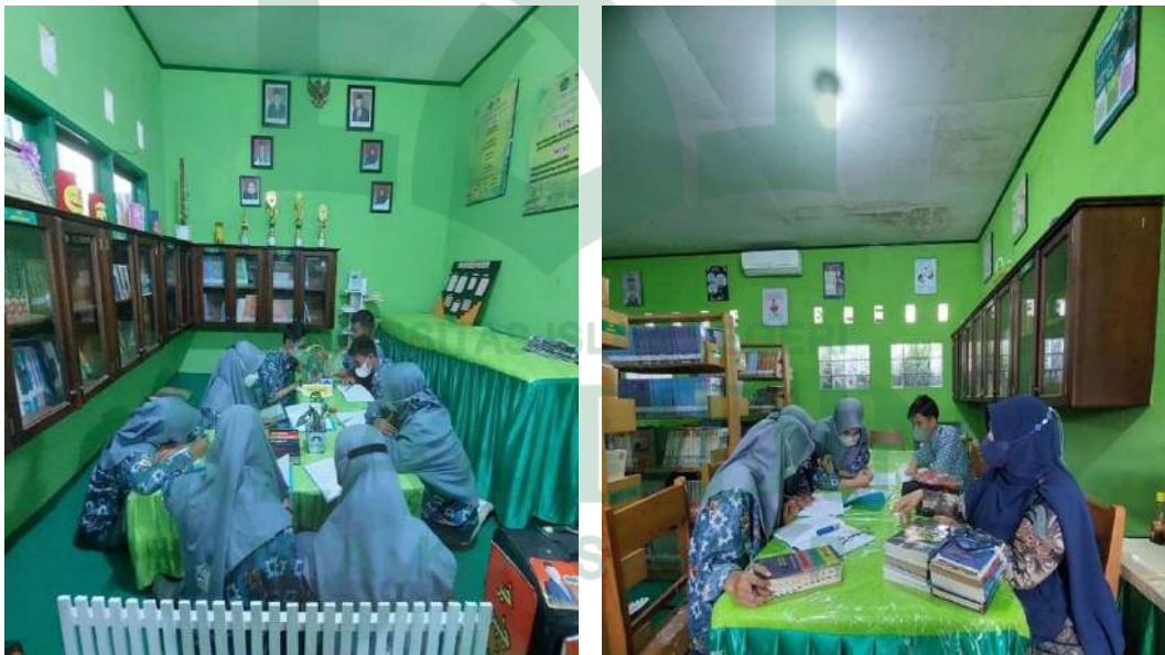
Perpustakaan Al-Jahiz MAN 1 Sinjai