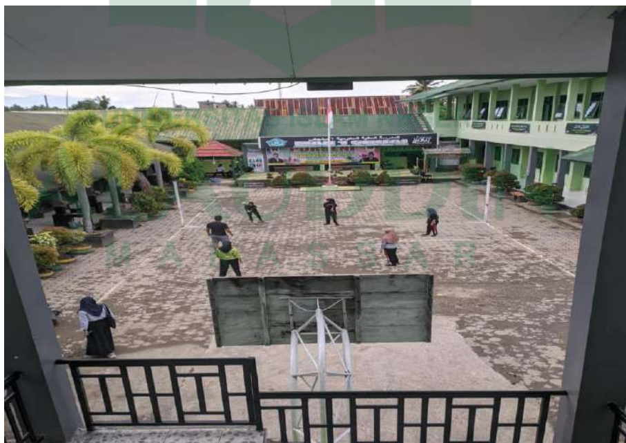
Lapangan Upacara MAN 1 Sinjai