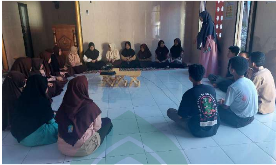
Majelis Talaqqi yang Diadakan Ekstrakurikuler Tahfidz Al-Qudwah Madani di Masjid Madrasah