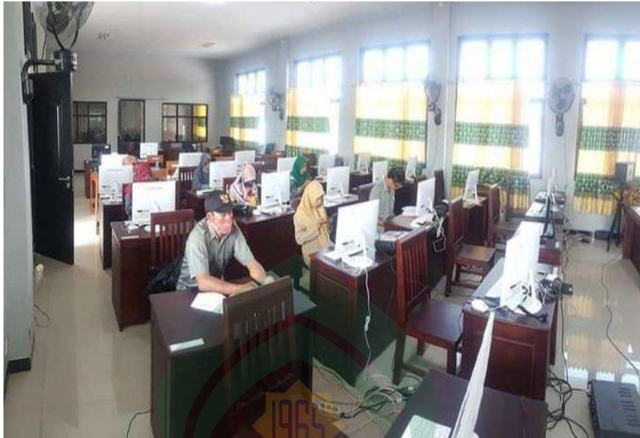
Ruangan Laboratorium Komputer