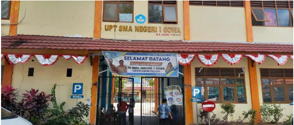
Parkiran SMA Negeri 1 Gowa