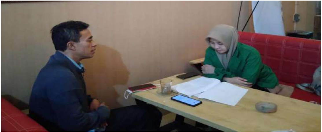
Wawancara dengan Peserta Didik Kelas XI