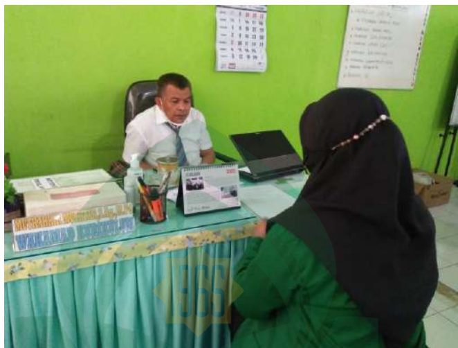
Foto wawancara bersama guru BK