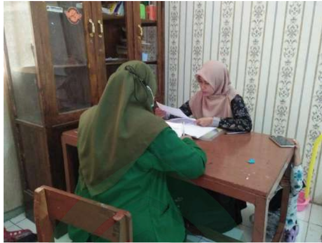
Foto suasana proses pembelajaran berlangsung kelas 7.Tahsin 1