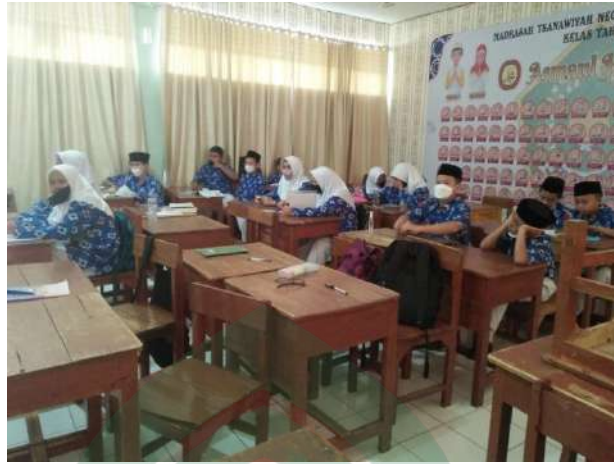
Foto suasana proses pembelajaran berlangsung kelas 7.BA1