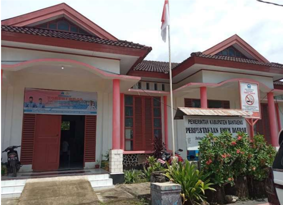
Dinas Perpustakaan Daerah Kabupaten Bantaeng

UNIVERSITAS ISLAM NEGERI ALAUDDIN MAKASSAR