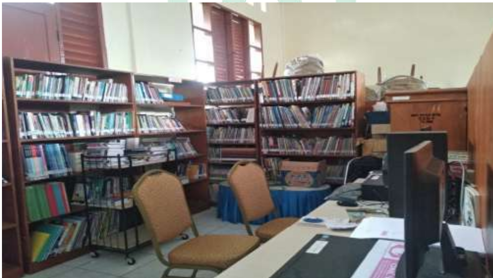
Ruangan Koleksi tandon di Dinas Perpustakaan Daerah Kabupaten Bantaeng