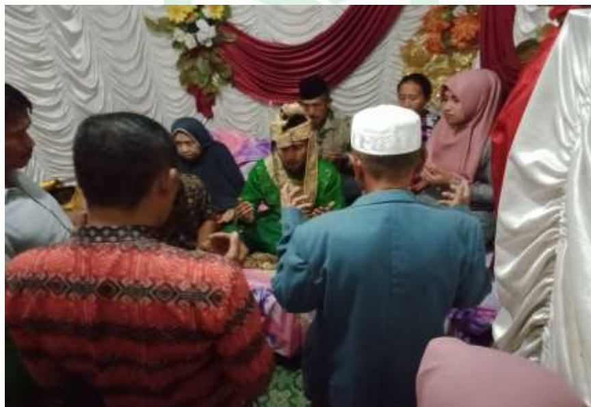
Gambar 12 : Mempersiapkan Pengantin ( Mappangnguju Botting )