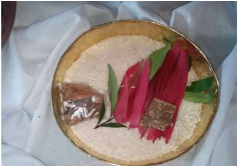
Gambar 1: Perlengkapan lise kempu