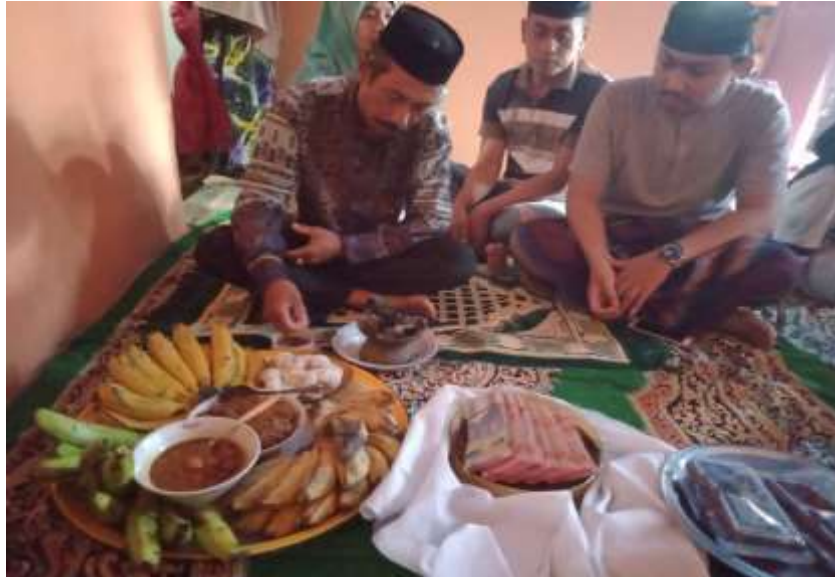
Gambar 3 : Prosesi pembacaan doa sebelum mappettu ada