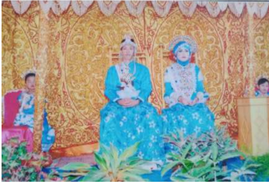
Gambar 23 : Duduk Pengantin ( Tudang Botting )