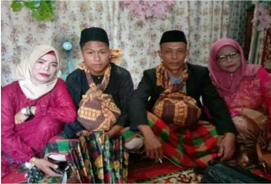
Gambar 17 : Pembawa Kempu