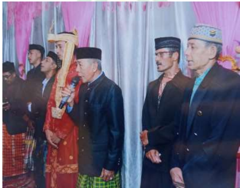
Gambar 6 : Barazanji