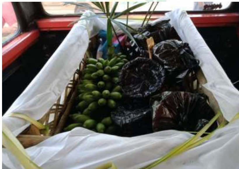
Gambar 16 : Kanre Anak