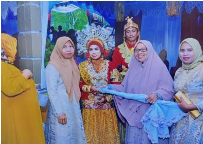
Gambar 18 : Menjemput Pengantin ( Madduppa Botting )