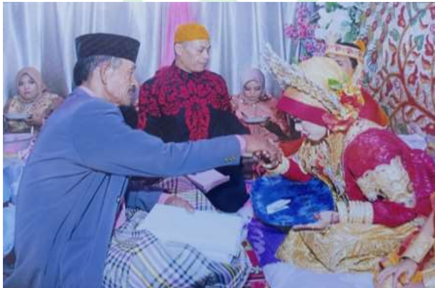
Gambar 24 : Mammatua