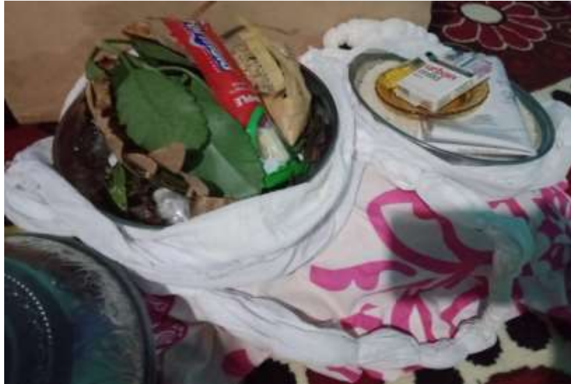
Gambar 15 : Lise Kempu saat akad nikah