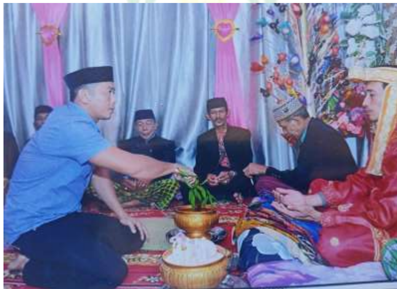
Gambar 10 : Prosesi Mappacing