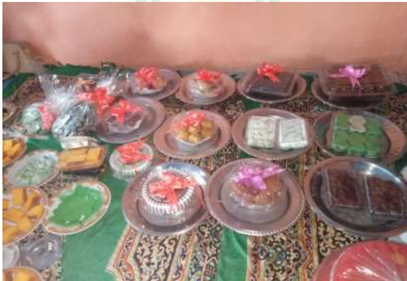
Gambar 4 : Bossara yang berisi beragam jenis kue yang akan dibawa pada prosesi mappettu ada