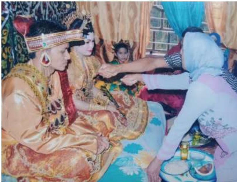
Gambar 22 : Makan Pengantin ( Manre Botting )