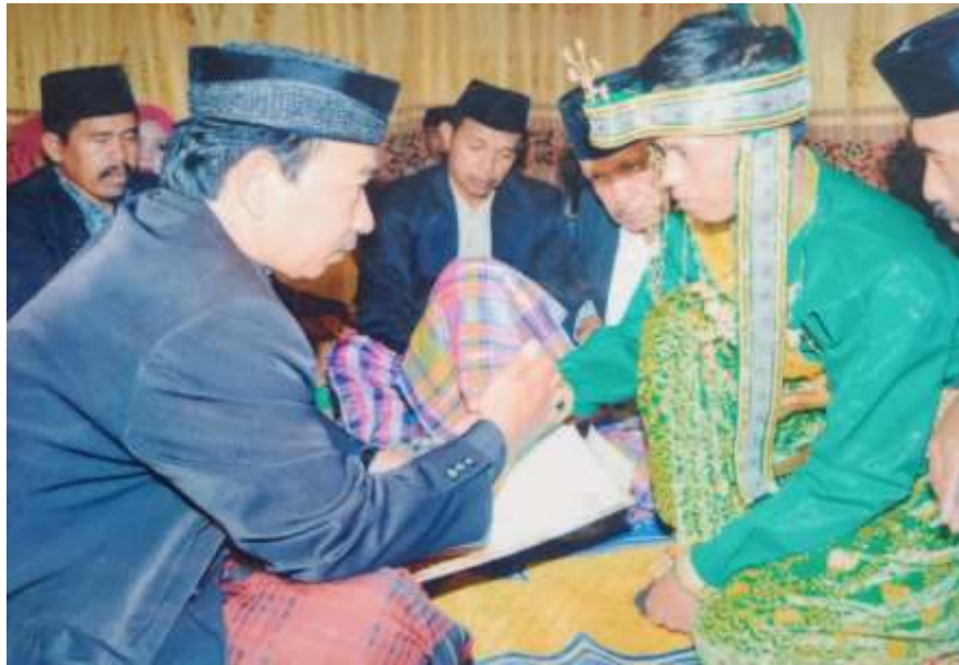
Gambar 19 : Prosesi Akad Nikah