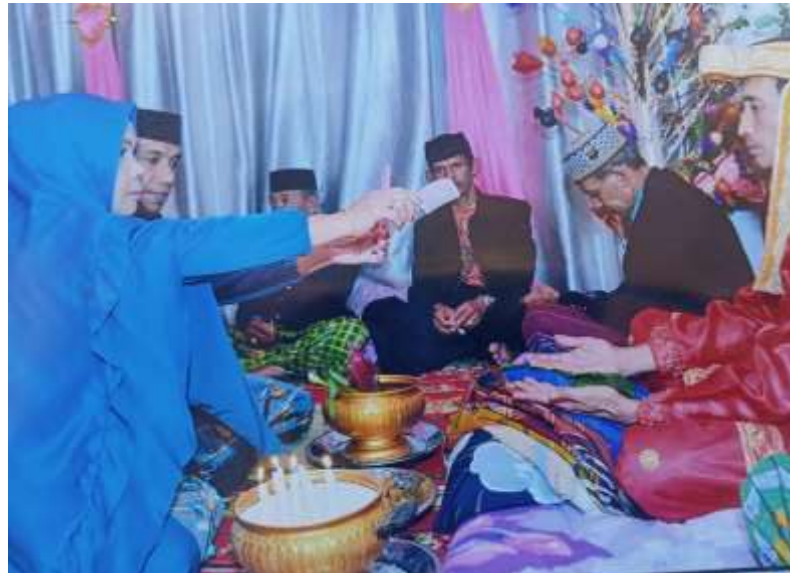
Gambar 9 : Prosesi Mappacing