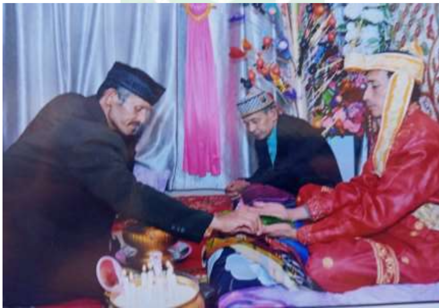
Gambar 8 : Prosesi Mappaccing