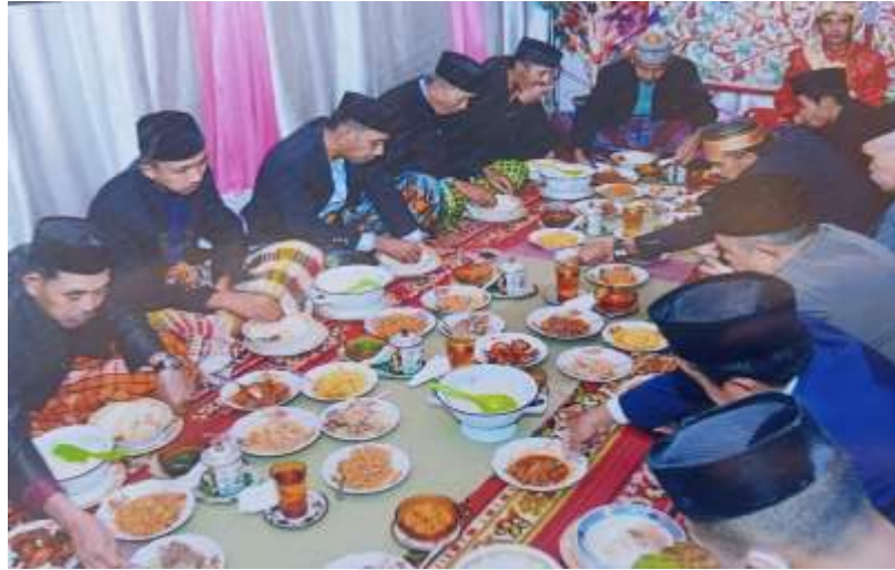
Gambar 5: Makan Adat ( Manre Ade )