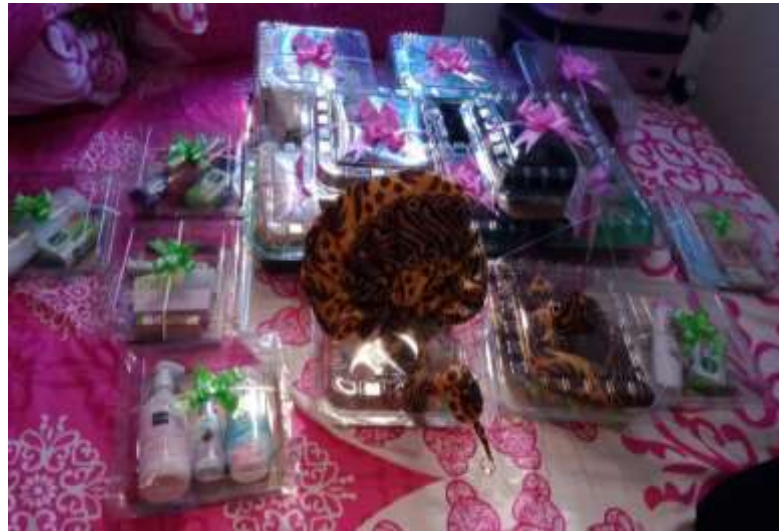
Gambar 13 : Erang-Erang