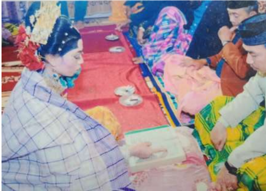
Gambar 7 : Khatam Al-Qur'an ( Mappanre Temme )