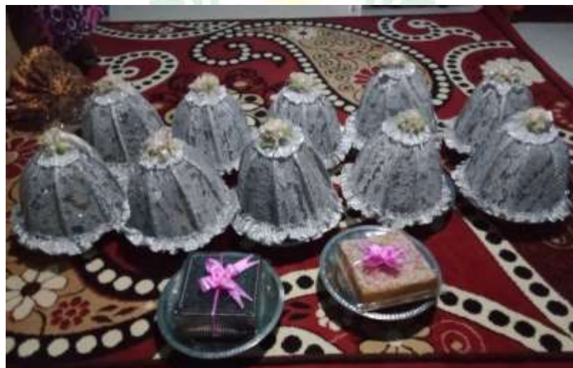
Gambar 14 : Bossara