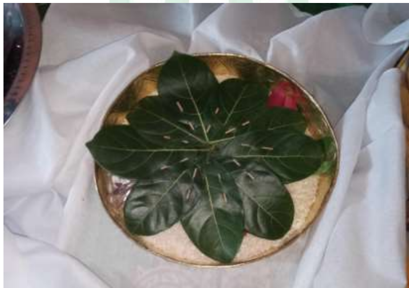
Gambar 2: Perlengkapan lise kempu