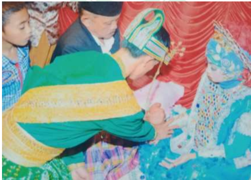
Gambar 20 : Prosesi Mappassikarawa