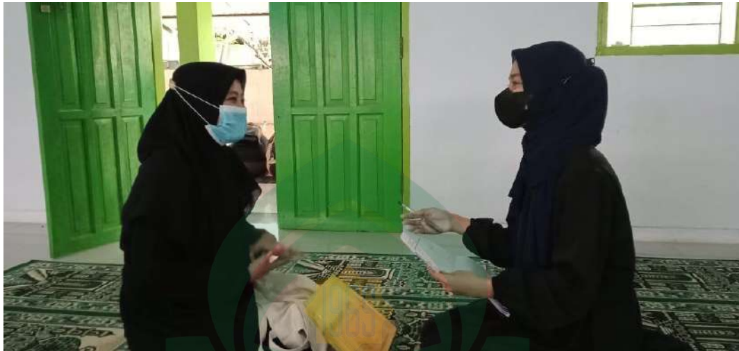
Peneliti melakukan wawancara terhadap guru pendidikan agama Islam dan budi pekerti kelas XI tekstil 1 di mushollah SMK Negeri 3 Gowa