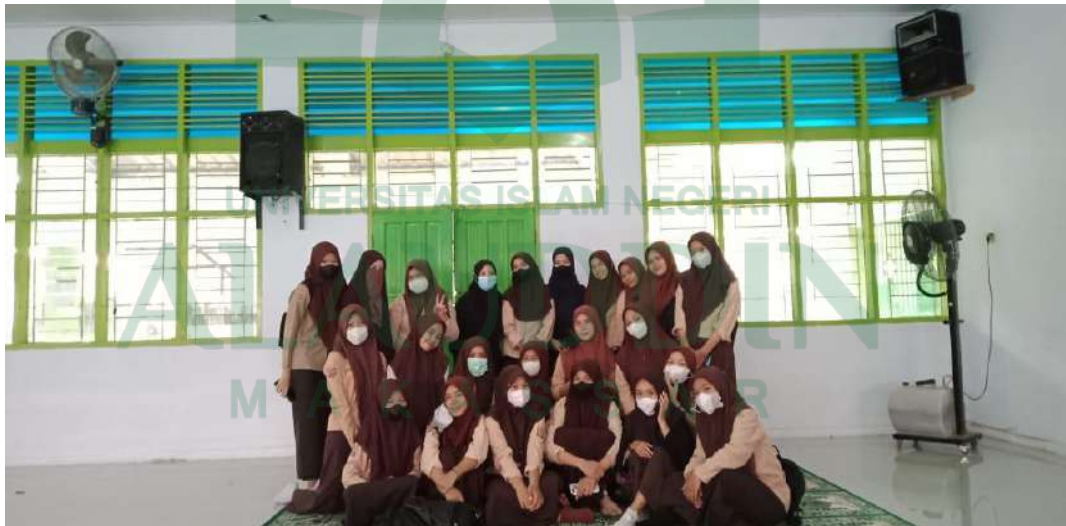
Foto bersama peserta didik kelas XI tekstil 1 dan guru pendidikan agama Islam dan budi pekerti di jurusan kriya tekstil SMK Negeri 3 Gowa