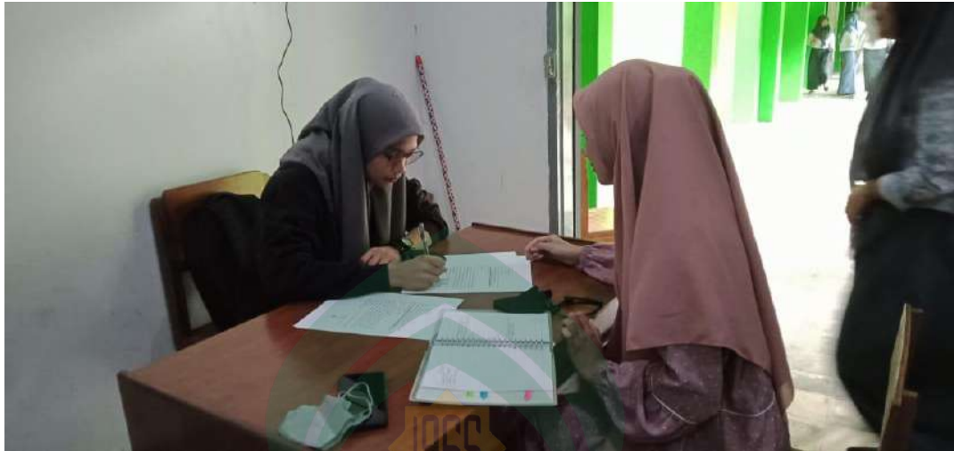
Peneliti melakukan wawancara terhadap salah satu peserta didik jurusan kriya tekstil kelas XI tekstil 1 di ruang kelas SMK Negeri 3 Gowa