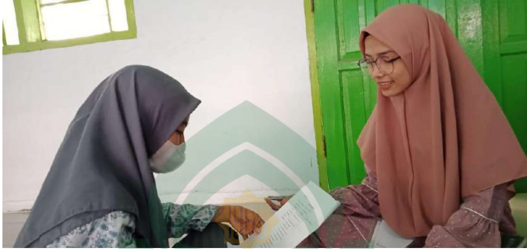
Peneliti melakukan wawancara terhadap salah satu peserta didik jurusan kriya tekstil kelas XI tekstil 1 di mushollah SMK Negeri 3 Gowa