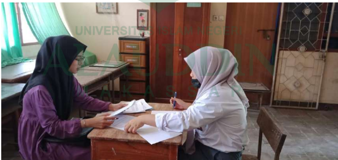
Peneliti melakukan wawancara terhadap salah satu peserta didik jurusan kriya tekstil kelas XI tekstil 1 di ruang sulam SMK Negeri 3 Gowa