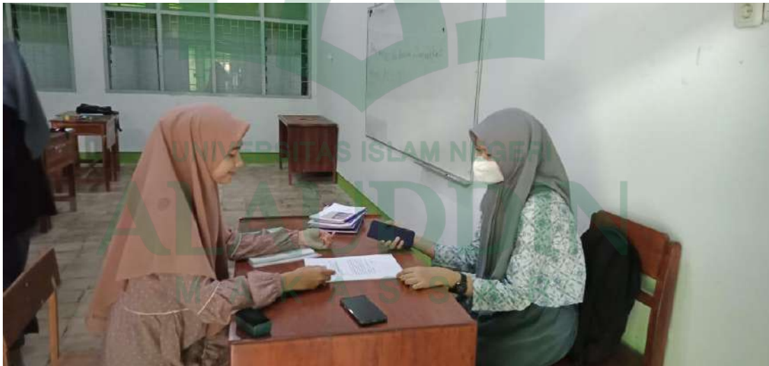
Peneliti melakukan wawancara terhadap salah satu peserta didik jurusan kriya tekstil kelas XI tekstil 1 di ruang kelas SMK Negeri 3 Gowa