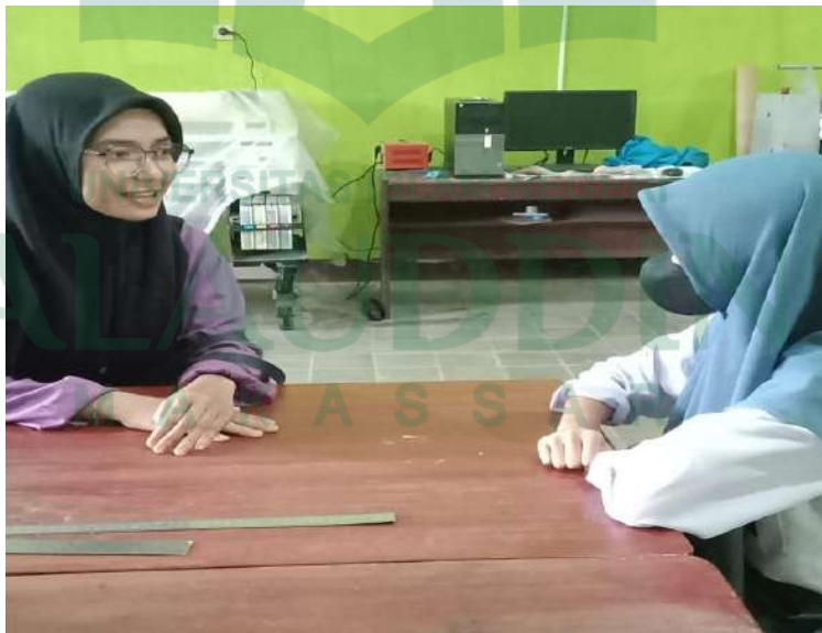
Peneliti melakukan wawancara terhadap salah satu peserta didik jurusan kriya tekstil kelas XI tekstil 1 di ruang sablon SMK Negeri 3 Gowa