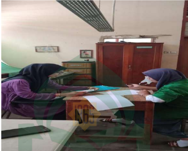
Peneliti melakukan wawancara terhadap salah satu peserta didik jurusan kriya tekstil kelas XI tekstil 1 di ruang sablon SMK Negeri 3 Gowa