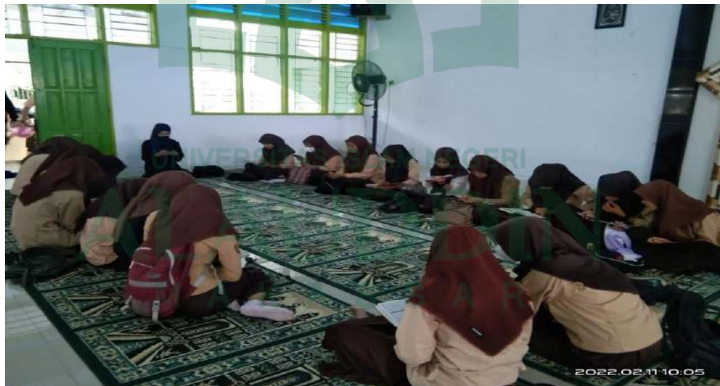
Suasana mengaji bersama sebelum memulai pembelajaran pendidikan agama Islam dan budi pekerti jurusan kriya tekstil kelas XI tekstil 1 SMK Negeri 3 Gowa