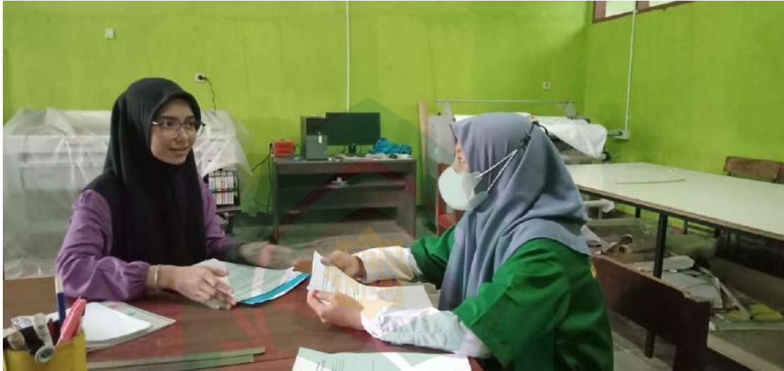
Peneliti melakukan wawancara terhadap salah satu peserta didik jurusan kriya tekstil kelas XI tekstil 1 di ruang sablon SMK Negeri 3 Gowa