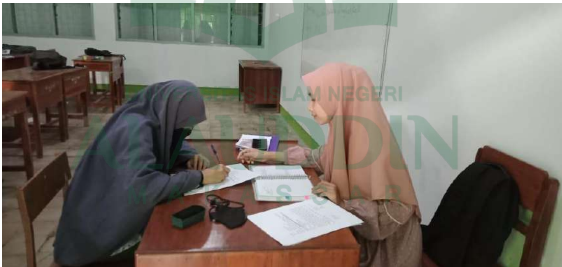
Peneliti melakukan wawancara terhadap salah satu peserta didik jurusan kriya tekstil kelas XI tekstil 1 di ruang kelas SMK Negeri 3 Gowa