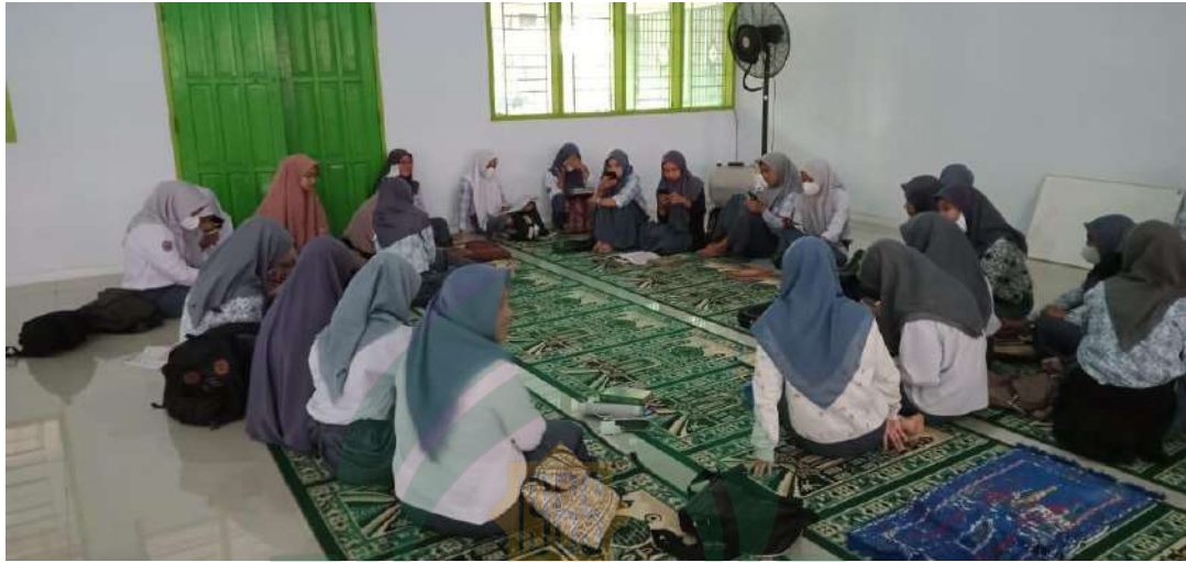
Suasana belajar pendidikan agama Islam dan budi pekerti jurusan kriya tekstil kelas XI tekstil 1 SMK Negeri 3 Gowa