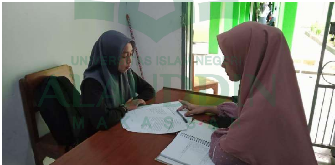
Peneliti melakukan wawancara terhadap salah satu peserta didik jurusan kriya tekstil kelas XI tekstil 1 di ruang kelas SMK Negeri 3 Gowa