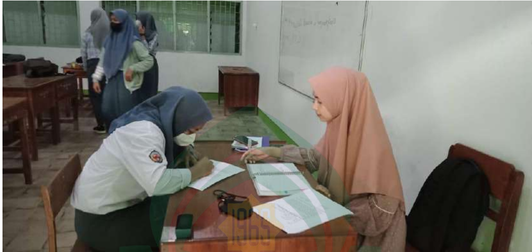
Peneliti melakukan wawancara terhadap salah satu peserta didik jurusan kriya tekstil kelas XI tekstil 1 di ruang kelas SMK Negeri 3 Gowa