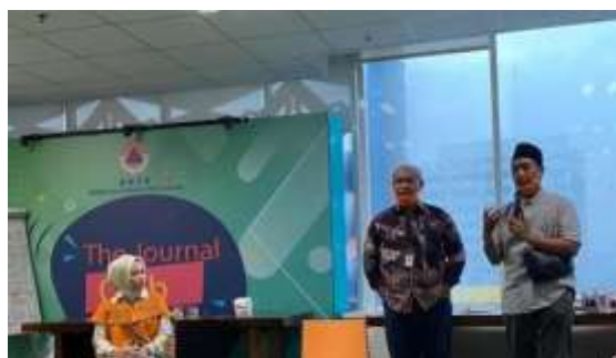
Gambar 4.3. Gugus Tugas BNPB bersama influencer

Judul berita: “Ketika BNPB Bersama Milenial Kolaborasi Tangkal Penyebaran Hoax”