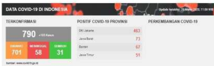
Gambar 4.2. Data perkembangan COVID-19

Gambar 4.2 di atas merupakan pemberitaan mengenai kebijakan pemerintah dan peran milenial dalam penanganan pandemi Covid-19. Kompas.com memberitakan ini pada 23 Maret 2020. Pembingkai berita yang dimunculkan oleh media online Kompas.com di atas dapat dianalisis melalui empat elemen framing berikut: