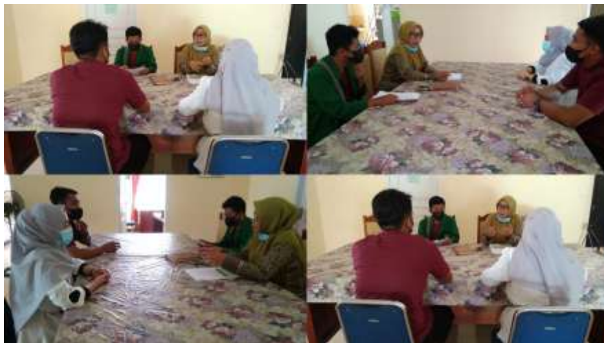
Wawancara dengan Calon Pengantin