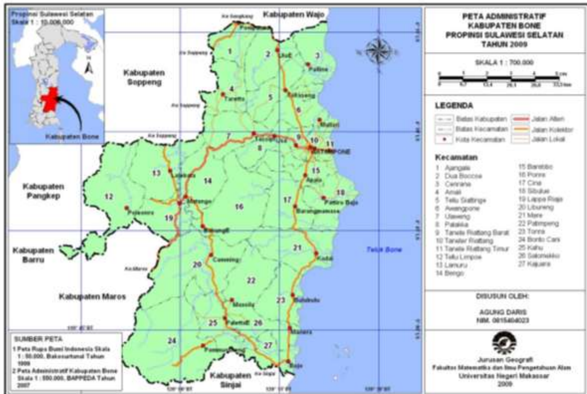
Gambar 1. Peta Administratif Kabupaten Bone

Letak Geografis Kecamatan Ulaweng adalah salah satu dari 27 Kecamatan