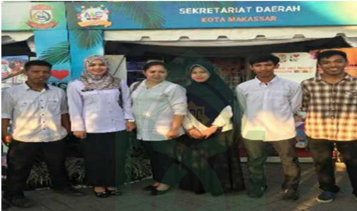
Sosialisasi di kelurahan-kelurahan di seluruh Kota Makassar