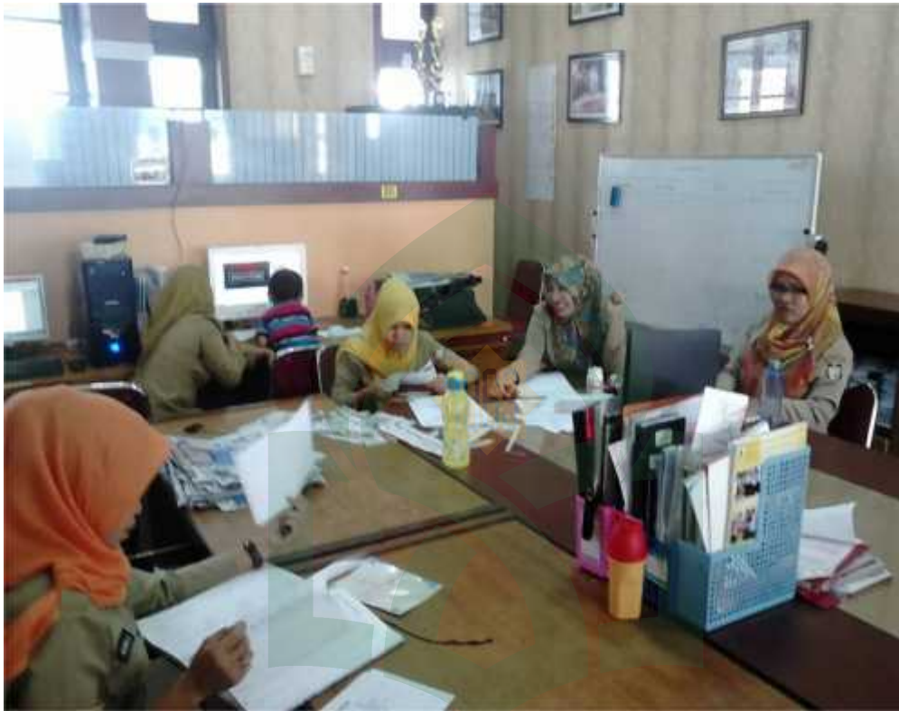
Aktivitas staf humas, mengunting koran dan membuat klipng