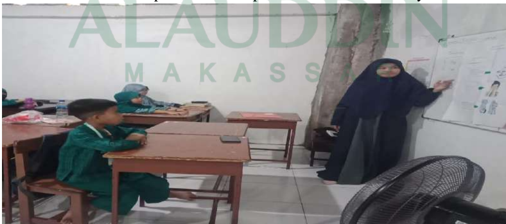
Peneliti/Pendidik menjelaskan tentang materi tayammum