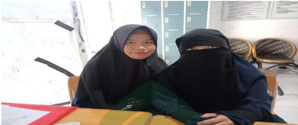
Pendidik Mata Pelajaran Fiqih, setelah peneliti dan pendidik Mata Pelajaran telah melaksanakan wawancara.