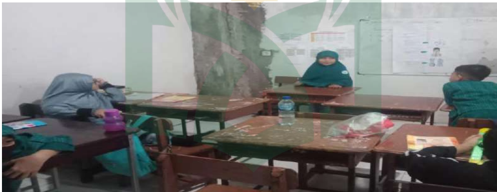
Peserta didik naik ke depan untuk mempraktekkan tata cara bertayammum