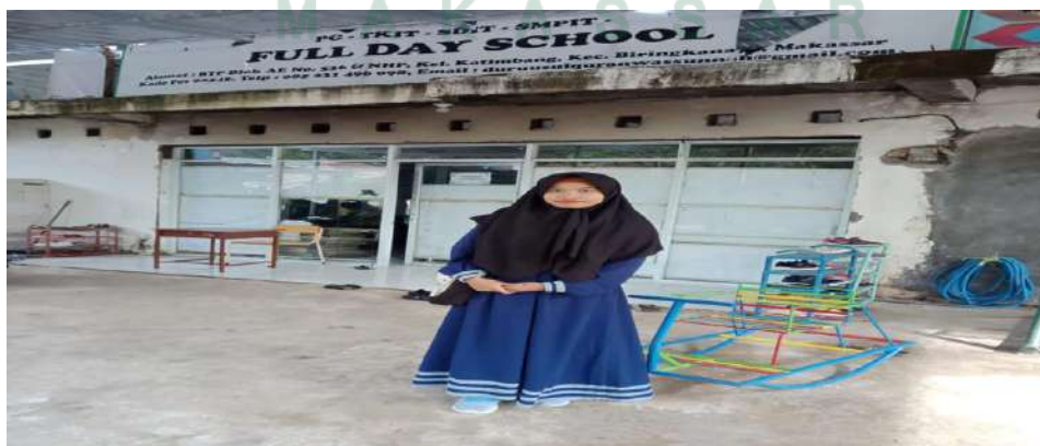
Visi dan Misi SDIT Duruusul Qur'an Makassar