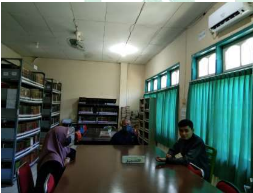
Wawancara dengan kepala Perpustakaan pustakawan Sekolah Tinggi Ilmu Islam dan Bahasa Arab (STIBA) Makassar