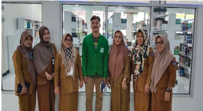
Gambar II Kondisi ruangan Dinas Perpustakaan dan Kearsipan Provinsi Sulawesi Selatan.