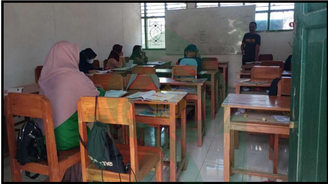
Proses Pembelajaran di kelas yang dilakukan oleh Guru Akidah Akhlak