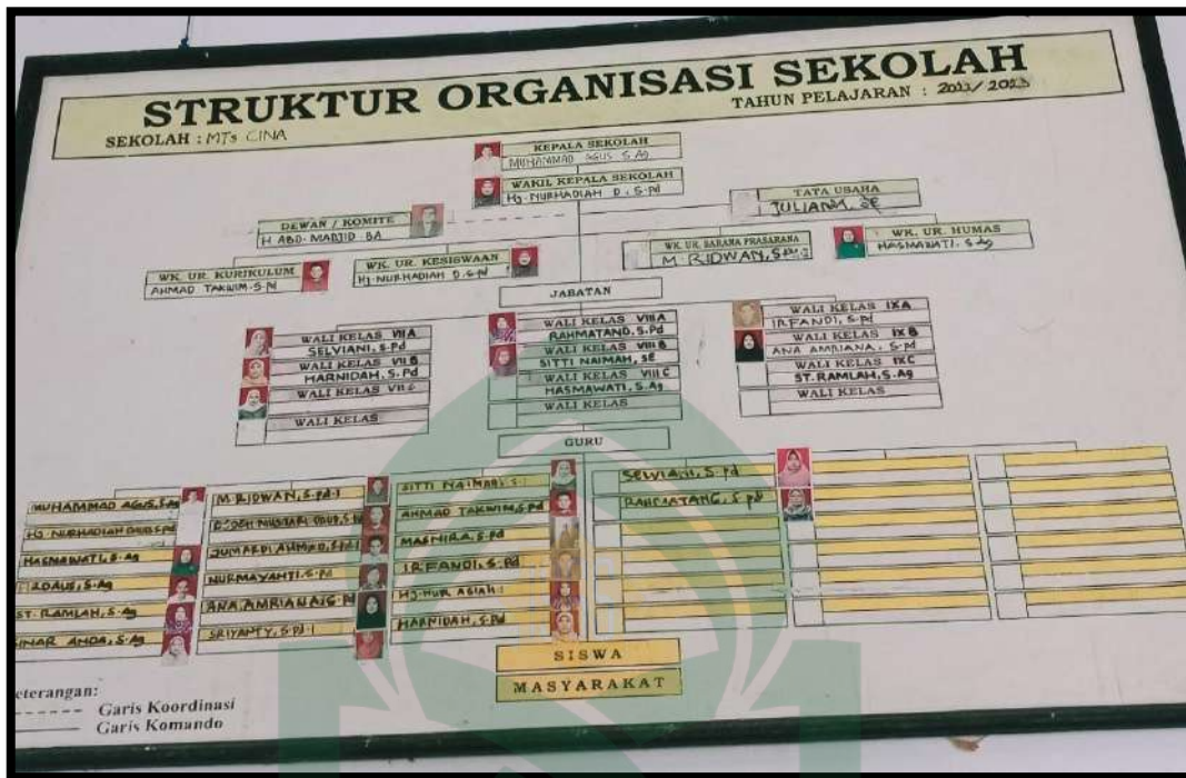
Struktur organisasi MTs Cina Kecamatan Cina