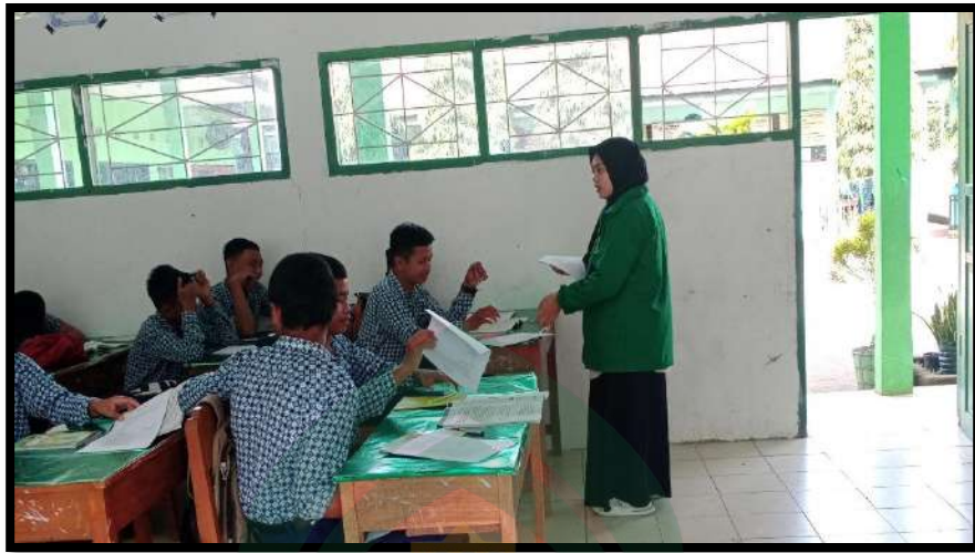
Pengisian Angket Oleh Peserta Didik MTs Cina Kecamatan Cina