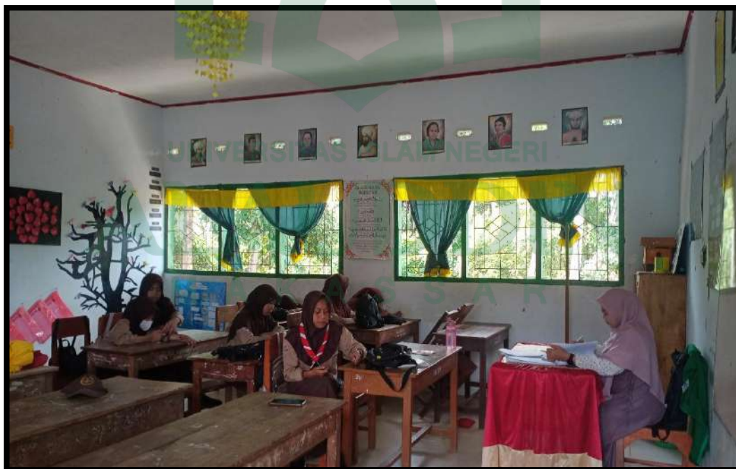
Pengisian Angket Oleh Peserta Didik MTs Cina Kecamatan Cina