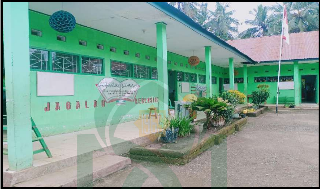
Keadaan MTs Cina Kecamatan Cina Kabupaten Bone