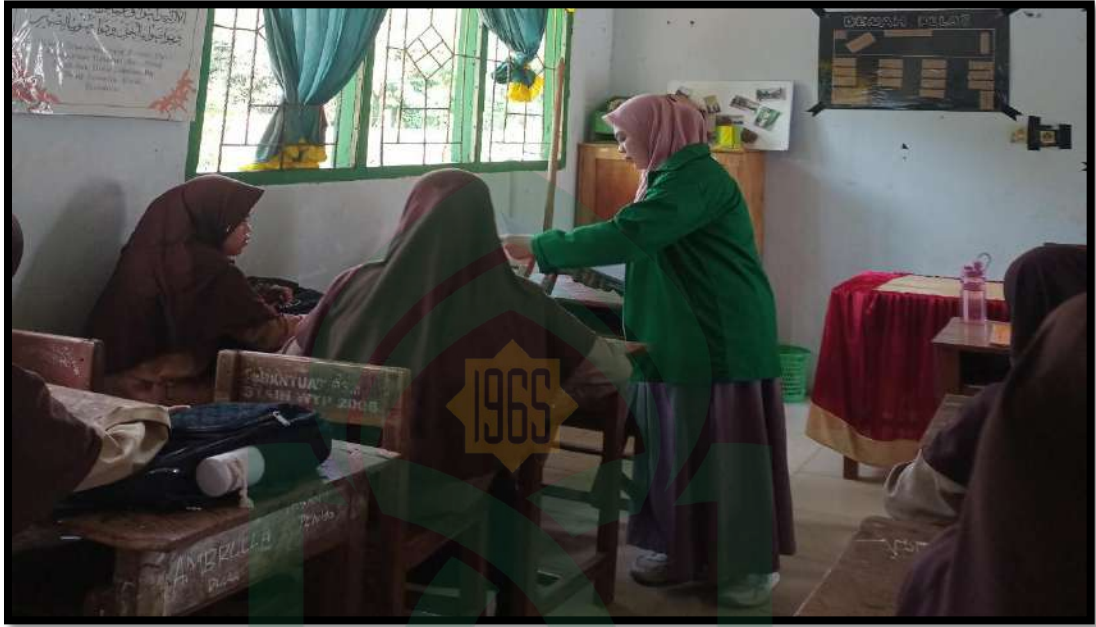
Pengisian Angket Oleh Peserta Didik MTs Cina Kecamatan Cina