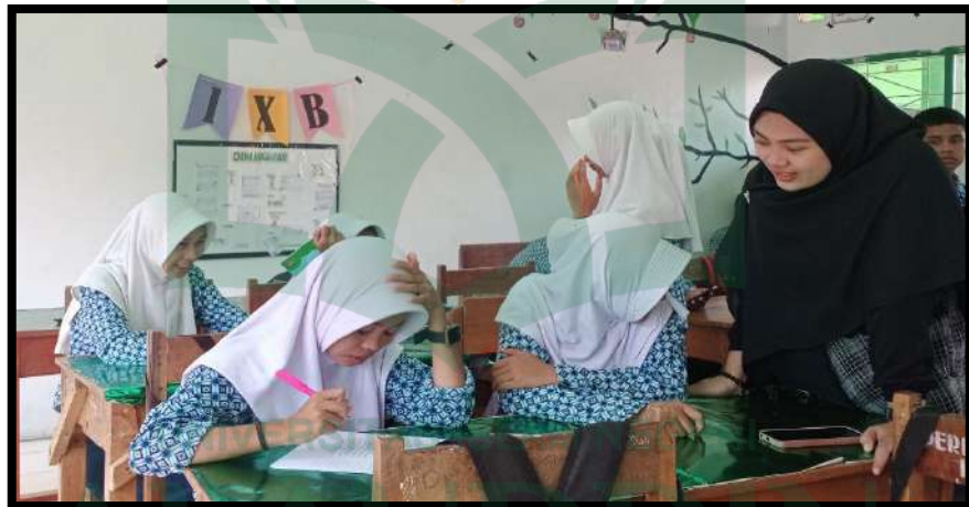
Pengisian Angket Oleh Peserta Didik MTs Cina Kecamatan Cina