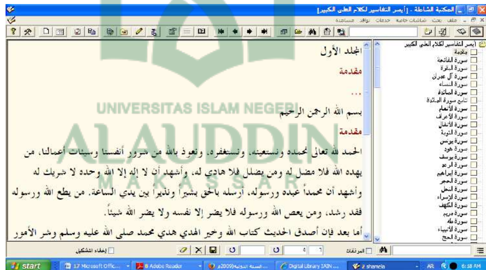
Gambar 4.3. Tampilan Aisar al-Tafsir li Kalam al-Aliyy al-Kabir

Contoh di atas adalah kumpulan buku tafsir Al-Qur'an. Termasuk kitab Aisar al-Tafsir li Kalam al-Aliyy al-Kabir dan kitab-kitab lainnya. Untuk mengetahui tentang penulis sebuah buku, cari dulu bukunya. Contohnya adalah buku penjelasan yang disebutkan di atas. Klik dua kali pada judul buku untuk menampilkan layar seperti yang ditunjukkan di bawah ini.