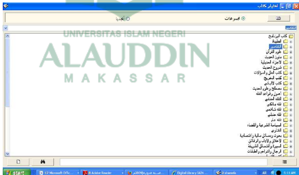
Gambar 4.2 Daftar al-Majmu'ah (Bidang keilmuan)

Dari gambar 4.2 di atas tampak bidang rumpun ilmu Islam seperti al-Aqidah, al-Tafsir, Ulumul Qur'an, Mutun al-Hadis dan lain sebagainya. Jumlah pembidangan (al-majmu'ah) adalah 53 majmu'ah (bidang).