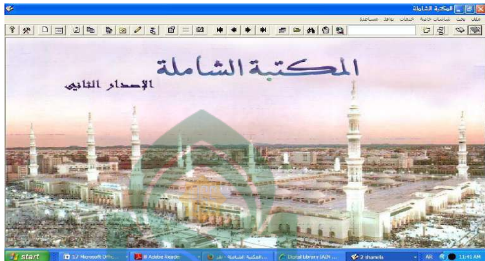
Gambar 4.1 Tampilan utama Layar Maktabah Syamilah