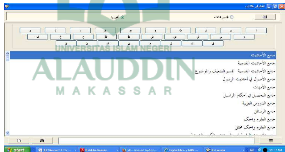
Gambar 4.4. Daftar Kitab Secara Abjadiyyan

Daftar buku juga dapat diurutkan berdasarkan abjad berdasarkan urutan abjad. Yang harus pengguna lakukan adalah memeriksa opsi berdasarkan abjad. Alfabet berarti buku yang akan ditampilkan berdasarkan huruf kapital alfabet dari judul masing-masing buku. Misalnya, huruf yang muncul di layar. Oleh karena itu, jika opsi alfabet dipilih, tampilan dalam daftar koleksi buku akan diatur dalam urutan abjad. Lihat Gambar 4.4 di bawah ini untuk lebih jelasnya.