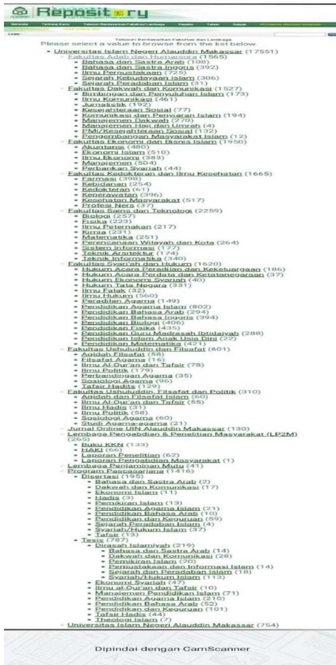
Daftar koleksi Repository Universitas Islam Negeri Alauddin Makassar