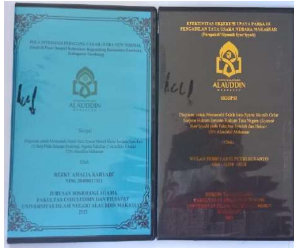
CD skripsi mahasiswa Universitas Islam Negeri Alauddin Makassar