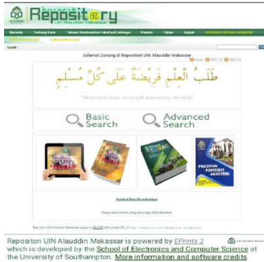
Website Repository Universitas Islam Negeri Alauddin Makassar ( https://repositori.uin-alauddin.ac.id )