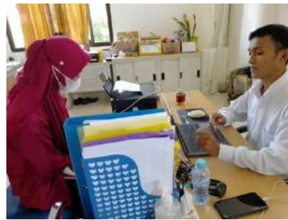
Wawancara dengan tim repository