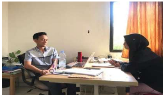
Wawancara dengan dosen