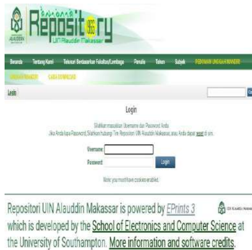
Login akun ke Repository Universitas Islam Negeri Alauddin Makassar