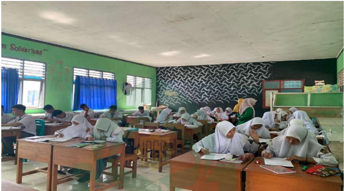
Peserta didik kelas MIA 1 SMA Negeri 12 Maros mengisi lembar angket