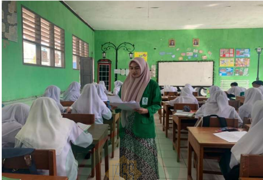
Peserta didik kelas MIA 2 SMA Negeri 12 Maros mengisi lembar angket