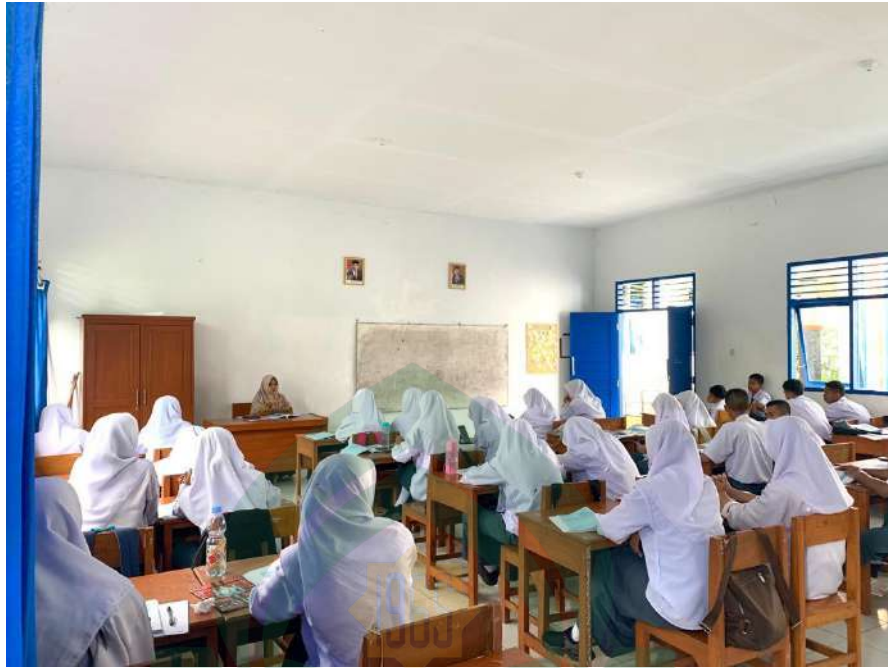
Suasana Proses Belajar Mengajar SMA Negeri 12 Maros