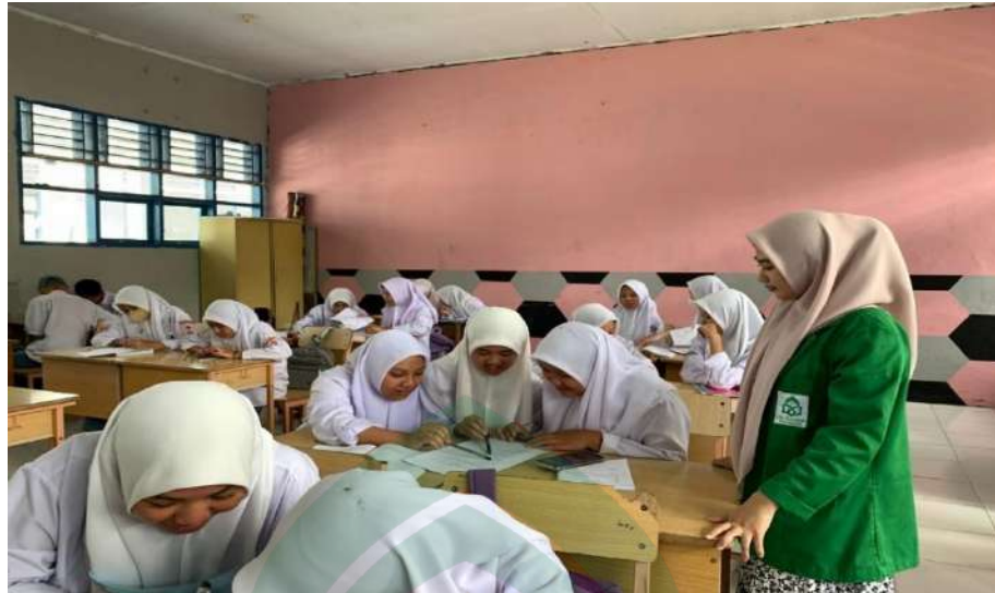
Peserta didik kelas MIA 2 SMA Negeri 12 Maros mengisi lembar angket