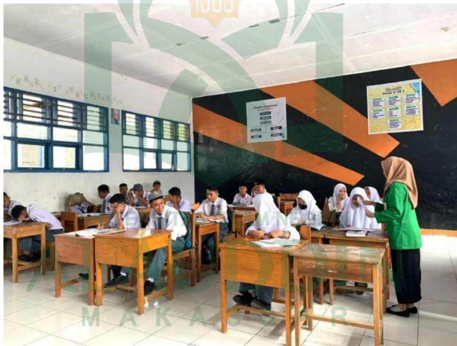
Peserta didik kelas IIS 2 SMA Negeri 12 Maros mengisi lembar angket