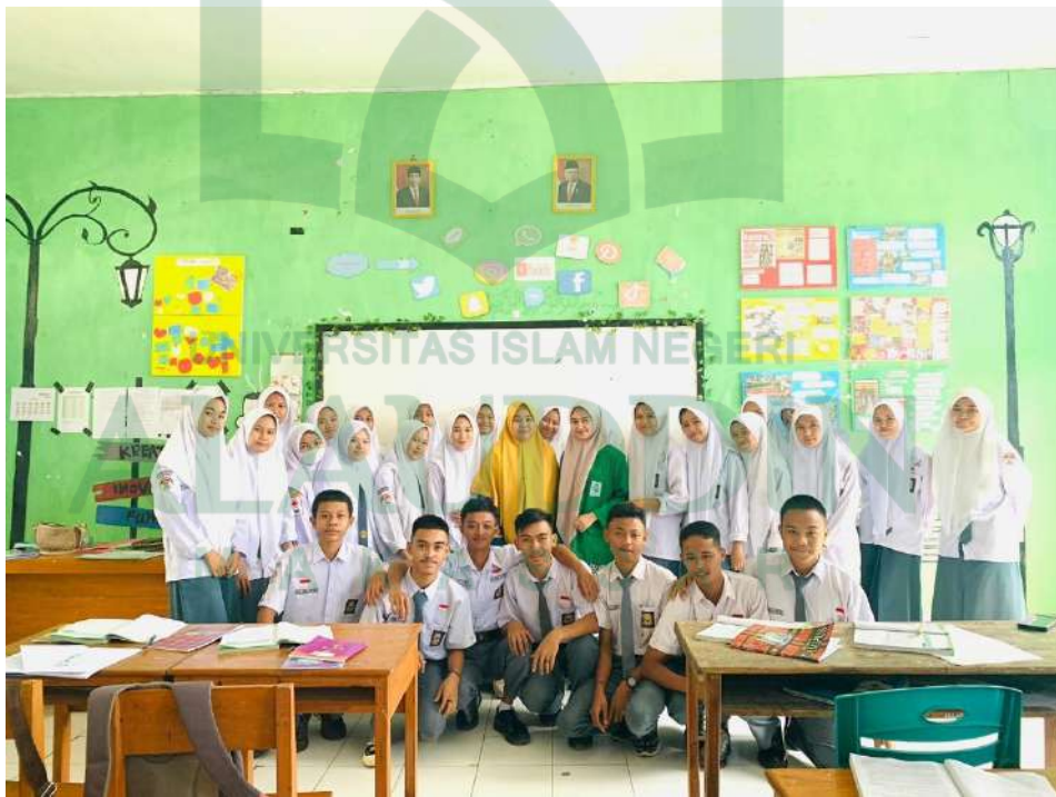
Foto Bersana Guru Pendidikan Agama Islam Dan Peserta Didik SMA Negeri 12 Maros