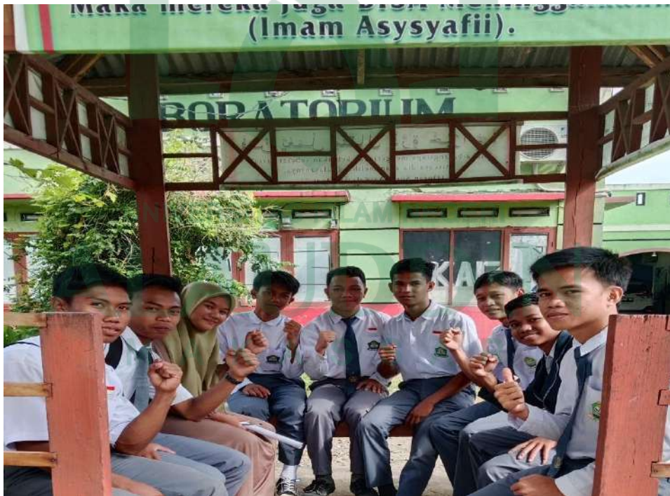
Foto bersama dengan pengurus organisasi santriwan