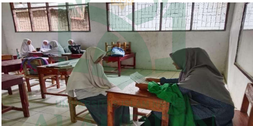
Wawancara dengan santriwati kelas XI MA Abnaul Amir