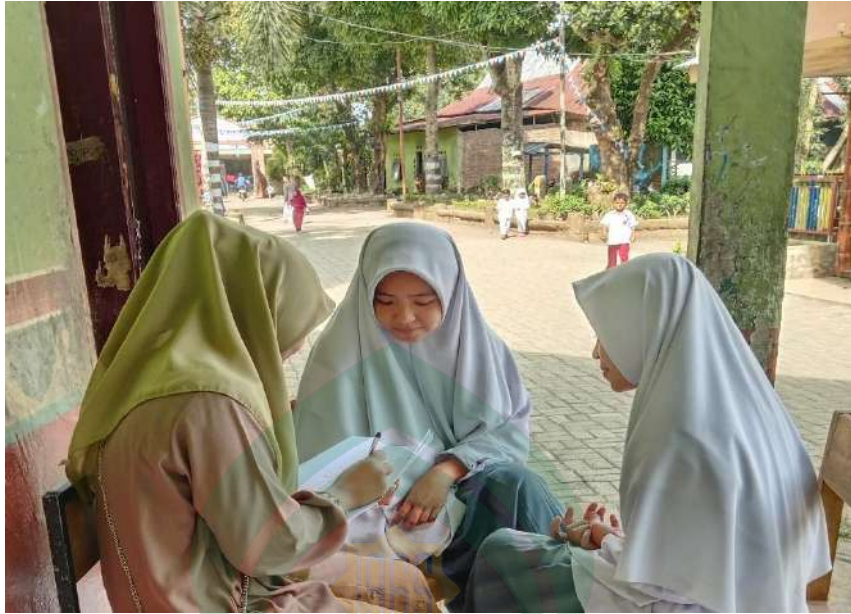
Wawancara dengan pengurus santriwati