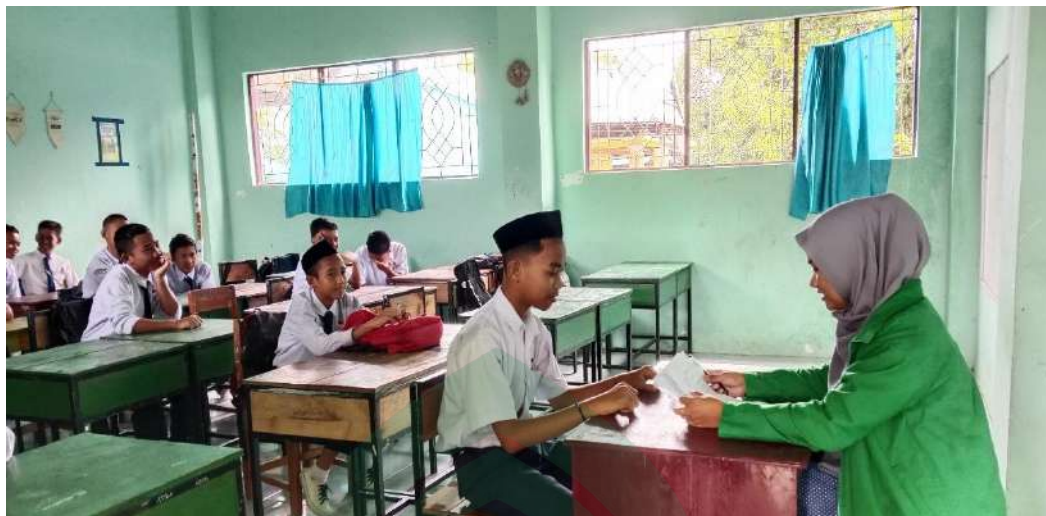
Wawancara dengan Santriwan kelas IX MTs Abnaul Amir