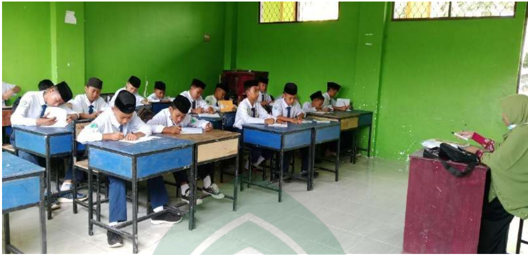
Suasana belajar di kelas putra Madrasah Tsanawiyah