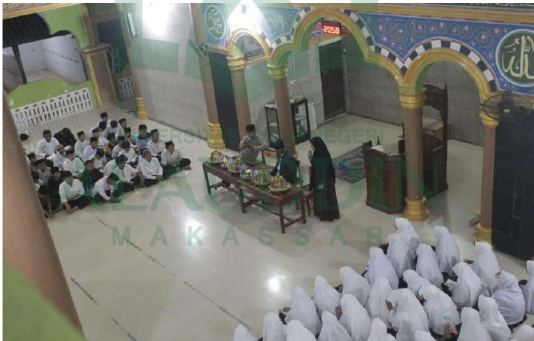
Kegiatan Malam Bina Iman dan Takwa (MABIT)