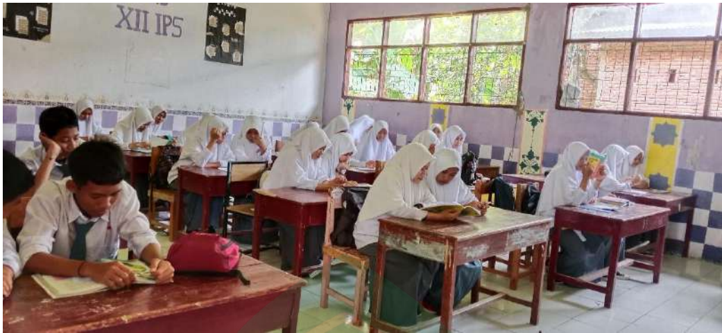
Suasana belajar di Madrasah Aliyah