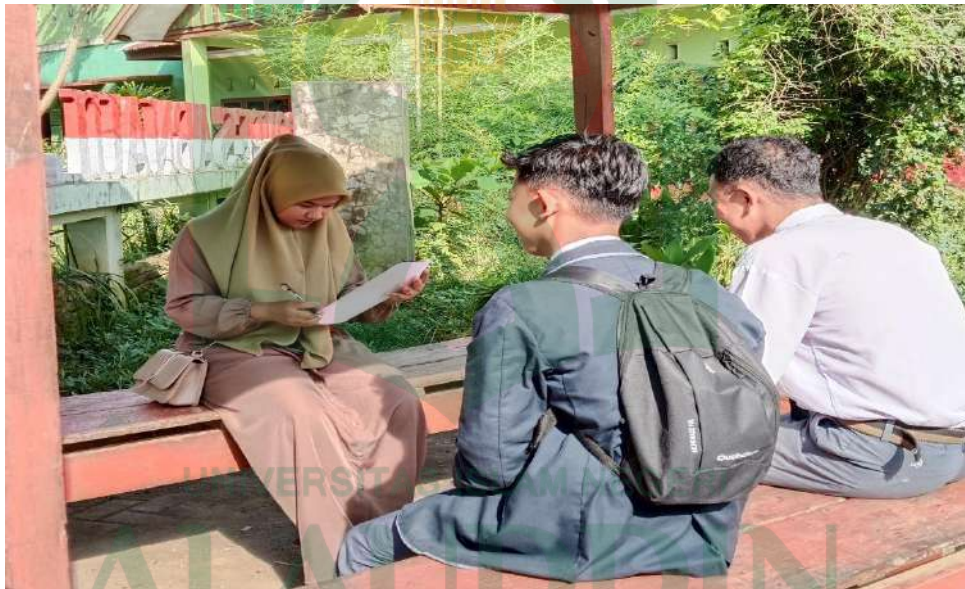
Wawancara dengan pengurus bagian kebersihan