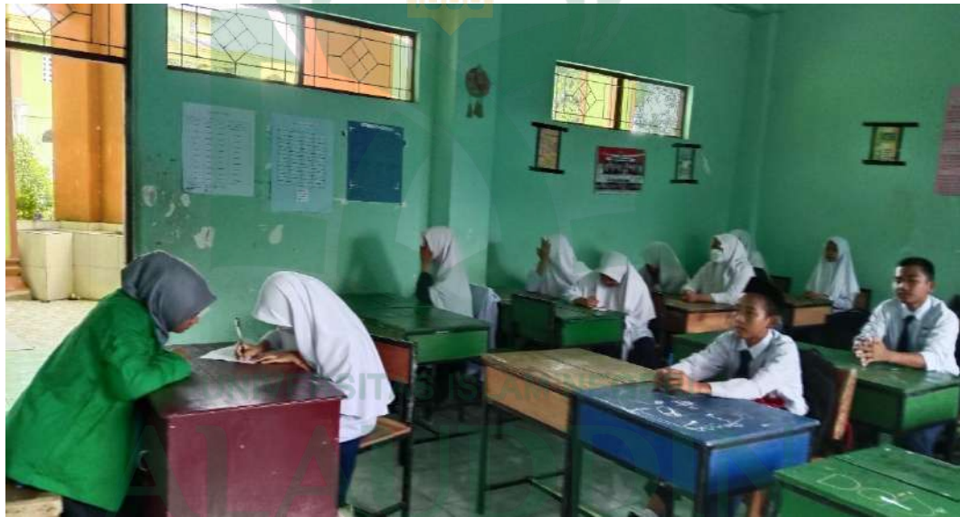
Wawancara dengan santriwati kelas IX MTs Abnaul Amir