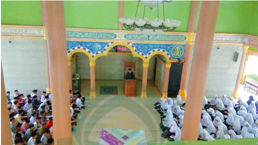
Dokumentasi kegiatan muhadharoh