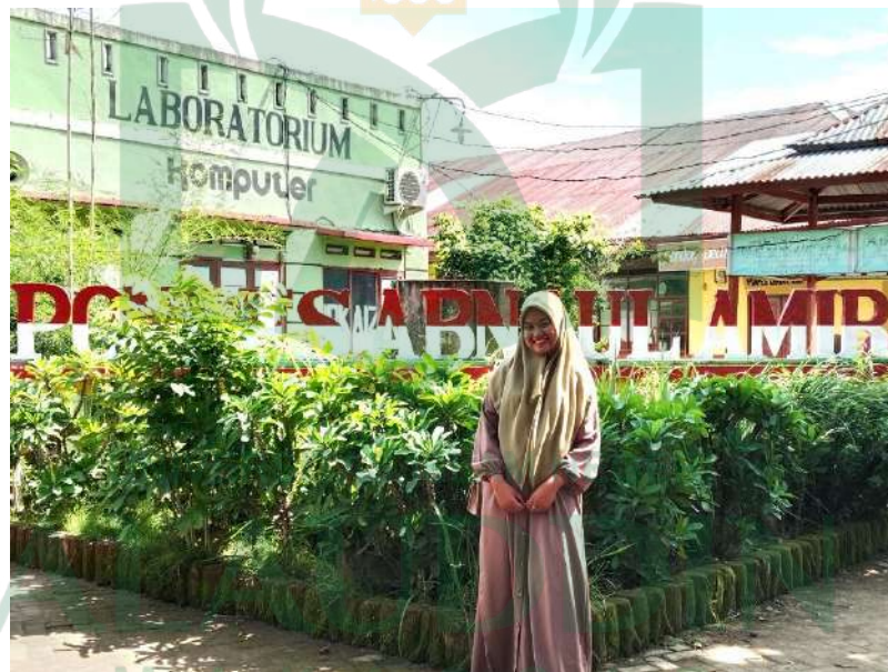
Lokasi penelitian di Pondok Pesantren Abnauul Amir Gowa