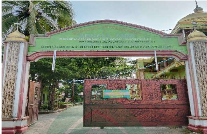
Lokasi penelitian di Pondok Pesantren Abnauul Amir Gowa