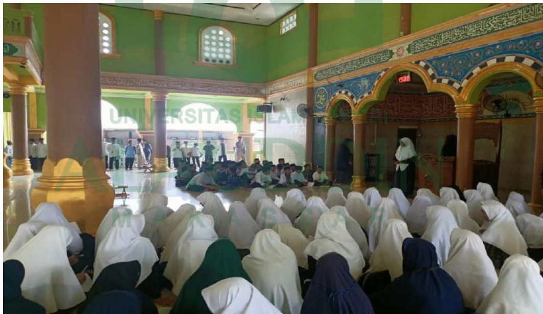
Dokumentasi kegiatan muhadharoh