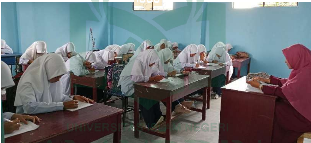
Suasana belajar di kelas putri Madrasah Tsanawiyah