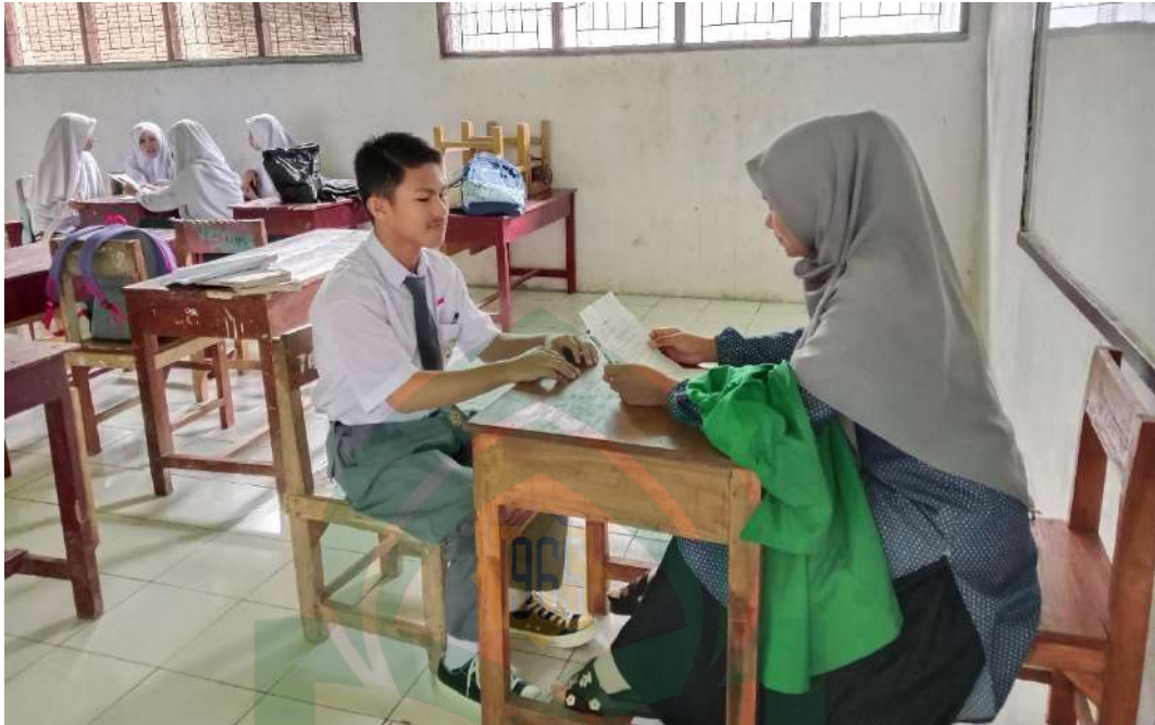
Wawancara dengan santriwan kelas XI MA Abnaul Amir