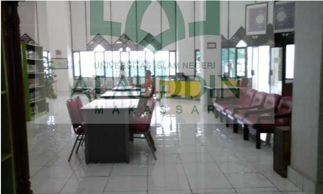
Gambar 6: Layanan Ruang Baca