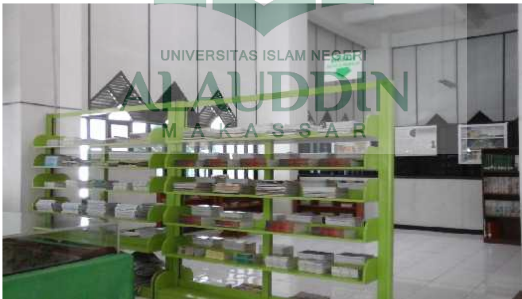
Gambar 2: Koleksi Anak dan Remaja