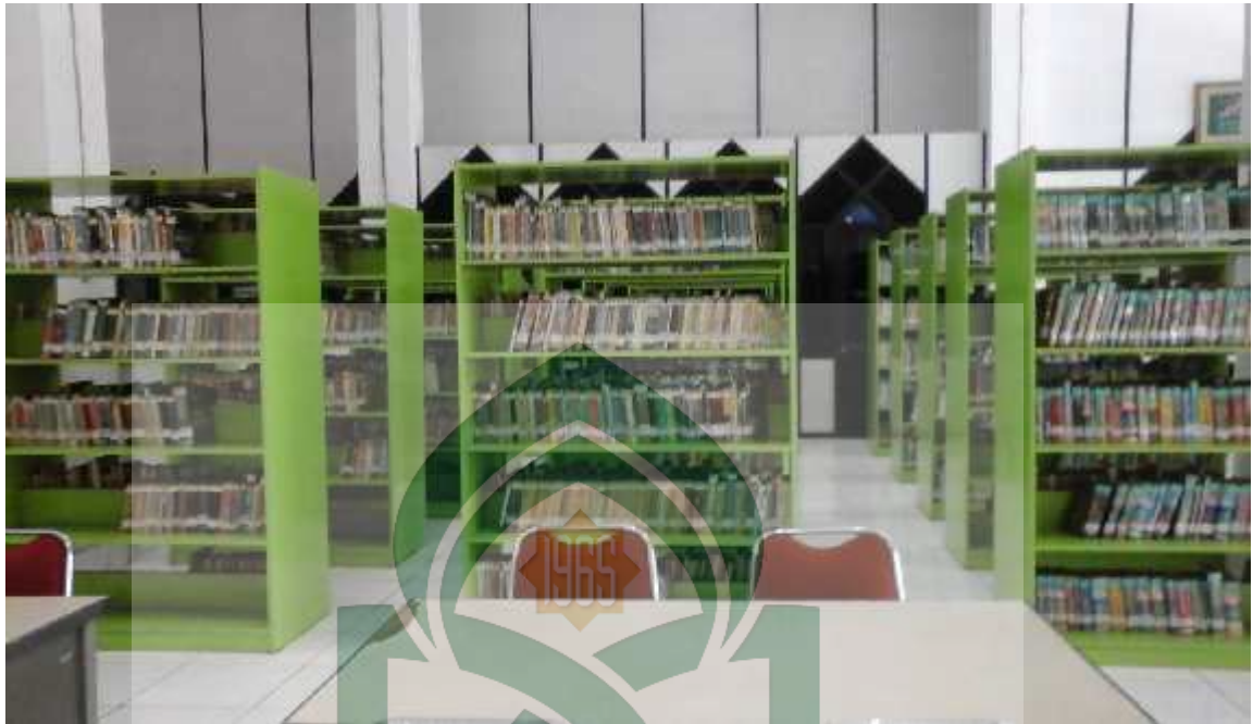
Gambar 1: Rak Koleksi Buku