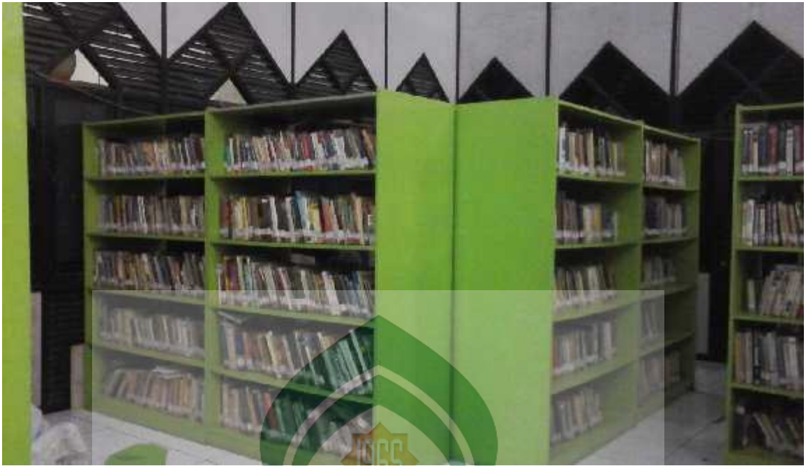
Gambar 5: Koleksi Buku Islam