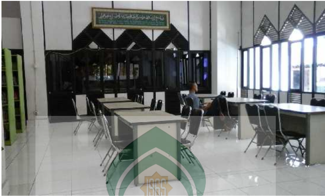
Gambar 3: Layanan Ruang Baca