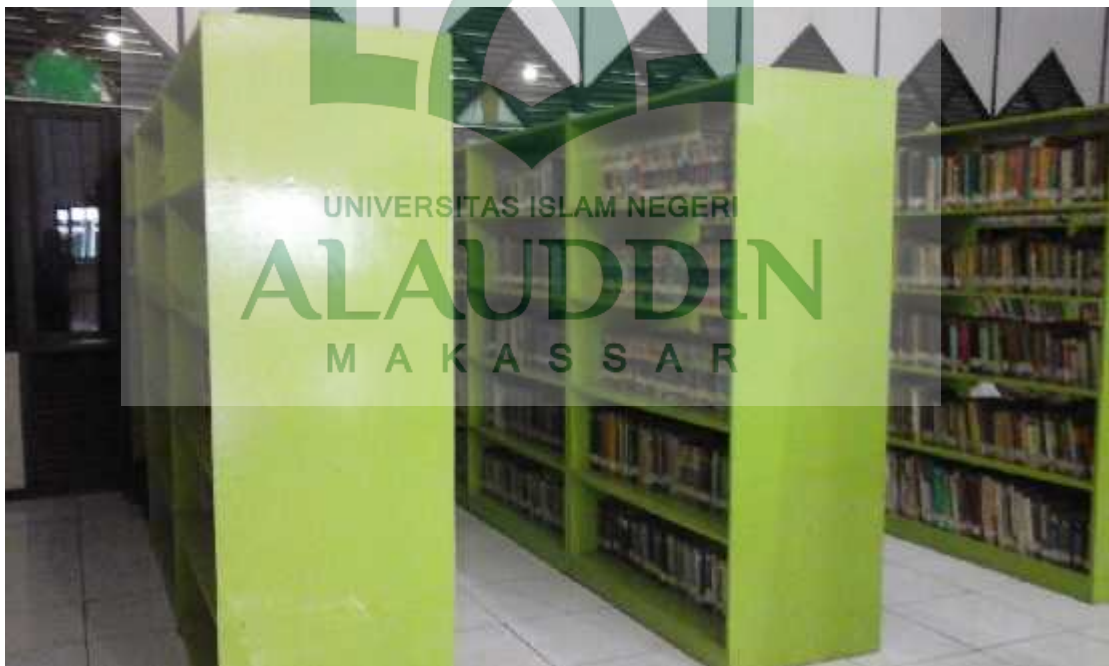
Gambar 4: Rak Buku