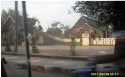
Gambar 4 : “Balla Lompoa” rumah adat makassar, tempat tinggal Raja Gowa.

Gambar perahu phinisi yang mempunyai tujuh layar mengandung makna kemampuan nenek moyang kita mengarungi tujuh samudera. Perahu phinisi tersebut merupakan perahu yang dipakai oleh Sawerigading anak dari Batara Lattu untuk meninggalkan tanah kelahirannya menuju negeri Tiongkok karena bermaksud mengawini We Tenrinyabeng yang ternyata tidak dibolehkan karena We Tenrinyabeng masih memiliki hubungan darah dengan Sawerigading. Setelah sampai di negeri Tiongkok, ia kemudian mengawini Putri raja Tiongkok yang bernama We Cudai dan kembali ke tanah kelahirannya.