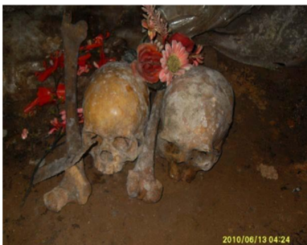
Gambar 5 : Jenazah orang Toraja yang diistirahatkan di dalam goa atau di gunung

Pada gambar tersebut, terdapat balai-balai yang digunakan oleh raja untuk mengadakan musyawarah dengan pemangku adat, pemangku agama dalam mengambil keputusan. Ini berarti bahwa konsep demokrasi sudah lama dikenal dan diterapkan oleh raja-raja dulu di Sulawesi Selatan. Konsep demokrasi dalam bahasa setempat dikenal dengan istilah Sipakatau Sipakalebbi .