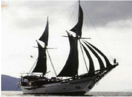
Gambar 3 : Perahu Phinisi yang dibuat oleh etnis Bugis Makassar di Kab. Bulukumba

Gambar perahu phinisi yang mempunyai tujuh layar mengandung makna kemampuan nenek moyang kita mengarungi tujuh samudera. Perahu phinisi tersebut merupakan perahu yang dipakai oleh Sawerigading anak dari Batara Lattu untuk meninggalkan tanah kelahirannya menuju negeri Tiongkok karena bermaksud mengawini We Tenrinyabeng yang ternyata tidak dibolehkan karena We Tenrinyabeng masih memiliki hubungan darah dengan Sawerigading. Setelah sampai di negeri Tiongkok, ia kemudian mengawini Putri raja Tiongkok yang bernama We Cudai dan kembali ke tanah kelahirannya.