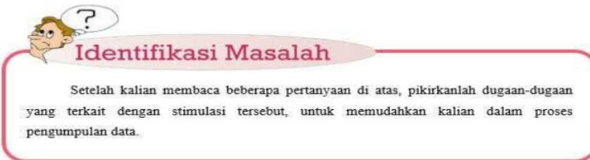
Gambar 2: Pernyataan/Identifikasi Masalah ( Problem Statement )