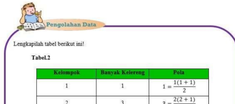
Gambar 4: Pengolahan Data (Data Processing)