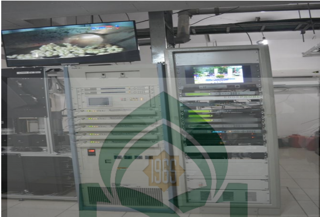
Gambar 1.1 Pemancar Sistem Digital