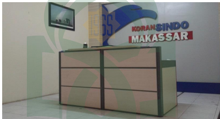
Lobi koran sindo