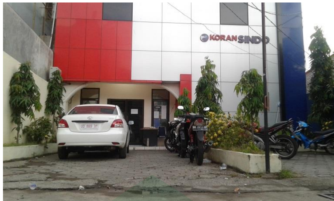
Halaman depan koran SINDO Makassar