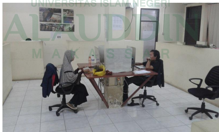
Ruang kerja koran SINDO Makassar