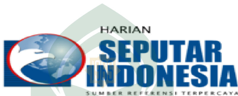
Gambar 4.1 Logo lama Koran SINDO (2009-2013)