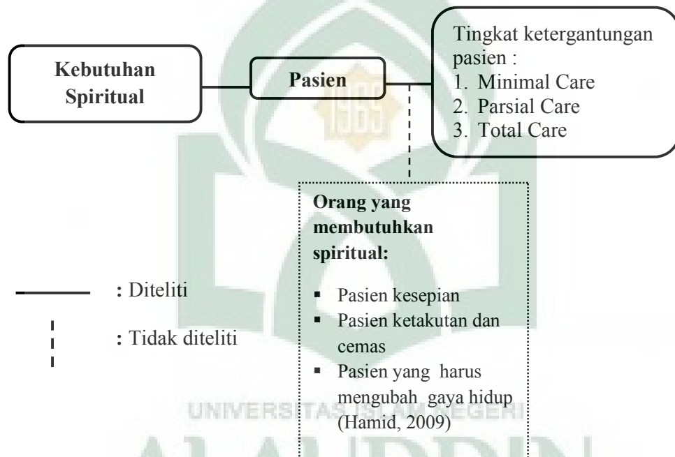
Skema 2.1. Kerangka Konsep Penelitian

diri mereka dan lebih bergantung pada orang lain untuk perawatan dan dukungan. Distres spiritual dapat berkembang sejalan dengan seseorang mencari makna tentang apa yang sedang terjadi, yang mungkin dapat mengakibatkan seseorang merasa sendiri dan terisolasi dari orang lain.