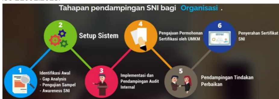
Gambar 3: Tahapan Pendampingan SNI bagi Organisasi Pendidikan (BSN, 2022).

Mekanisme penerapan sistem manajemen pendidikan tinggi Berdasarkan SNI ISO 21001:2018: