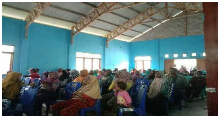
Gambar 4.1 Proses penyaluran Bantuan Langsung Tunai

“penyalurannya kami berkumpul dulu di aula nanti di panggil nama dulu baru maju untuk mengambil itu secara tunai dan mekanisme penyalurannya jelas dan transparan disalurkan setiap bulan.”