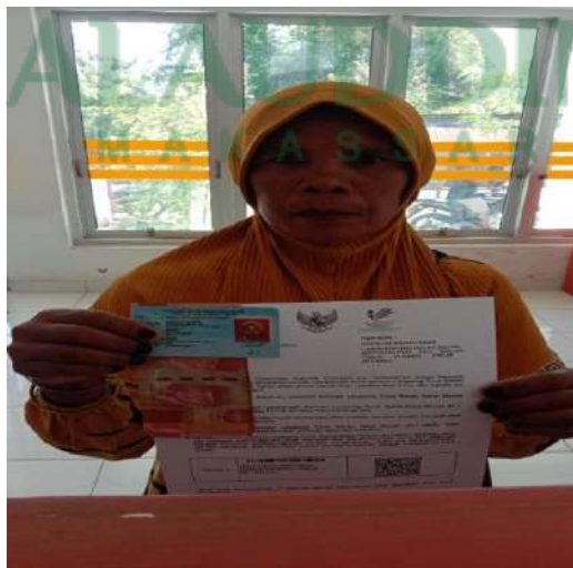
Gambar 4.2 Pengambilan Dana Bantuan Sosial Tunai

“kalau untuk sosialisasi ke masyarakat itu sudah, seperti BST ini dari kementerian sosial, dan nanti penyalurannya di kecamatan dan pihak kantor pos yang menyalurkan dan harus membawa KTP, KK dan surat yang barcode yang dibagikan.