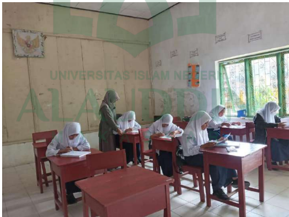
Peserta didik sedang mengisi Lembar Kuesioner