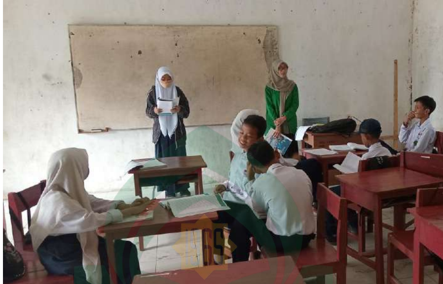
Proses pembelajaran setelah diterapkan strategi pembelajaran aktif peer lesson .