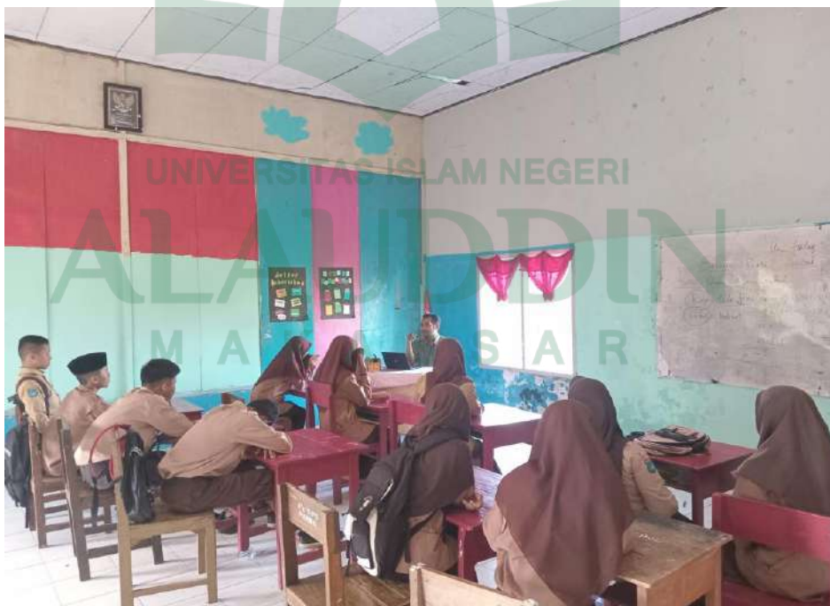
Peserta didik sedang memperhatikan guru menjelaskan