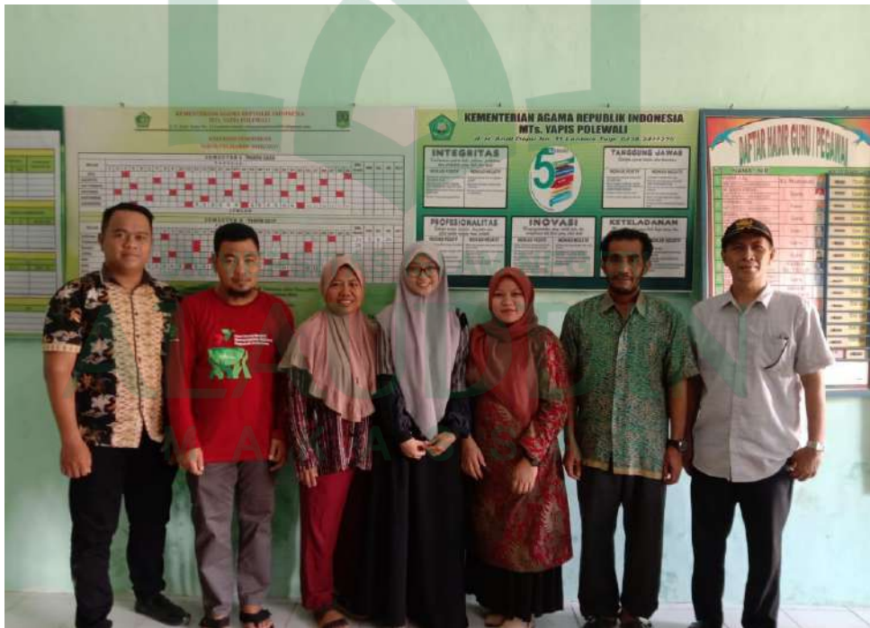
Foto bersama Guru dan para Staf MTs Yapis Polewali Mandar