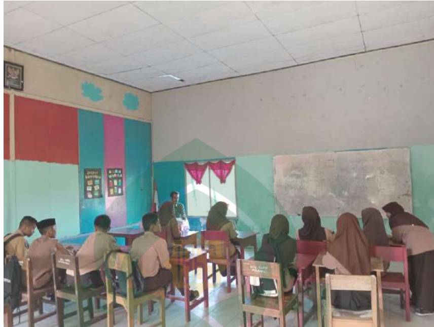
Proses pembelajaran sebelum diterapkan strategi pembelajaran aktif peer lesson .