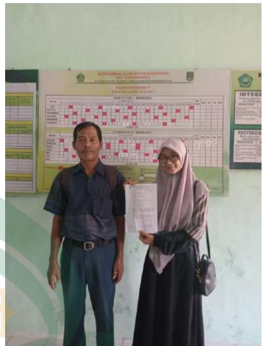
Foto bersama Kamad MTs Yapis Polewali