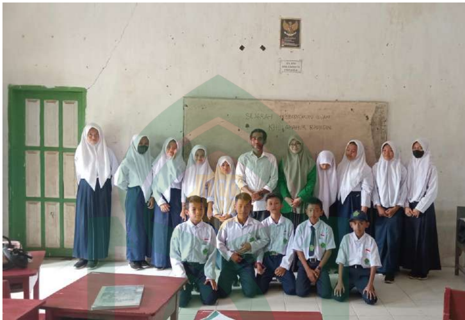
Foto bersama Siswa kelas VII dan Guru SKI