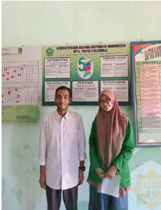
Foto bersama guru SKI