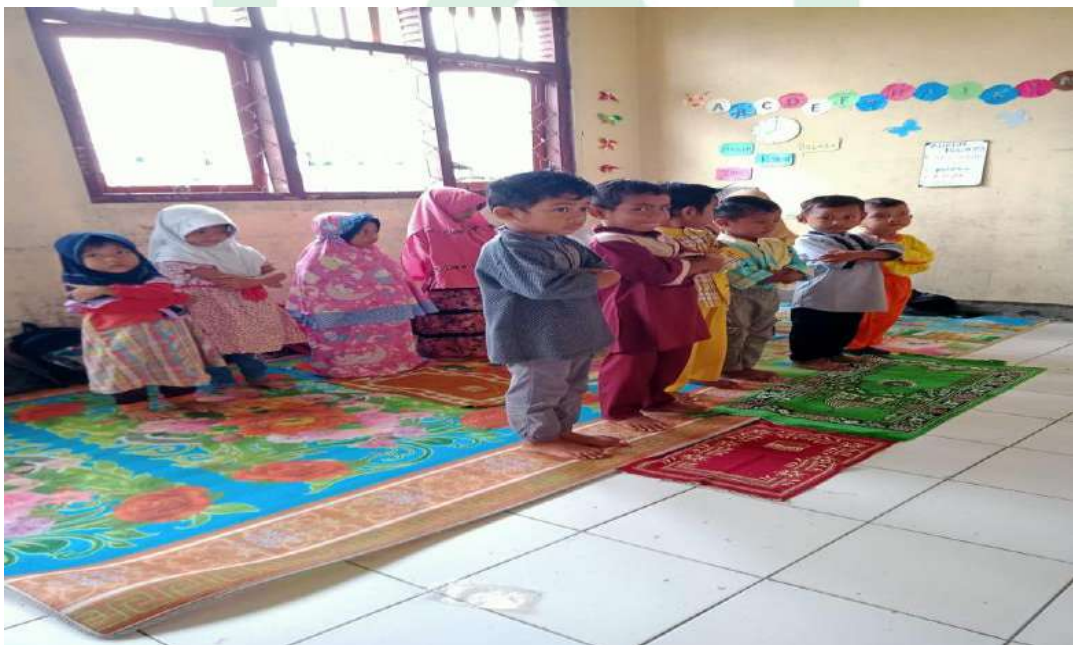
Melakukan Kegiatan solat dzhur di RA. Jannah Pota