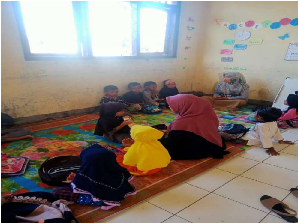
Kegiatan Proses Belajar Mengajar Di RA. Jannah Pota