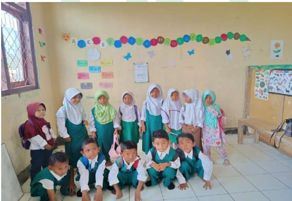
Dokumentasi Setelah Kegiatan Proses Belajar Mengajar Di RA. Janna Pota