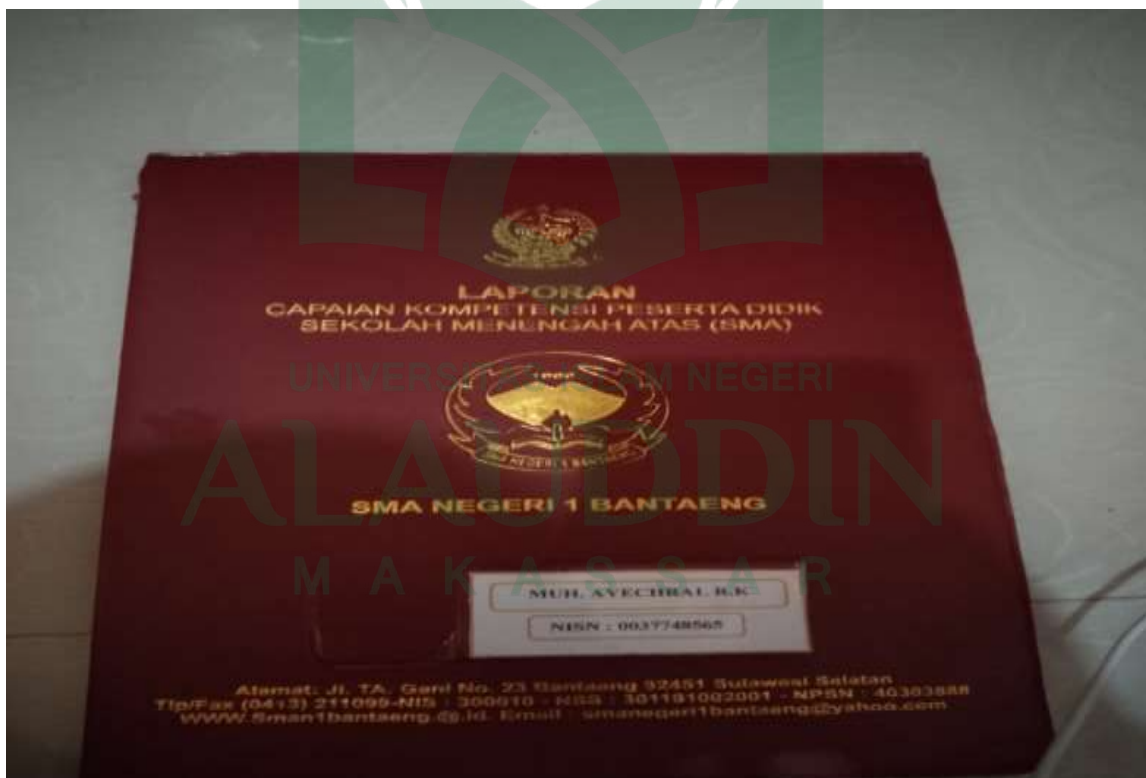
Rekaptulasi Nilai Rapor Peserta Didik