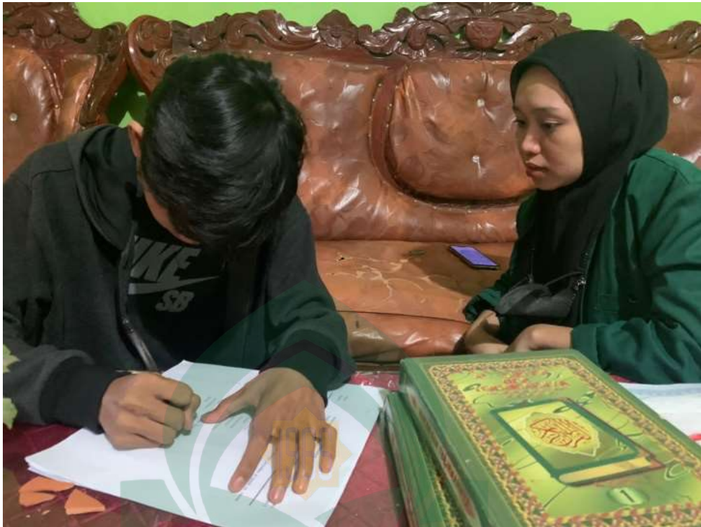
Pengisian Kuuesioner Peserta Didik