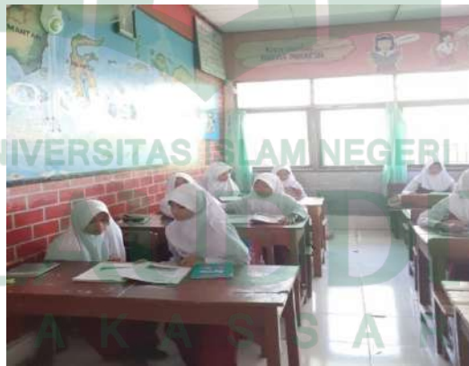
Foto Peserta Didik Mengisi Angket