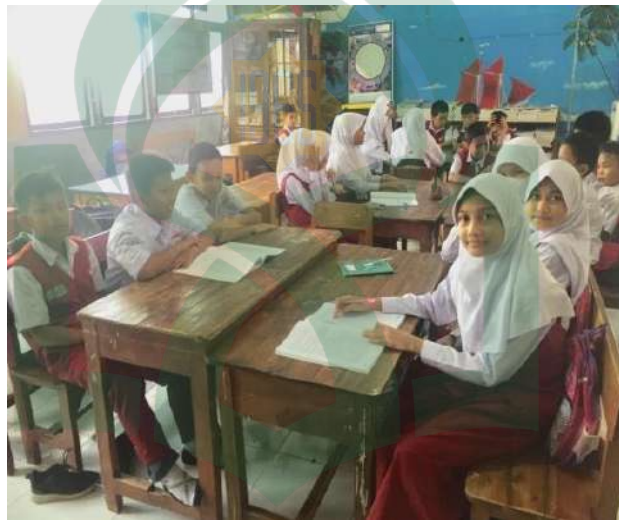
Foto suasana sekolah