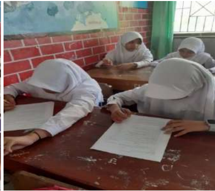
Proses pembelajaran setelah diterapkan metode team quiz