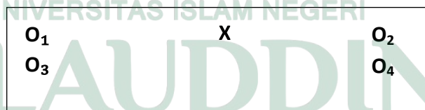
Desain penelitian Quasi eksperimen

Desain penelitian yang digunakan adalah quasi eksperimen dengan menggunakan metode non-equivalent control group design .