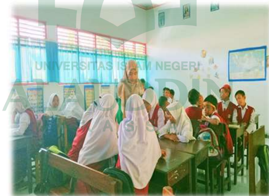
Gambar 1.4 (Membagikan LKPD setiap Kelompok pada kelas Eksperimen dan kelas kontrol)