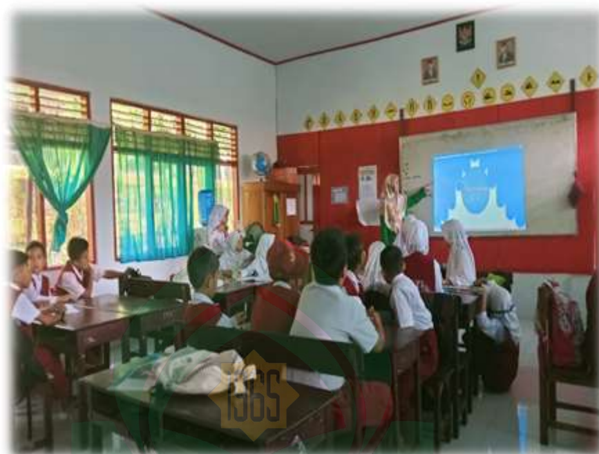
Gambar 1.3 (Menampilkan Vidio Pembelajaran Materi Operasi Hitung Campuran Bilangan Bulat)