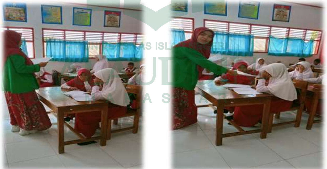
Gambar 1.2 (Memberikan Post-test Pada Kelas Kontrol)