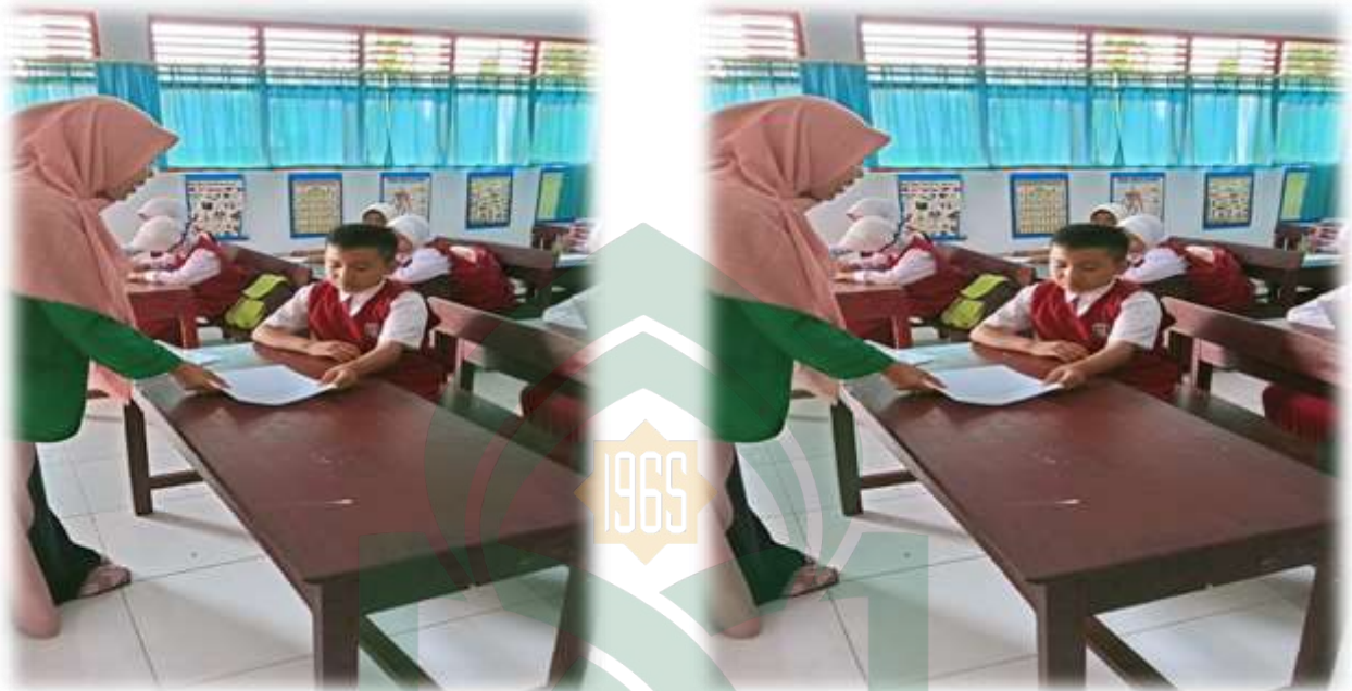
Gambar 1.1 (Memberikan Pre-test pada kelas Eksprimen)